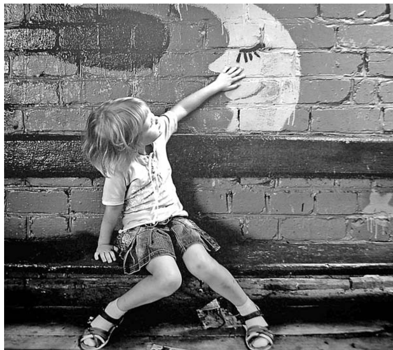
Говорят «далеко, как до Луны». Фотохудожник Александр Гривин иного мнения.

ников почта работала с промедлением. На долгожданную премьеру в Североморске пришли все равнодушные к искусству. Открытие было украшено традиционным перформансом. Затем ребята из танцевальной группы «АВС» продемонстрировали синтез танца и изобразительного искусства.