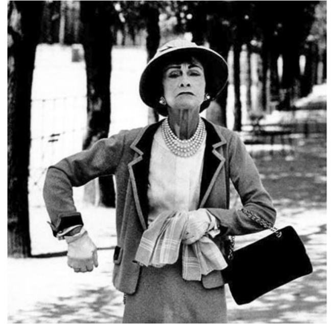
Сама Коко Шанель предпочитала носить клатчи на металлической цепочке.

В последних летних коллекциях ведущие дизайнеры уделили клатчам особое