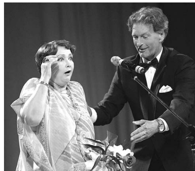
Народная артистка России Зинаида Кириенко и заслуженный артист Сергей Колесников.