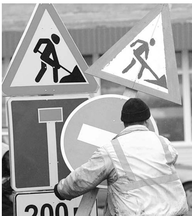
В теплые дни ремонт и работы по благоустройству ведутся с раннего утра и допоздна.

Подготовила Елена ЯКУНИНА.