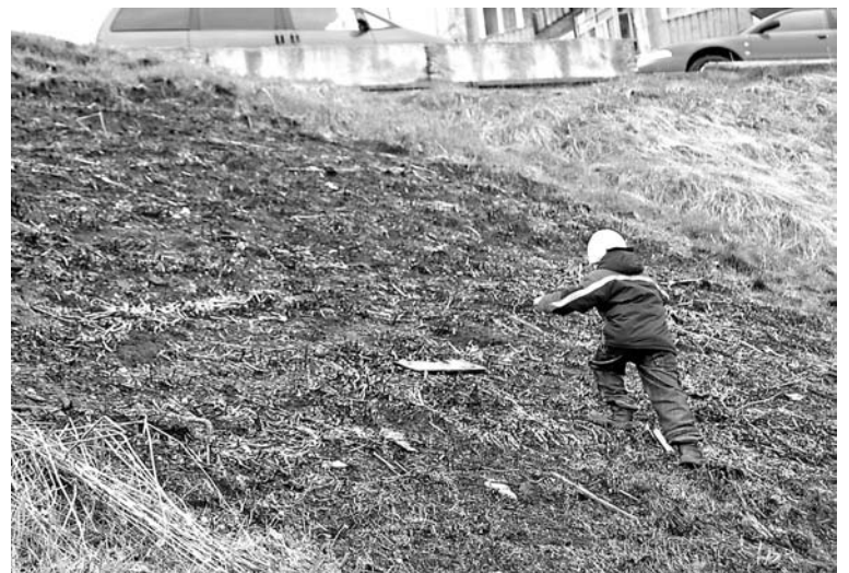
Предположительно, из-за поджога детьми сухой травы сгорела деревянная постройка на ул.Северной.

- Сжигать ее не рекомендуется. Ведь продукты горения попадают в атмосферу, а значит, мы ими дышим. К тому же стра-