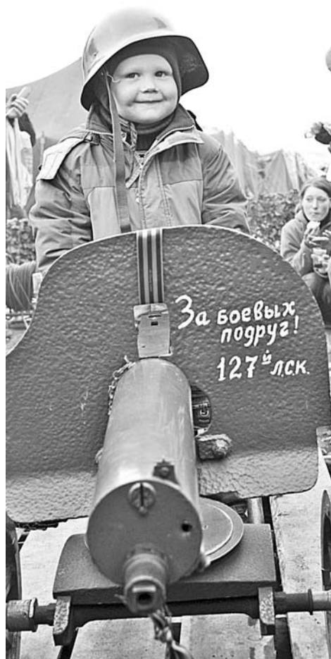
Счастье - когда дети улыбаются.

Информационная кампания по противодействию жестокому обращению с детьми проходит по всей России. Ее инициатор - Фонд поддержки детей, находящихся в трудной жизненной ситуации, созданный по указу Президента РФ и Минздрава России. Мурманская область также примкнула к проведению кампании.