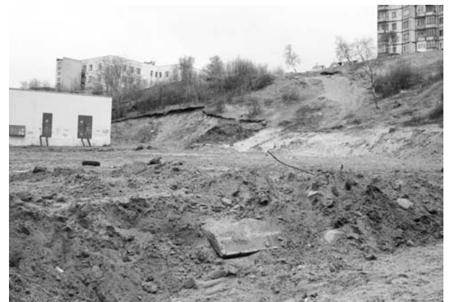
Грядущей зимой с этой горки североморской детворе покататься будет уже нельзя.

В минувшую субботу около стройки состоялась