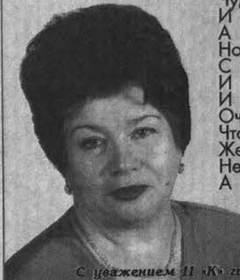
С уважением П.К. гимназии N 1.

Чудес на свете не бывает, И юность не вернуть назад, А годы, словно льдинки, тают, Но стоит ли о них вздыхать? С годами женщина мудрее, И в ней другая красота, И поступь гордая, и статность Очарования полна. Чтoб дольше это сохранил, Желаем счастливо прожить, Не волноваться, не грустить, А главное - здорово быть!