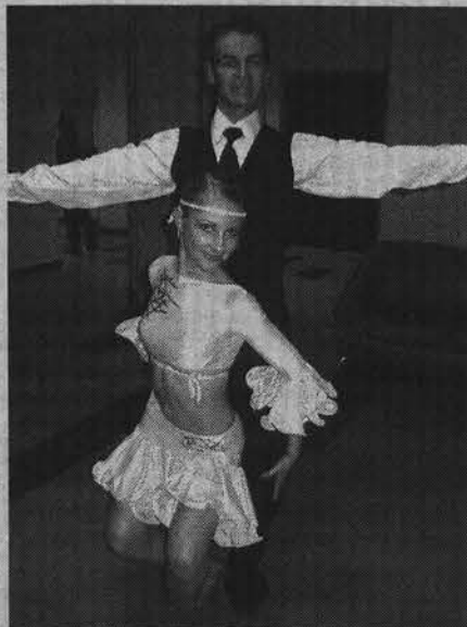
Танцоры мурманского клуба «Миллениум дэнс» очаровали своим искусством не только строгое жюри, но и многочисленных зрителей.

«народный» или «образцовый». Обязательны такие номинации, как «Западноевропейская программа» и «Латиноамериканская»,