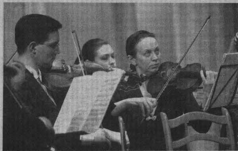
Мурманский филармонический оркестр.