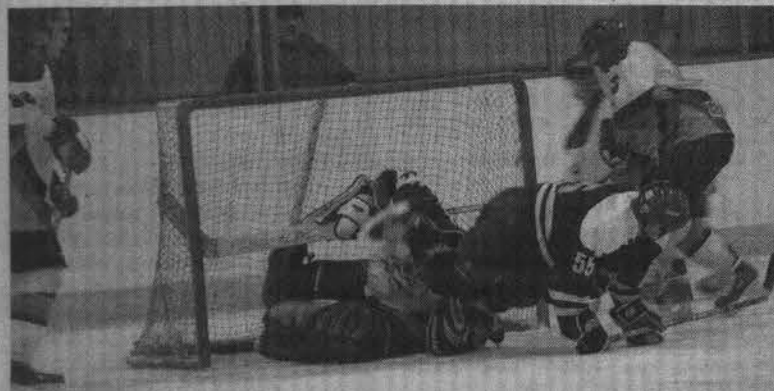
Опасный момент у ворот оленегорского «Горняка».

Кроме двух результативных выпадов за весь матч гости ничего не противопоставили мощному натиску хозяев ледовой арены, которые с первых же минут встречи постарались уйти в отрыв от соперника, ошеломив его четырьмя акцентированными ударами. Удачный старт был обеспечен их высокими скоростями, прекрасным дриблингом и прессингом по всей площадке. Во втором периоде давление североморцев лишь дважды официально увенчалось успехом - судьи почему-то пропустили момент, когда шайба два раза подряд пересекала линию ворот, причем один раз даже загоралась красная лампочка. Между прочим, некачественное судейство