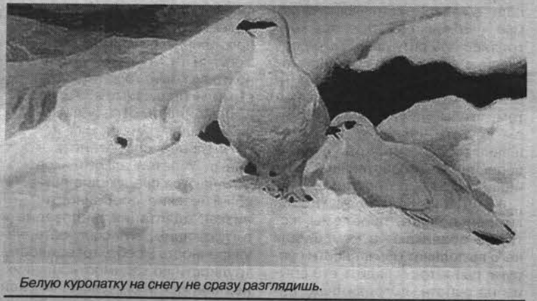
Белую куропатку на снегу не сразу разглядишь.