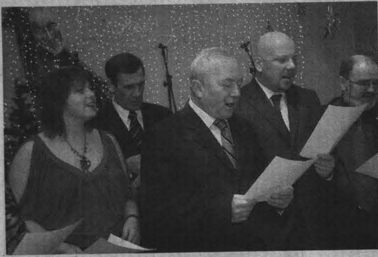
Пресса, власть, бизнес в едином хоре.

В целом же за заслуги на профессиональном поприще были