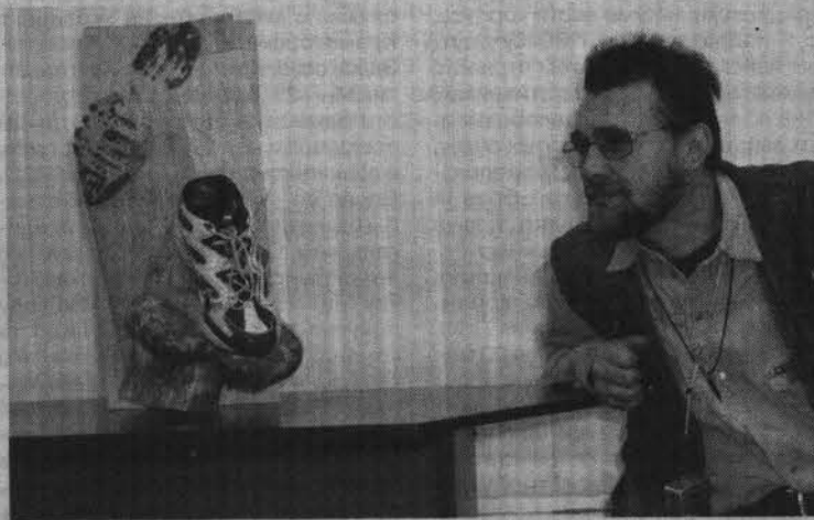
Произведение искусства как повод для раздумий.

Крещение Господне или Богоявление - великий праздник, отмечающийся православной церковью 19 января. Установление праздника Богоявления относится к первым векам христианства. В этот день Иисус Христос принял крещение от Иоанна Предтеча (Крестителя), явившись на реку Иордан. Благодаря искупительным заслугам Христа обряд крещения впоследствии получил значение таинства и стал знаком покаяния и очищения людей. Второе название - Богоявление - праздник получил потому, что при Крещении Спасителя произошло явление всех трех лиц божества: Отец с небес гласом свидетельствовал о крещеном Сыне, и Святой Дух в виде голубя сошел на Иисуса, подтверждая таким образом Слово Отца.