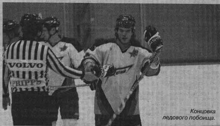
Концовка ледового побоища.