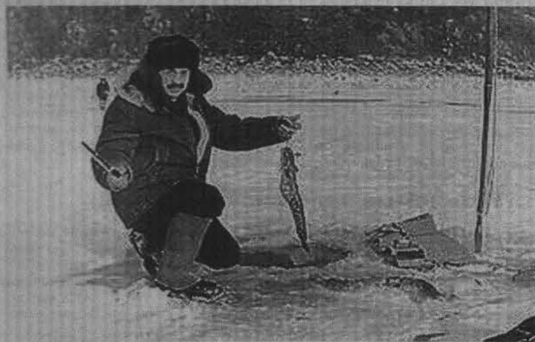
На зимней рыбалке и такой налима - большая удача...