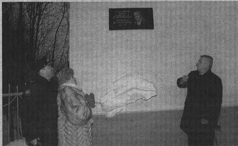
Торжественное открытие мемориальной доски на ул.Пикуля.

Александр ПАНОУШКИН.