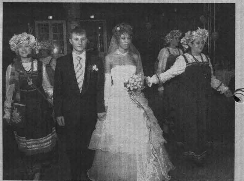
По обычаю молодым повязали руки одним полотенцем - на долгую жизнь.