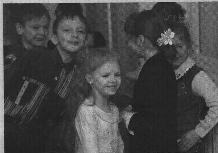
Если дети в школе улыбаются, значит, детям в школе хорошо...

ческой организации «Друзья Севера». Стараниями ребят возле школы зеленеют маленькие кедры, клены, цветут ландыши и растет земляника. В копилке организации сотрудничество с Международным фондом защиты животных IFAW.