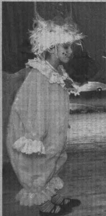
Желтыш готов прийти на помощь другу.