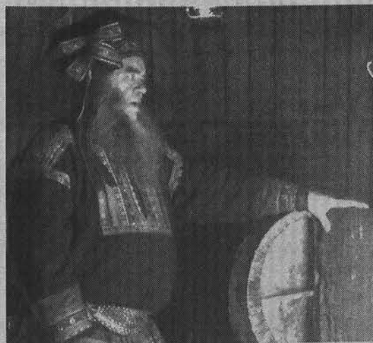
Только настоящий шаман может изгнать злых духов.