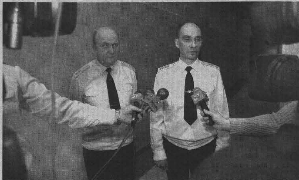
Первый брифинг нового командующего СФ.

Подготовила Елена ЯКУНИНА.