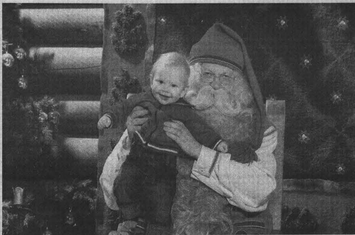
Это фото с финским Дедом Морозом обойдется в 23 евро (примерно 800 рублей).

Во-первых, здесь расположена резиденция главного героя новогодних праздников Санта-Клауса, посмотреть на которого стекаются жители со всех уголков планеты. В его владениях находятся Главпочтамт, мастерские, сувенирные лавки, многочисленные кафешки и ресторанчики, цены в которых, к слову, достаточно высоки. Самое привлекательное в деревне для детей и