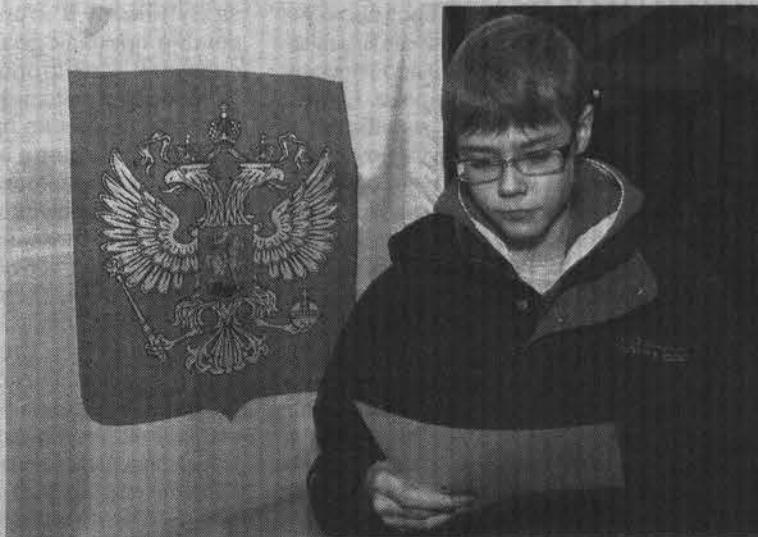
Интересно с партийным разнообразием познакомиться.

родского ученического парламента. В Норвегии выборы проходят в каждой школе и подго-