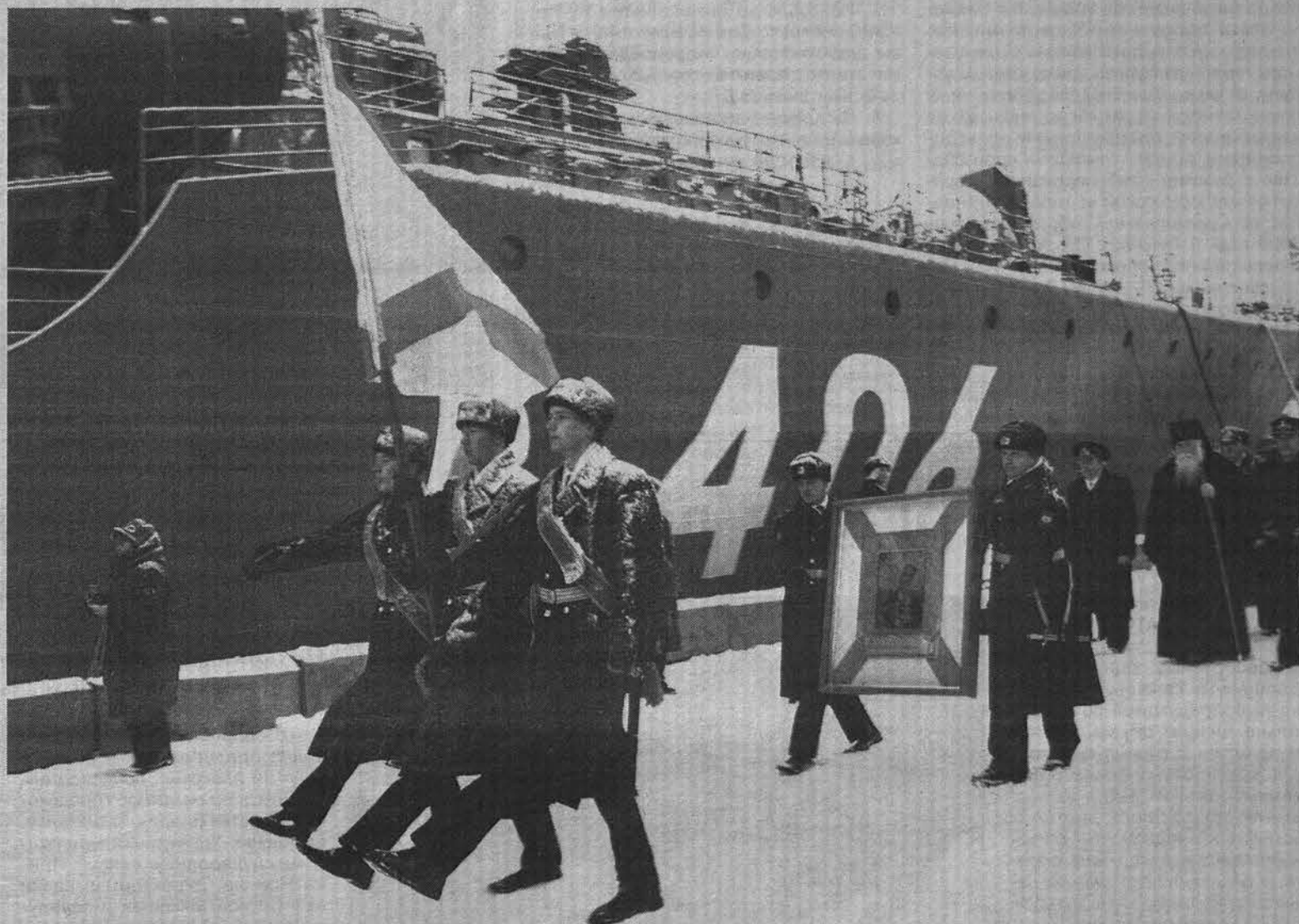
Ушаковский ход под Андреевским флагом завершился на североморской земле.