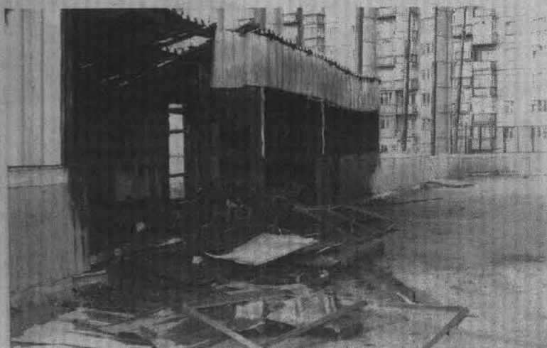
Теперь ребятам негде оставить вещи и переодеться.

Обгоревшие деревяшки и груды пепла – это все, что осталось от деревянной пристройки, которая использовалась как раздевалка. Располагалось помещение на спортивной площадке на улице Полярной и примыкало к гимназии №1. От чьей-то «невинной шалости» строение вспыхнуло, как спичка, и выгорело дотла.