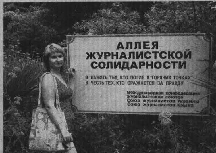
Эта аллея открылась в Ялте.

- Взаимоотношения и сплоченность журналистов во многом зависят от каждого из нас. В нашем небольшом городке, где газет не так много, сплоченность, конечно же, присутствует. Единению способствуют такие масштабные ме-