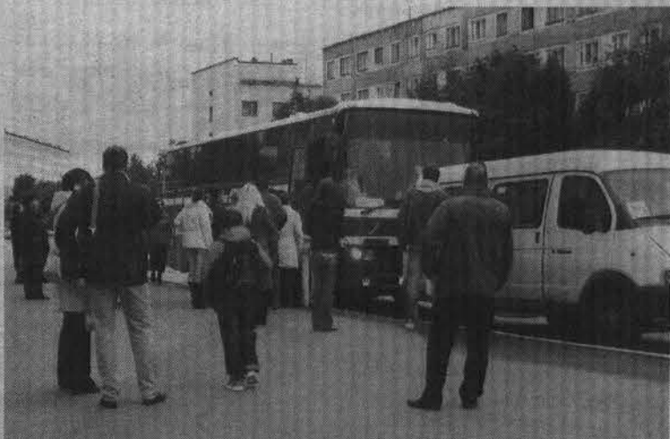
Уже на ул. Душенова в переполненный салон автобуса попадали не все желающие.