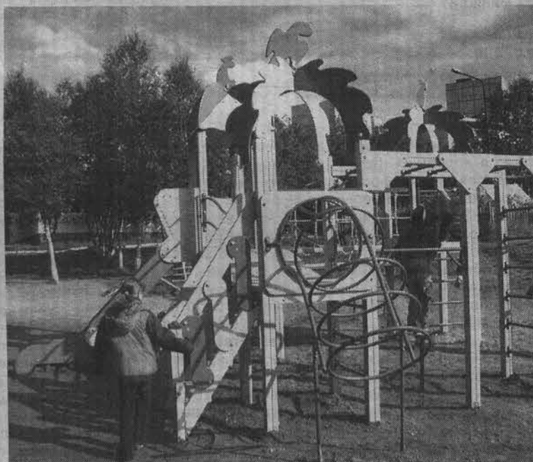
Игровой комплекс может быть и волшебным замком, и космическим кораблем.