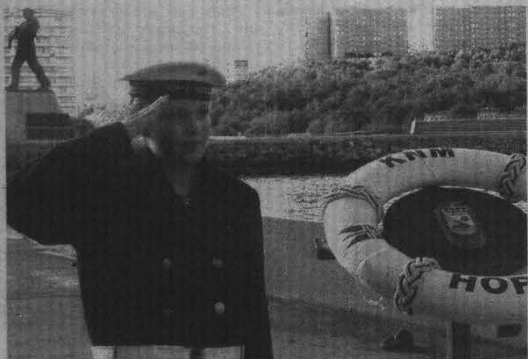
Среди 71-го члена экипажа «Хортен» 8 очаровательных девушек, что для российских коллег в диковинку.