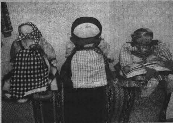
Каждая кукла В.Хрущевой имеет свое магическое значение.