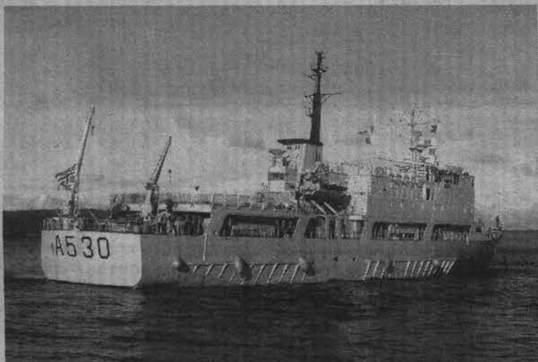
В 1985 г. на плавбазе «Хортен» была каюта самого короля Норвегии.