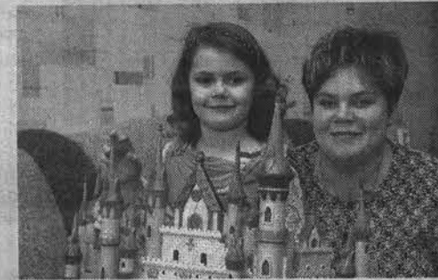
«Мой дом – моя крепость» – так считают в семье Долгановых.

Наталья СТОЛЯРОВА . Фото Льва ФЕДОСЕЕВА .