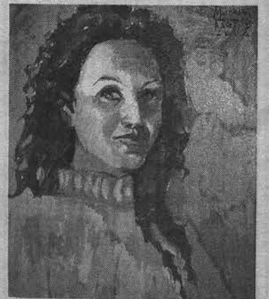
«Оля в синем».

Даже если зритель не лучшим образом относится к натюрмортам, цветы кисти М.Глотова не оставят его равнодушным. Пусть картины и далеки от реализма, но пропитаны необыкновенным задором, о чем говорят и их названия: «Оранжевое настроение», «Салют». Что касается пейзажей - есть виды бескрайних просторов Средней полосы, есть и северо-