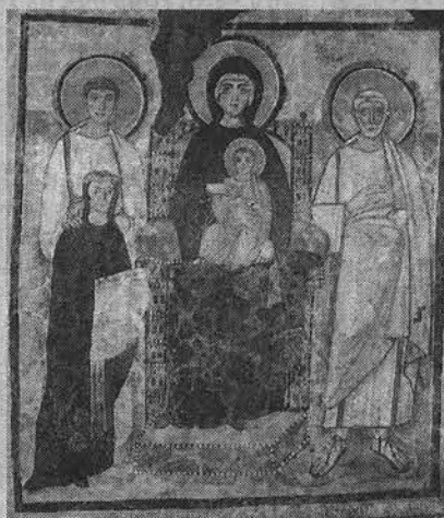
Богородица на троне со святыми Феликсом и Ададом. Рим, VI в.