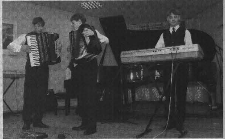
Участники ансамбля «Бригантина».

Номинация «Сольное исполнение на синтезаторе» была представлена двумя возрастными группами. В младшей ни один участник не набрал количества бал-