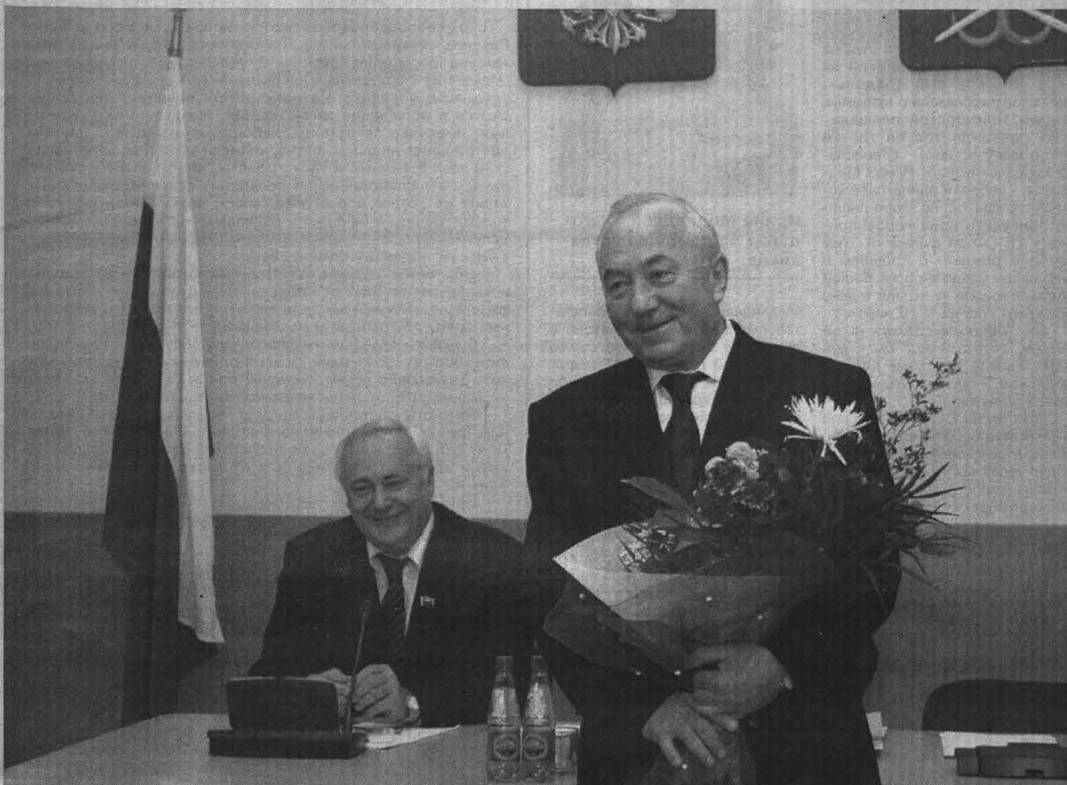
Президент и областная дума кандидатуру губернатора Юрия Евдокимова одобрили.