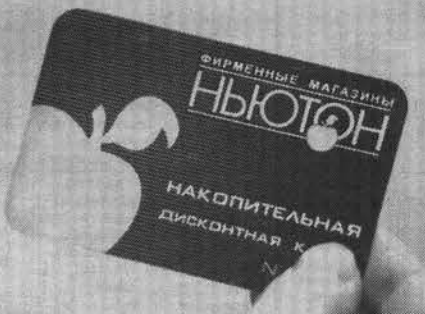
Еще недавно дисконтная карта «Ньютона» была гордостью владельца.