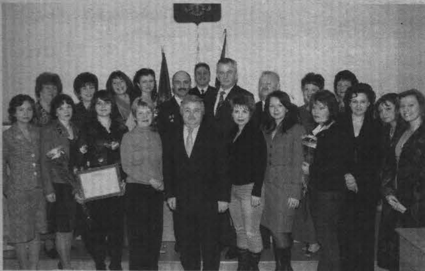
Лучшая память о конкурсе – фото с мэром города.