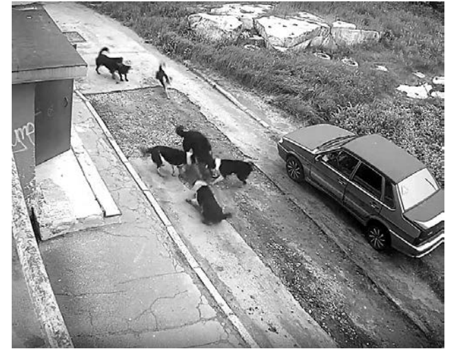
Момент нападения был заснят на камеру видеонаблюдения.

В минувшую пятницу около дома №7 на ул.Сивко свора из семи собак напала на домашнего миниатюрного питомца. И хотя животных удалось отогнать от их жертвы, пострадавшего пса все же пришлось усыпить, так как, со слов хозяев, были перекушены позвоночник и кости.