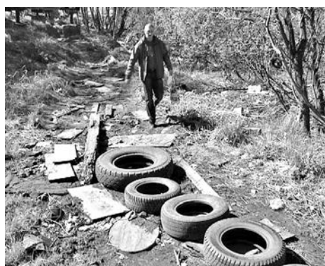
Еще недавно было так.

- Мы вывезли отсюда тонну мусора, отсыпали грунт, разровняли площадку. Пришлось выкопать дренажную канаву, чтобы