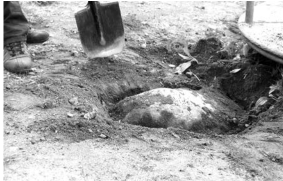
Размер злополучного камня оказался внушительным.