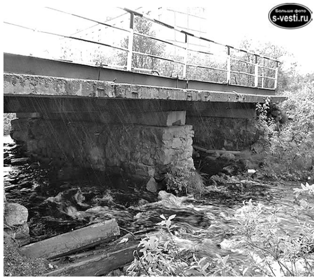
Мост давно уже держится на одном честном слове.

Скриншот с записи камеры видеонаблюдения.