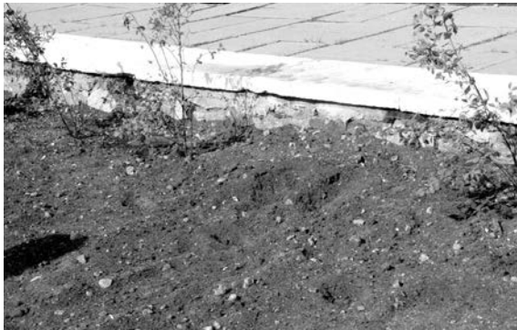
«Следы преступления» на месте выкопанного куста спиреи.