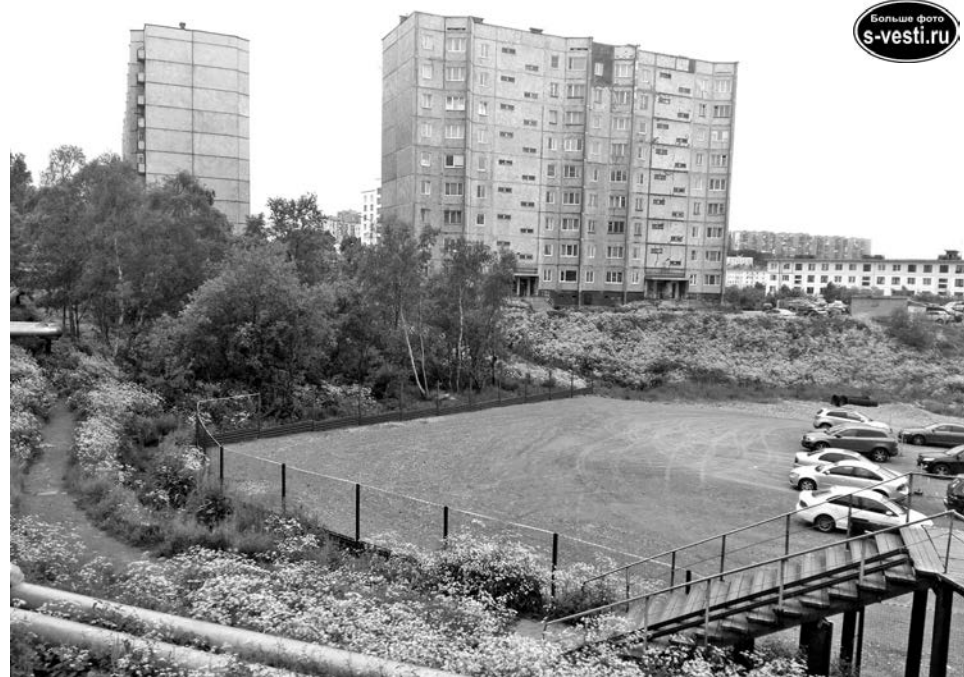
Теперь есть место для машин, и пешеходы не в обиде.