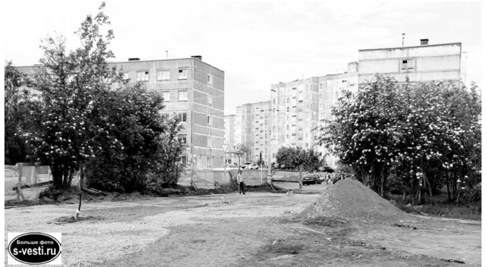
Подрядчик ИП Погосян А.Р. пообещал, что сквер «Народный» будет построен в срок.

- Это зона ответственности ресурсонабжающей организации, поэтому работы здесь не могут быть выполнены в рамках благоустройства города. Но, чтобы