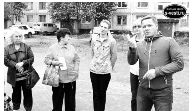
Аналогичные вопросы волновали и жителей Авиагородка, где 13 июля прошла еще одна встреча депутатов и представителей коммунальных служб с североморцами.

- Если вопрос только в дорожке, то мы можем ее поднять, чтобы лужи не образовывались. Но если делать в целом, то это уже не считается ямочным ремонтом. А УК выполняет восстановительные работы по