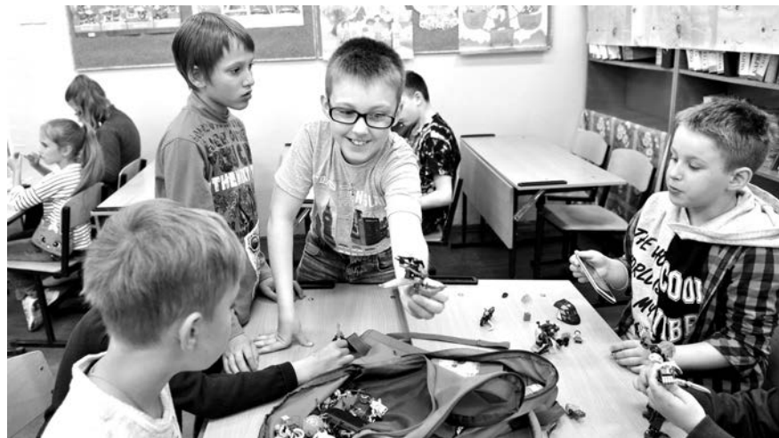
В пришкольном лагере каждому найдется занятие по душе.