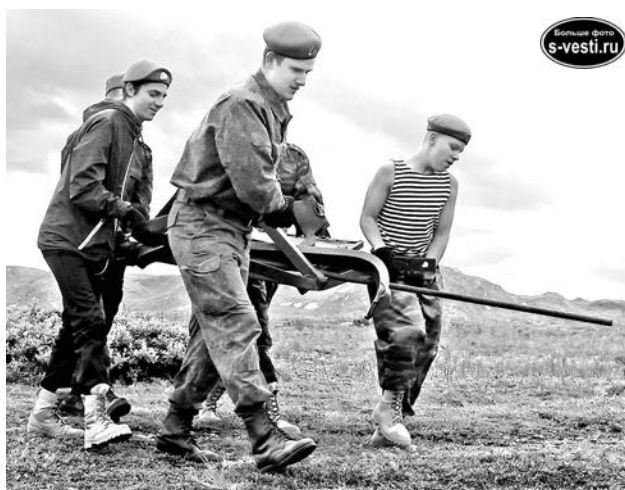
За полтора часа юнармейцы собрали почти тонну металлолома.

Лом свозят из разных точек острова и складывают в