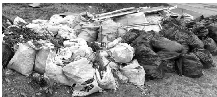
Мешки с мусором уродуют и без того не самую презентабельную улицу Северную с июня. А место прохладное: рядом офис ЕРЦ, почта, трап на ул.Сизова...