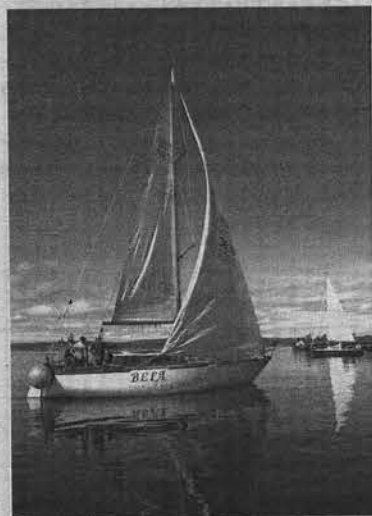
Маневры парусников - волнующее зрелище.