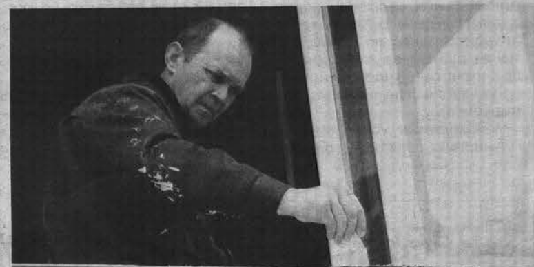
В СШ №12 ремонт идет полным ходом. Выделенных средств хватило на значительный объем работ.