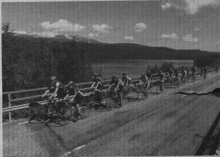
Путешественники крутили педали в любую погоду.

Сам я больше занимаюсь игровыми видами спорта, играю