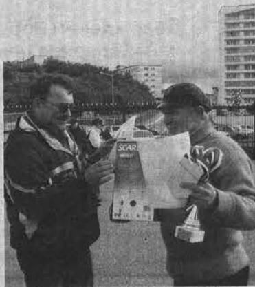
За 2-е место награждается экипаж яхты «Вега».