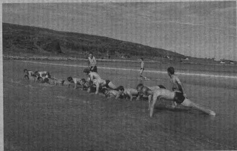
Обязательную утреннюю зарядку можно разнообразить, если рядом море.