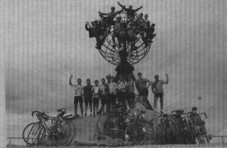
«Пилигримы» на мысе Нордкап — северной оконечности Европы.

Андрей СЕРИКОВ.