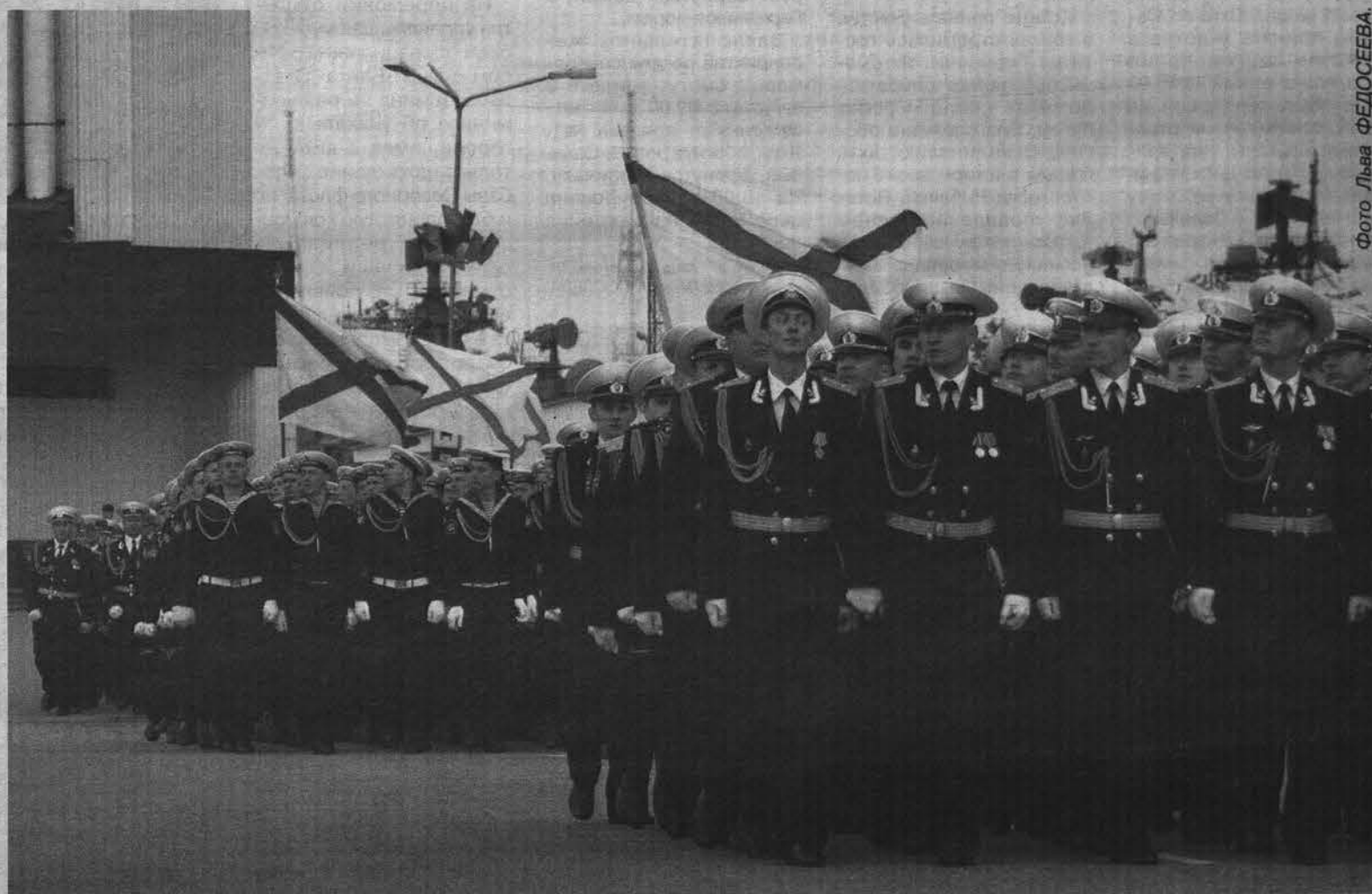
Моряки и авиаторы, военные инженеры и строители в День ВМФ торжественным строем прошли по главной площади Североморска.

Комитет имущественных отношений ЗАТО г. Североморск извещает: посредством публичного предложения продано муниципальное имущество – нежилое здание общей площадью 303,8 кв.м, расположенное по