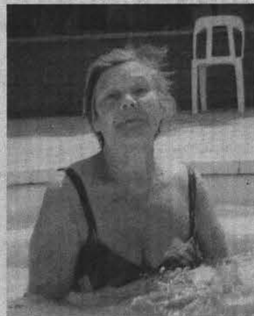
Нина Николаевна отдохнула на славу.

Наталья СТОЛЯРОВА.