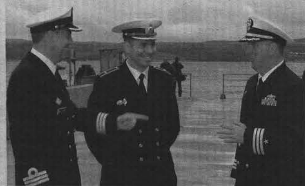
Кнут Гриндхауг (слева) и Тод Блец (справа) общались через переводчика.

торое помогло преодолеть трудности перевода, возникающие в ходе совместных действий. Удостоился Северный флот и комплиментов как хорошо оборудованный, модернизированный и способный выполнять поставленные перед ним задачи.