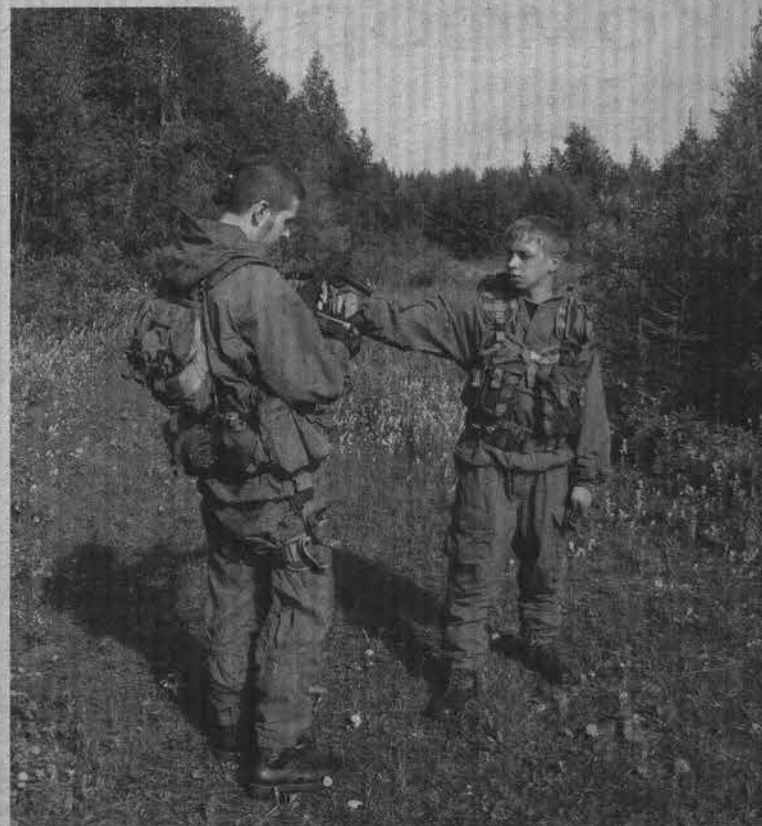
Страйкболисты в деталях копируют обмундирование и вооружение армий разных государств.

Екатерина ГУДКОВА.