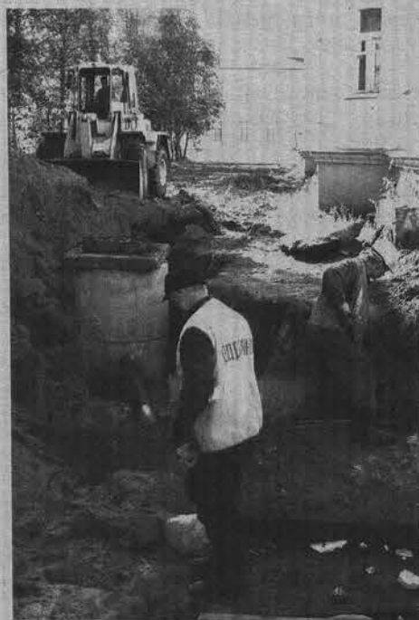
К дому на улице Сафонова, 2 подводят резервный водовод.