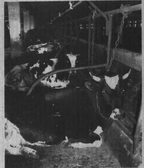
Сейчас в коровьем родильном отделении стать мамами готовятся 50 буренок.

в североморских магазинах. Так что если увидите ценники со ссылкой на наш совхоз, знайте, что это обман. Если бы предприниматели делали заказы, мы бы с удовольствием с ними сотрудничали. А пока нашу продукцию можно приобрести только в ларьке на территории совхоза.