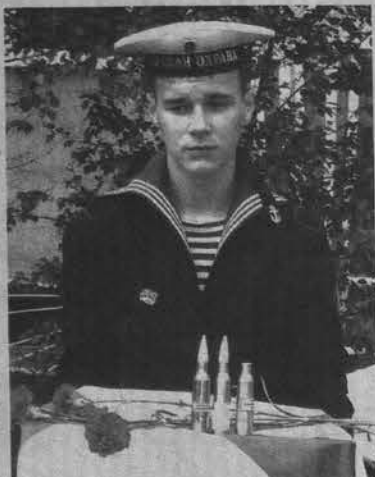
Заслуги война и писателя чтят и старшее поколение, и молодежь.

В ближайшее время в Мурманск привезут постамент, изготовленный на Мончегорском камнеобрабатывающем заводе. Бюст тоже уже готов - скульптор Александр Арсентьев трудился над ним почти месяц. Ав-