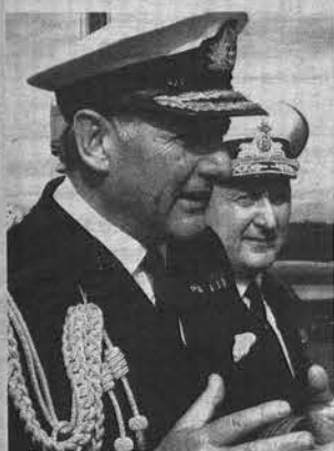
Адмирал Джонатан Бэнд и вице-адмирал Николай Максимов.