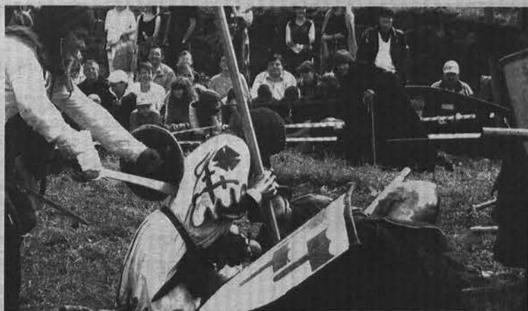
Главным событием фестиваля стал штурм крепости.

С 4 по 6 июля в г. Приозерске Ленинградской области прошел V Всероссийский военно-исторический фестиваль «Группа реконструкции Средневековья «Русская крепость».