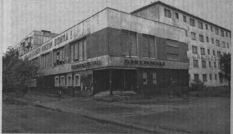
На прошлой неделе мусора на входе в бывший магазин поубавилось, но чьими усилиями — неизвестно.

Пока федеральное богатство пустовало, жители соседних домов нашли ему отличное применение, правда, в данном случае отличное — значит отличающееся и скорее разнящееся с общепринятыми нормами логики и морали. Люди просто приспособили законсервированный магазин под свалку — мешки с отходами стали закидывать в пустой магазин через окна и дверной проем, ведь он по пути в школу и на автобусную остановку, а до контейнеров крюк в 200 метров. Местные жители рассказывают, что зимой это место превращалось в приют для тех, кому негде выпить и принять дозу. Еще одна проблема — любопытная детвора, которая в