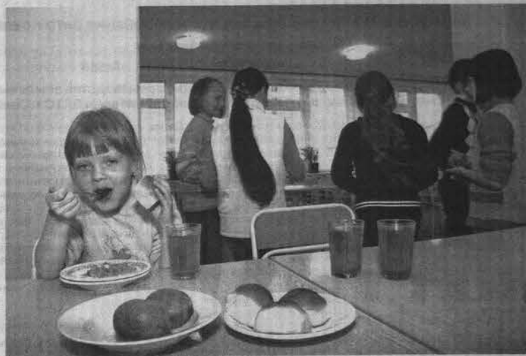
В столовых летних школьных лагерей готовят не только разнообразные и полезные, но и по-домашнему вкусные блюда.

За истекший летний период нарушений в организации питания в лагерях дневного пребывания не выявлено. А для большего спокойствия родителей за здоровье своих чад добавим, что за процессом приготовления пищи в столовых образовательных учреждений ежедневно наблюдает школьный медик. Он же снимает пробу с блюд прежде, чем они окажутся на обеденных столах. Так что о том, что салат заправят майонезом или уксусом, а вместо свежеспеченных блинчиков или котлет предложат полуфабрикаты (эти продукты запрещено использовать в приготовлении блюд для детей),