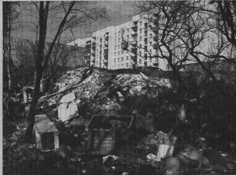
Поневоле задаешься вопросом «помойка между домами или наоборот?».

Процессуальное законодательство тоже несовершенно, как, впрочем, и природоохранное. В прошлом году по различным пунктам статьи 2 «Нарушение правил благоустройства населенных пунктов» Закона Мурманской области «Об административных правонарушениях»