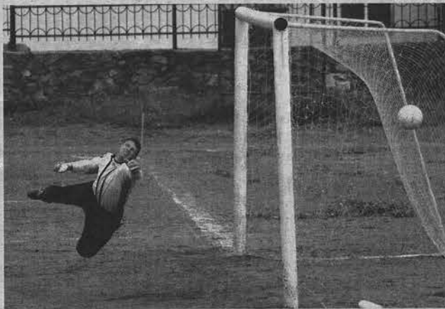
Точный удар в дальний угол - вратарь бессильен!