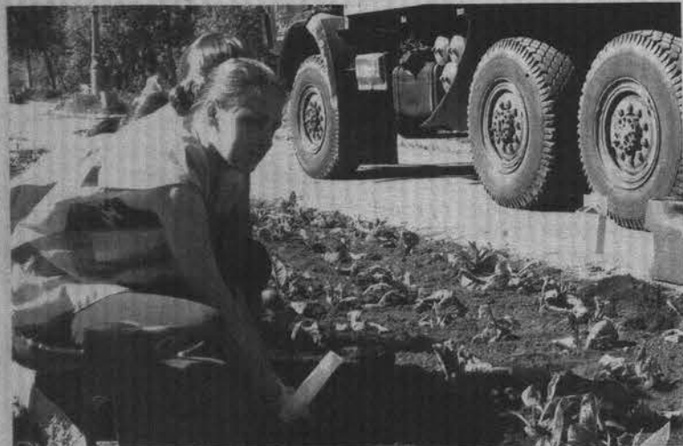
Кроме коммунальщиков ландшафтным дизайном занимаются школьники из трудовых бригад.