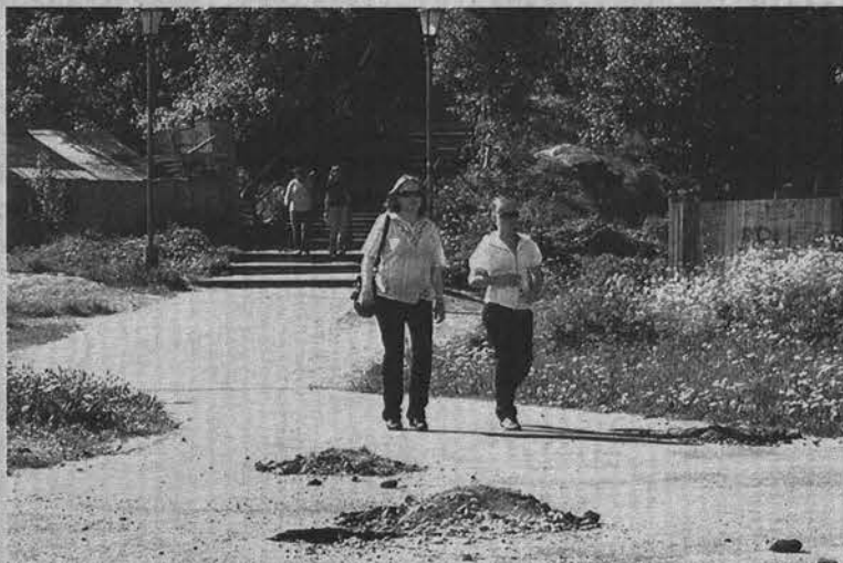
Пока пешеходы свободно идут от трапа по асфальтовой дорожке, но, возможно, скоро привычный путь будет отрезан.

Екатерина ГУДКОВА.