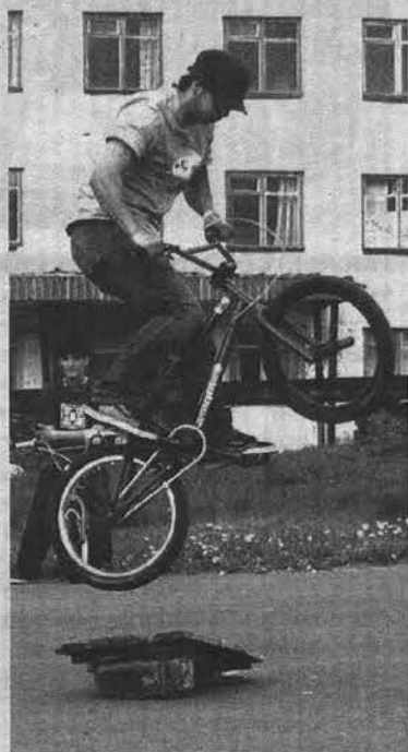
Участники «Антигравити 51», привыкшие кататься с искусственными препятствиями, вроде рампы, на площадках в поселках фурора среди публики не произвели. Но местные мальчишки были в восторге.

Субботним утром, погрузив реквизит, призы и аппаратуру в автобус, специалисты отдела и активисты городской волонтерской группы, организации «Молодая Гвардия» и клуба любителей экстремальных видов спорта «Антигравити 51» отправились с праздничной программой в поселки. Площадь ДК «Судоремонтник» в п. Росляково стала первой остановкой на маршруте, а центральная в п. Североморск-3 – конечной. Помимо развлекательной программы с конкурсами жителей ожидали тематические площадки. Желающие могли посетить молодежный ЗАГС и вместе с «Молодой Гвардией» нарисовать портрет семьи. Были даже гонки на авто, пусть игрушечные и на веревочке, зато азарт неподдельный. Проверить здоровье можно было весьма нехитрым способом – надувая воздушный шар пока он не лопнет. Молодежи с хорошими легкими нашлось немало, поэтому хлопки импровизированного салюта не стихали весь день. Популярностью пользовалась и площадка «Камасутра». Росляковская молодежь тоже готовилась к празднику и организовала три местных площадки – «Тату-салон», «Смешарики» и «Путаницу», предложив украсить тело, повеселиться, пуская мыльные пузы-