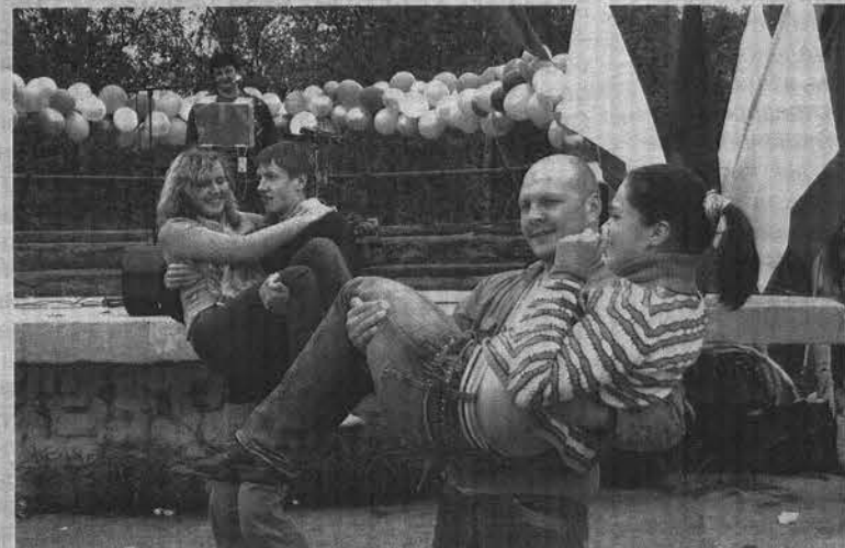
С такой ношей юношам танцевать нелегко, но зато очень приятно.