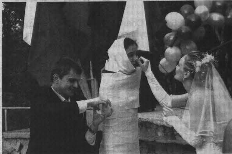
Проверку пеленанием прошли - к рождению детей готовы!

На танцевальной площадке перед зрителями развернулось боевое шоу. Свое мастерство