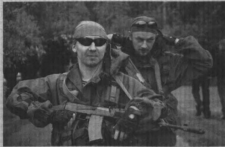
Узнать все о страйкболе можно было у бойцов из команды «Белые Тигры».