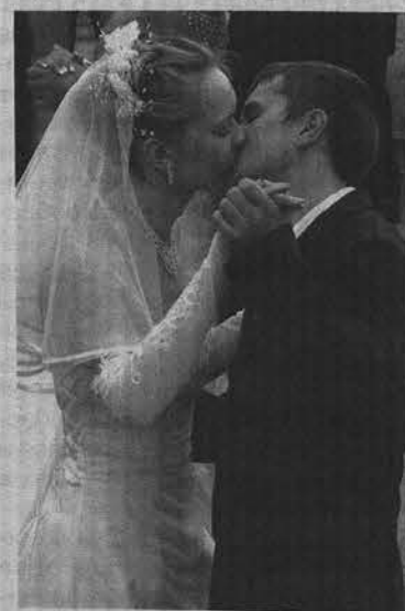
Страстный поцелуй может увеличить пульс до 100 ударов в минуту.

Подготовила Ирина ПАЛАМАРЧУК.