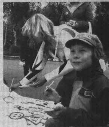
Раскрасить знамя молодежи помогла детвора.

Другими словами, праздник удался. Но о том, что молодежь ЗАТО живет интересно, свидетельствует даже не то, с каким размахом в нем празднуется ее день, а то, с каким энтузиазмом юноши и девушки участвуют в общественной жизни. А обилие грамот и благодарственных писем Главы ЗАТО, командующего СФ и молодежного отдела, которыми в течение двух дней были отмечены активисты моло-