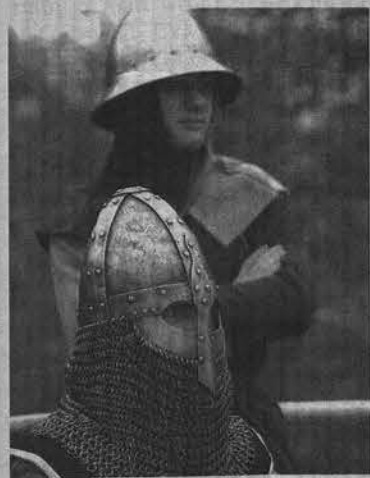
Не о таких ли рыцарях мечтают современные леди?!