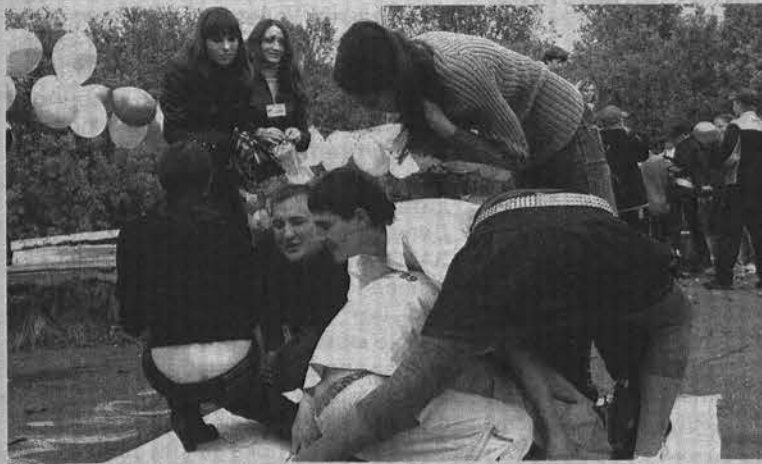
Где же ноги, где же руки - все смешалось в Камасутре.

И.АЛЕКСАНДРОВА, Ирина ПАЛАМАРЧУК.