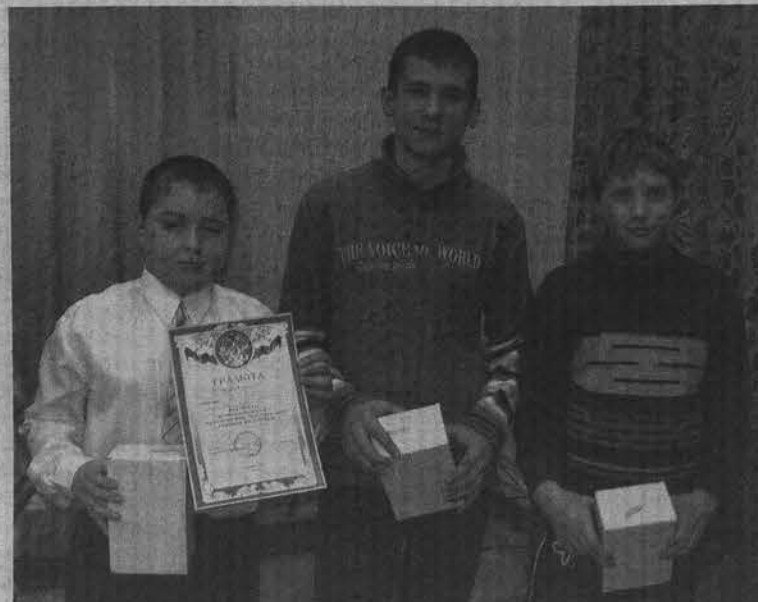
Команда победителей школы №1.