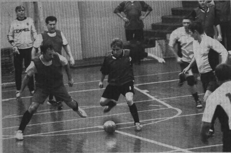
По накалу борьбы встречи ветеранов не уступали играм в высшей лиге.

Александр ПАНИЮШКИН.