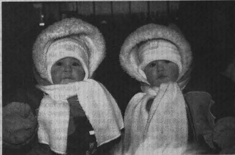
Эти близняшки дружны от рождения.

Выполняйте эти правила, и со временем вам удастся искоренить такое неприятное явление, как детские ссоры, конфликты и драки. Хотелось бы предложить еще несколько советов, которые