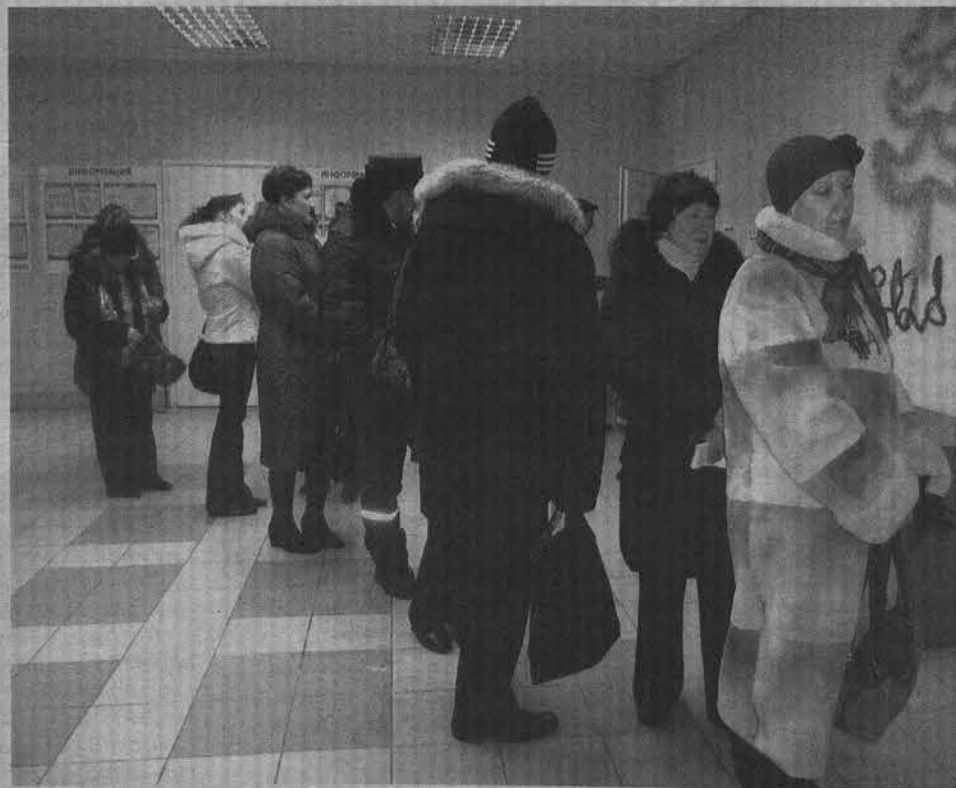
В ногах правды нет, но и присесть некуда.