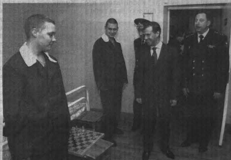
Матросам, проходящим лечение в терапевтическом отделении, первый вице-премьер пожелал здоровья.

мость, а также вакцинацию молодого пополнения не по призыву на место службы, а за полгода до призыва, дабы призывники поступали на флот на пике иммунного статуса.