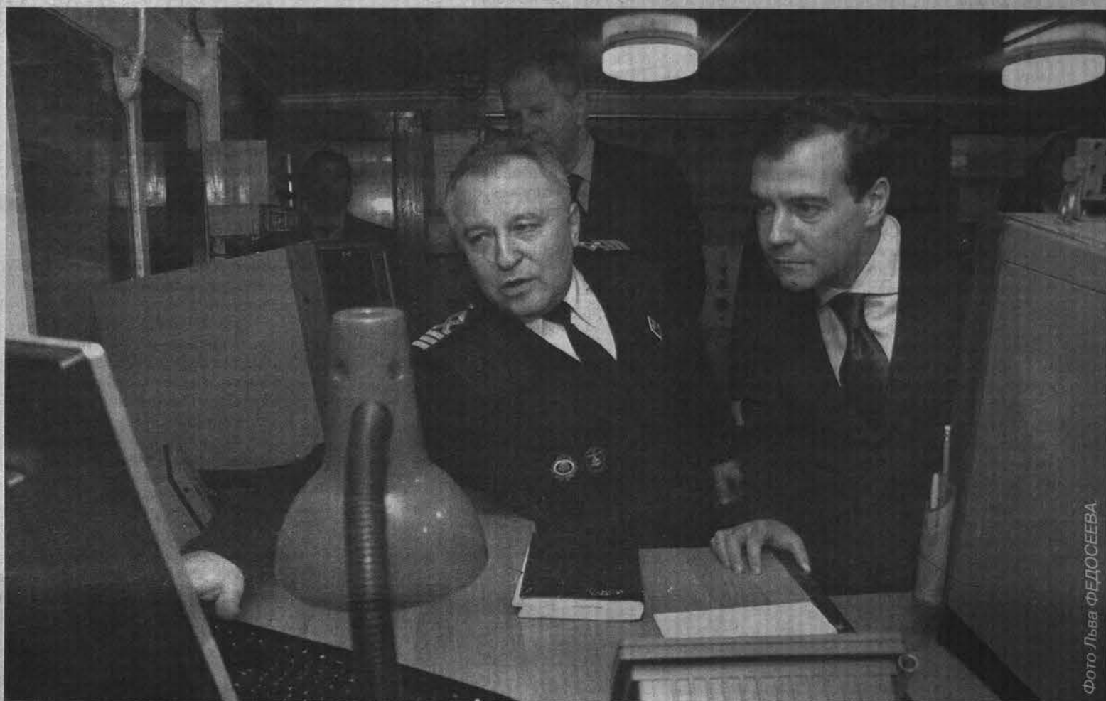
Капитан рыболовецкого судна «Капитан Моргун» В.Войтих впервые принимает на мостике такого высокого гостя, как первый вице-премьер Д.Медведев.