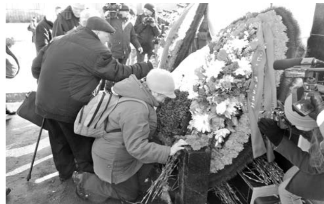
Самый эмоциональный момент Вахты Памяти.

- Из всех родных, которые ушли на войну, никто не вернулся, поэтому для меня этот праздник со слезами на глазах, священная дата! Светлая память всем тем, кто не вернулся с полей сражения и походов. Мы гордимся их