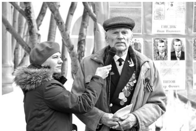
Североморцы - о своих героях. Акция «Стена памяти» у музейно-выставочного комплекса.