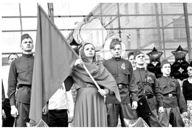
За атмосферу «Весны победного мая» отвечали творческие коллективы ДК «Строитель».