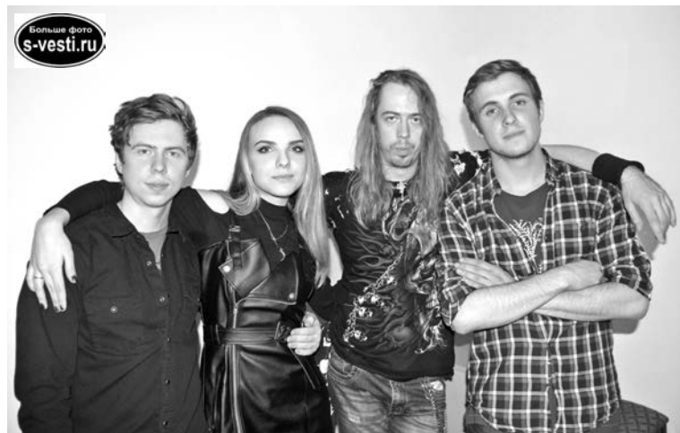
«Tailwind» делают то, что любят, и верят в успех.