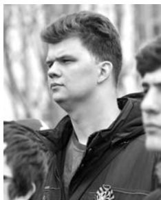
Быть призванным 9 Мая - большая честь.