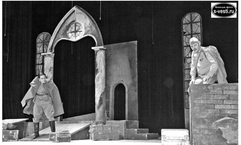
Удержаться от жестокой мести, преодолеть доводящее до безумия чувство вины. Рядовые Дударева - не побежденные, но сломленные.