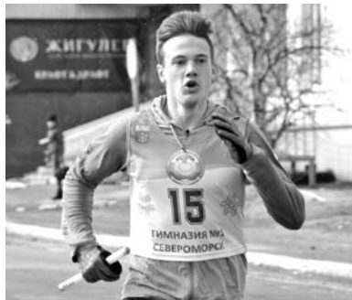
Традиционная эстафета в честь Дня Победы.