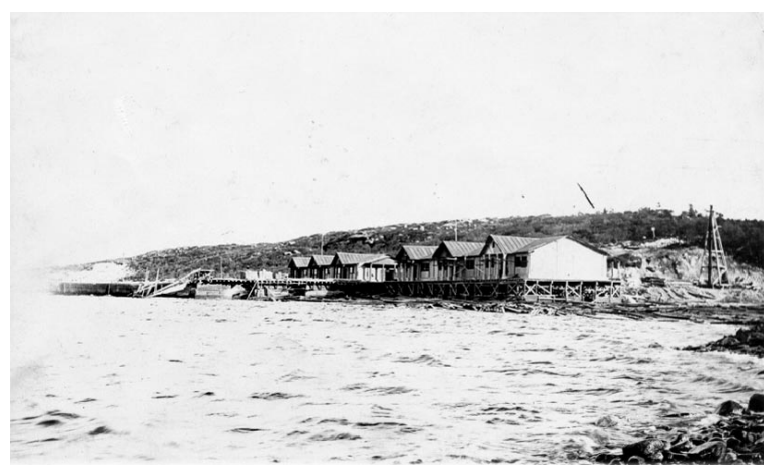
Деревянный морской причал построен в Ваенге в 1935г.

Материалы предоставлены СМБК.