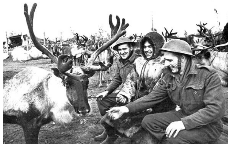
Советский оленевод с английскими авиамеханиками на одном из аэродромов Заполярья.