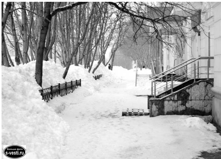
На улице Сафонова, 13, управляющая организация не успела убрать снег - и предприниматели справились своими силами.