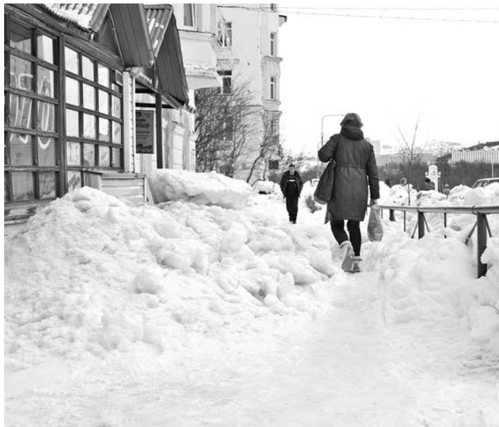
На Сафонова, 12, после очистки козырька над входом в магазины снежные кучи уже два дня мешают пешеходам.