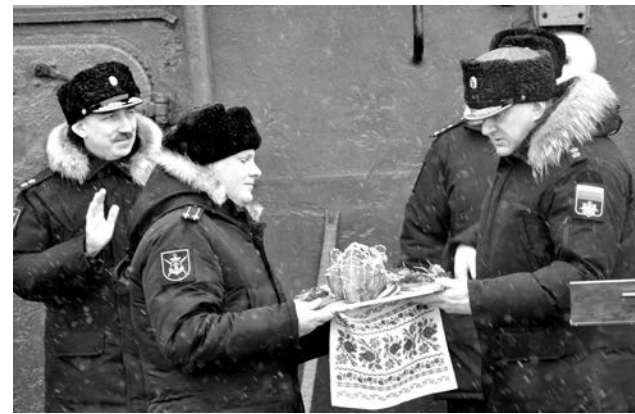
Командующий флотом по флотской традиции вручил командиру корабля жареного поросенка.

Когда корабль ненадолго заходил в порты Новороссийска и Севастополя, к мо-