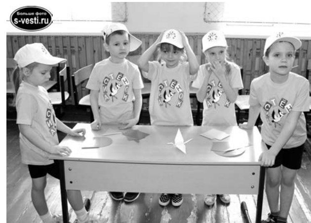
Команда веселых и находчивых «Аистенок».

В минувшую пятницу на базе Детского морского центра им. В. Пикуля прошли ежегодные городские соревнования для дошкольников «Забавные приключения белых медвежат».