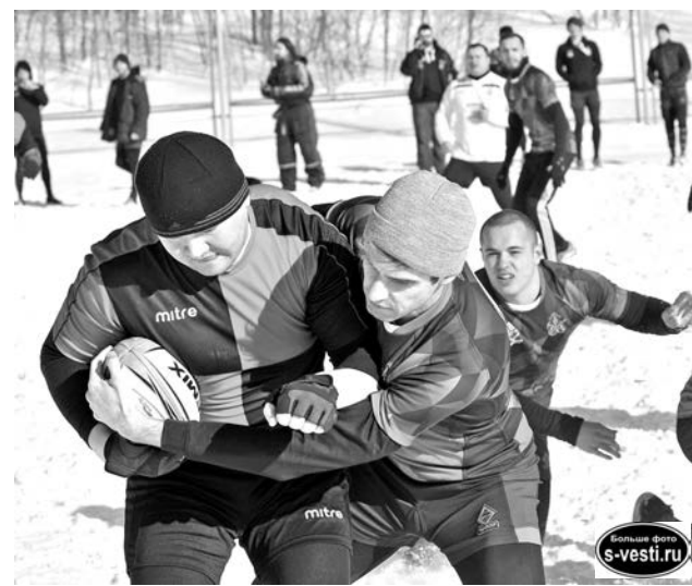
На «Празднике Севера» наши заняли третье место, что для начала совсем не плохо.