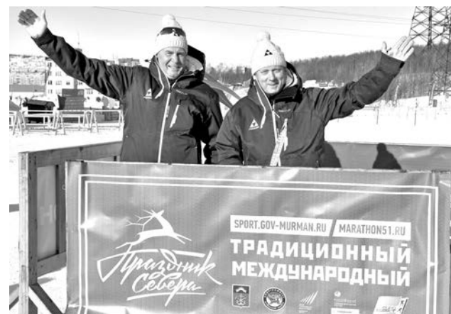
Четырехкратный олимпийский чемпион Николай Зимятков и трехкратный олимпийский призер Александр Завьялов.