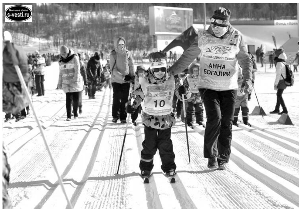
На предварявшем марафон Марше малышей юных лыжников сопровождали не только родители, но и олимпийские чемпионы Алексей Петухов и Анна Богалий.