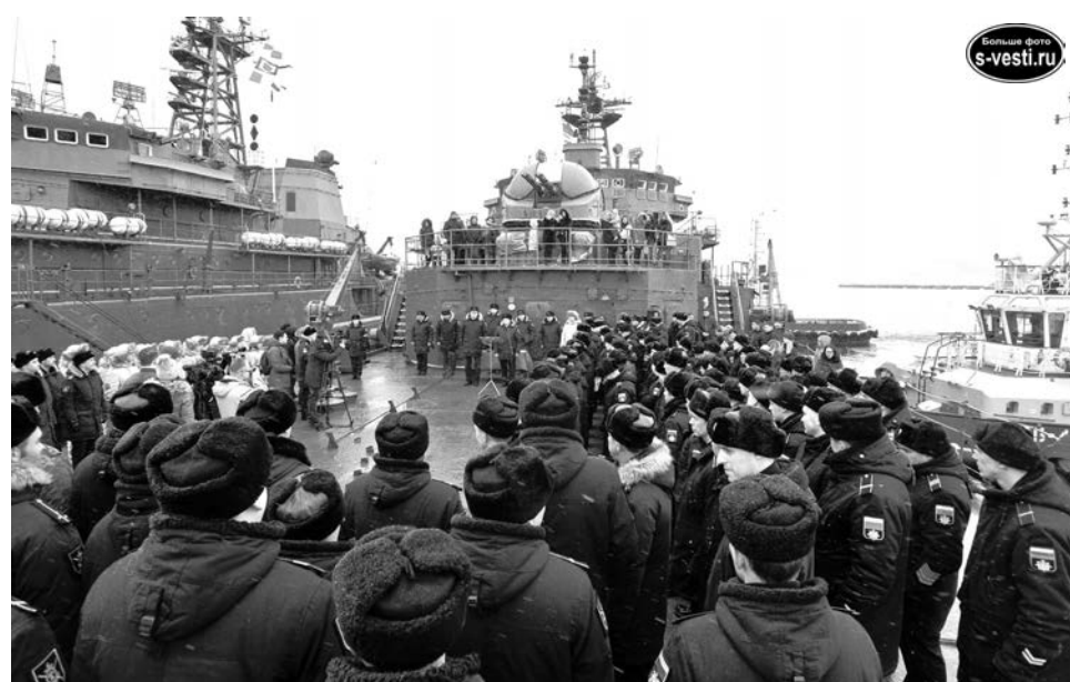
На верхней палубе корабля во время торжественного митинга получили награды лучшие военнослужащие.