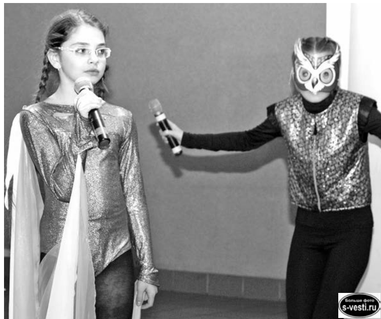
Звездочка так хотела быть кому-нибудь полезной, что была готова помогать даже недружелюбным совам.