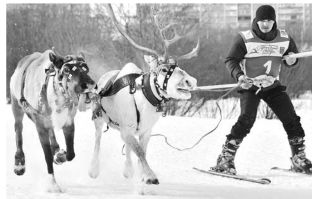
Оленеводы из Ловозеро показали класс в гонках на оленьих упряжках, в буксировке лыжника и метании аркана на хорей.