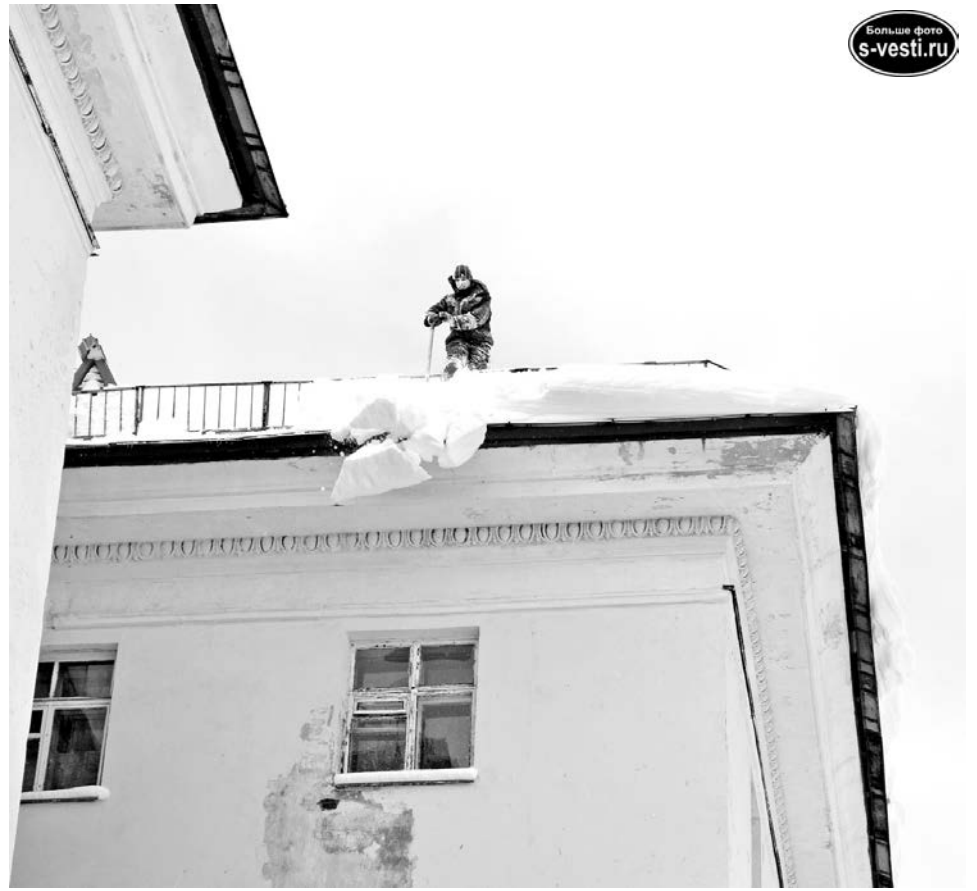
В дни обильных снегопадов промышленные альпинисты востребованы не меньше дворников.

Основной период очистки - ноябрь-март, но бывает, что из-за перепадов температуры и в мае то снег выпадет, то сосульки