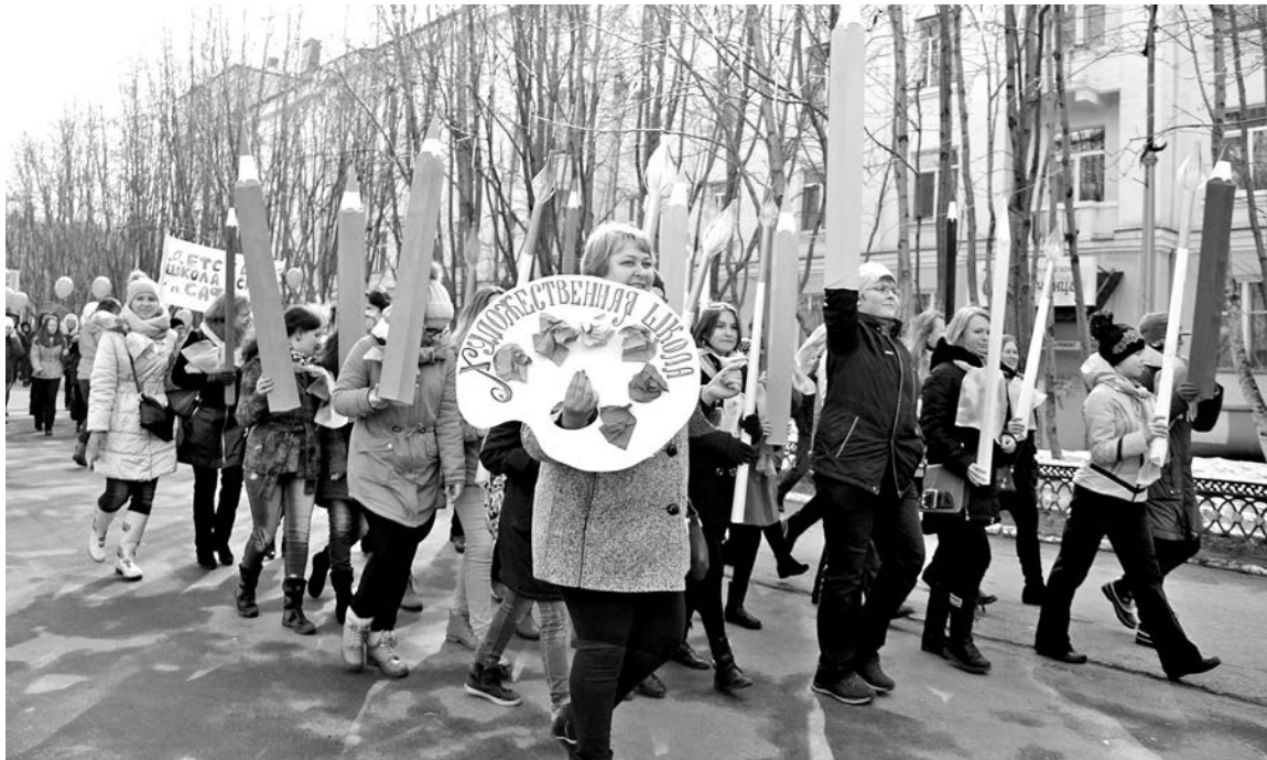
В прошлом году к городскому шествию североморцы подошли с душой.