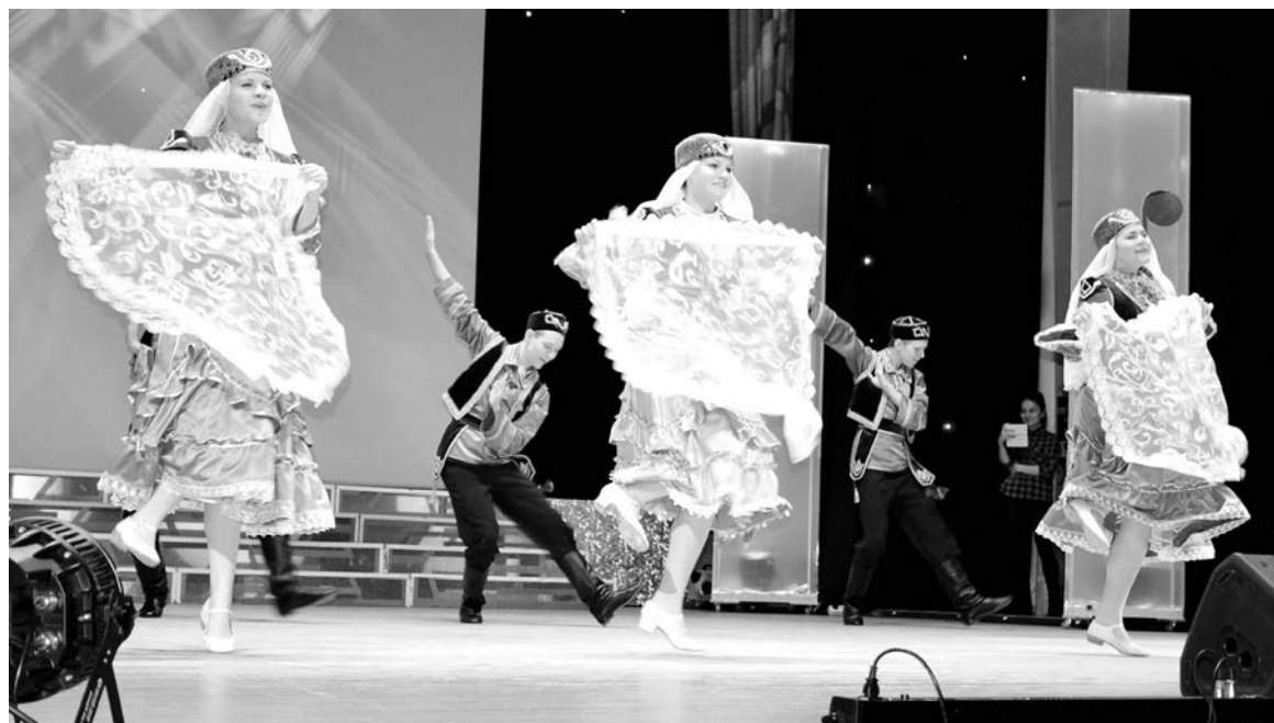
Татарский танец в исполнении образцового самодеятельного коллектива хореографического ансамбля «Каблук» ДК «Строитель».