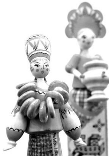
Мезенская роспись Марии Корсаковой.

Липа, темпера, гуашь и воск – все, что необходимо для создания мезенского орнамента. Эти современные материалы заменили сажу и охру, которые использовали мастера более двух