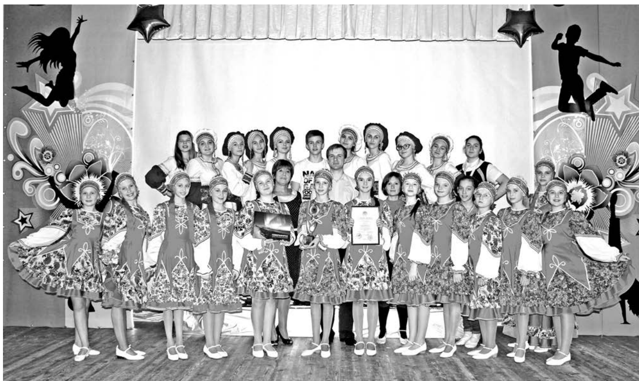
За высокий художественный уровень и исполнительское мастерство ансамбль народной песни «Родничок» носит высокое звание «образцовый детский коллектив».

Около двух тысяч детей занимаются по четырем направлениям в стенах Дома творчества, включающих различные объединения, студии и коллективы. В объединениях художественного направления ребята плетут из бисера, шьют модные наря-