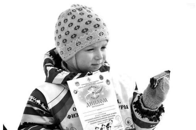
Сладкий приз - самая желанная награда.