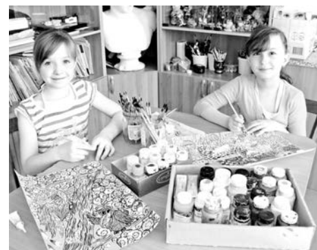
В объединении «Декоративное рисование» учат через рисунок выражать свои чувства и ощущения.