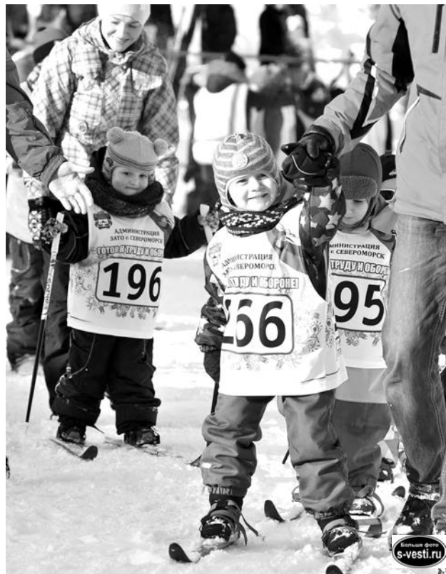
Свои победы «лучики» посвятили мамам и бабушкам.