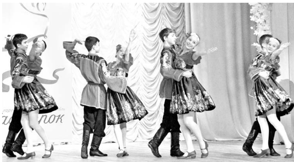
Образцовый детский хореографический ансамбль «Мастерок» объединяет разные жанры танцевального искусства.