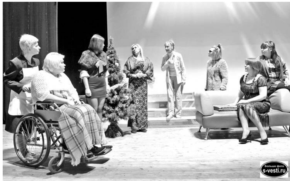
Настолько ли прекрасны эти восемь женщин, как ожидает зритель?!

- Довольно большая часть современных красивых девушек ищут себе богатых спутников, принцев, - рас-