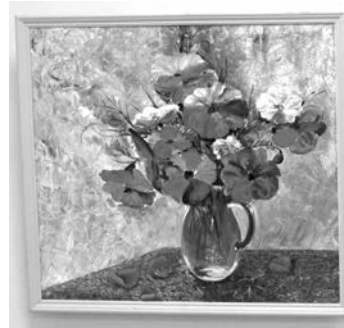
«Маки» Марины Сайковой, «4 груши и 22 ежевики» Елены Папёнок.