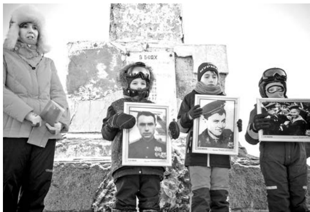
Самые маленькие участники пробега запомнят этот волнительный момент надолго.

Уже в четвертый раз жители Североморска и Мурманской области приняли участие в пробеге на снегоходах в поселок Гранитный, где в годы Великой Отечественной войны располагалась база торпедных кораблей Северного флота.