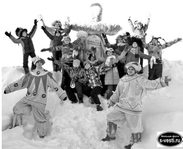
После забег на ходулях, катания на лопатах и перетягивания каната сафоновцы Масленицу тоже сожгли.