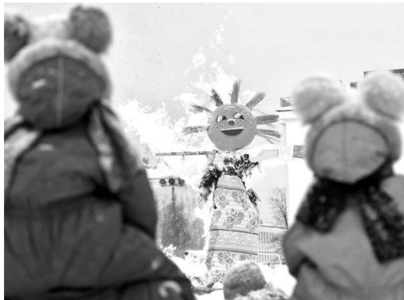
Чучело Масленицы жгли на городском стадионе – площадке, наиболее подходящей для этого по нормам безопасности.