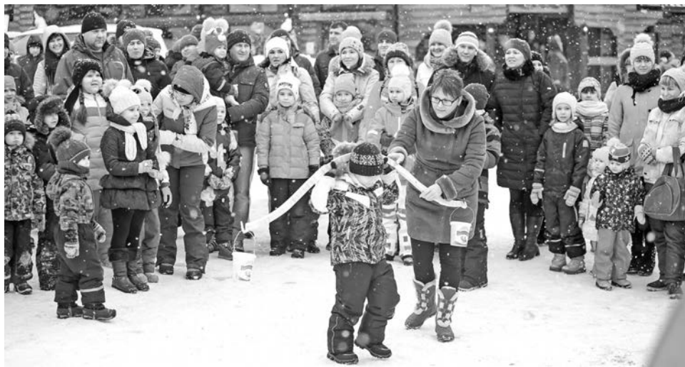
На Масленицу в загородный парк людей пришло не меньше, чем на городской праздник.