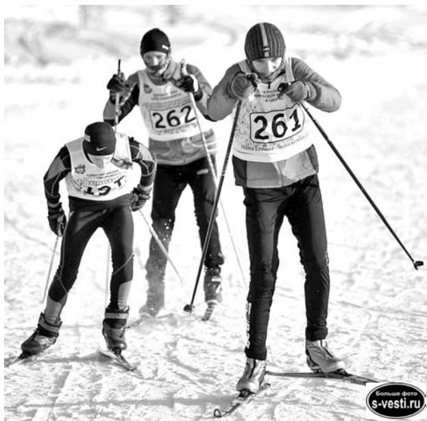
Лыжный забег - это отличная возможность улучшить свои предыдущие показатели, сразиться за победу и просто насладиться зимней прогулкой.