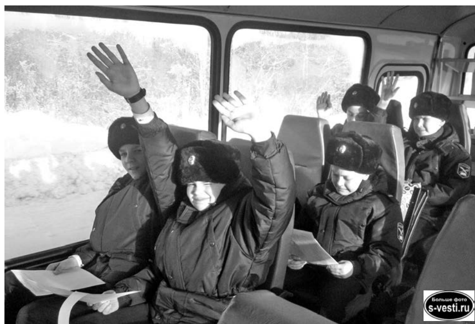
Дружные песни, веселые разговоры и повторение изученного... Время в дороге пролетело незаметно.

Тема турнира - «Героические сражения в годы Великой Отечественной войны 1941-1945 годов». Наша команда показала отличные навыки в конкурсе строевой подготовки «Хорош в строю - силен в бою», выполнив элементы