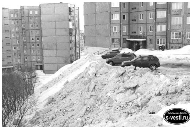
Так, по мнению УК СЖКХ, выглядят 2 ковша снега, не вывезенные по объективным причинам.

Пользуясь случаем, Евгений Фесенко обратил внимание проверяющих на плохую уборку придомовой территории и детской площадки, особенно подчеркнув безобразное состояние контейнерной площадки, которой наряду с жильца-