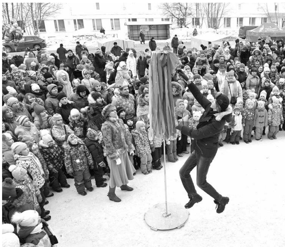
Добрым молодцам пришлось потрудиться, чтобы выполнить все Петрушкины задания (площадь перед Центром досуга молодежи).