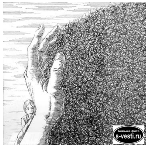
«Прячась от беды».