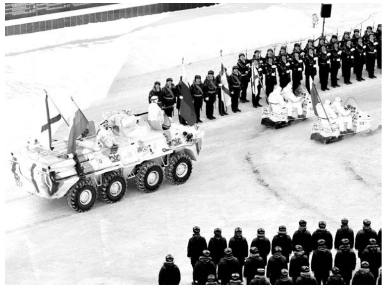
Огонь Всемирных военных игр на площадь доставили по-военному - на броне.