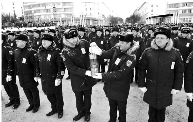
Во время эстафеты северный огонь стал еще горячее, ведь каждый поделился с ним своим теплом.