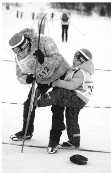
Подготовленный спортивный инвентарь - залог успеха.