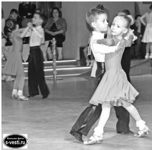
Ребята старались показать свое мастерство членам жюри и гостям «Северного бриза».