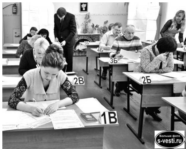
13 мужественных взрослых приняли участие в акции «Единый день сдачи ЕГЭ родителями».

Наталия СТОЛЯРОВА.