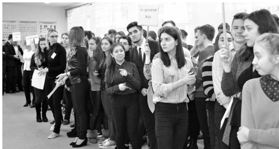
Несмотря на то, что экзамен был репетиционным, волнение учеников было как на реальном ЕГЭ.