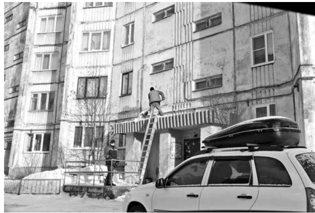
В уборке нуждаются не только дворы, но и кровли, козырьки крылец.

Закончился рейд посещением конечной остановки автобуса №6 на ул. Полярной. Вопрос, который уже неоднократно поднимался с момента обильных снегопадов, ка-