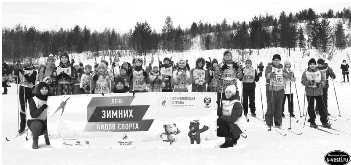
С каждым годом «Лыжня России» становится все более массовой.

- Мне 60 лет, и я хожу почти на все подобные старты. Тут ощущается общность. Здорово, когда людей объединяет жела-