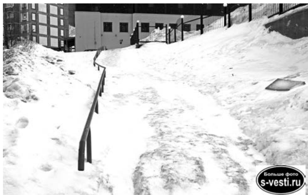
Лестница от автостоянки на ул. Комсомольской давно забыта «ССС».

График уборки территорий от снега смотрите на s-vesti.ru.