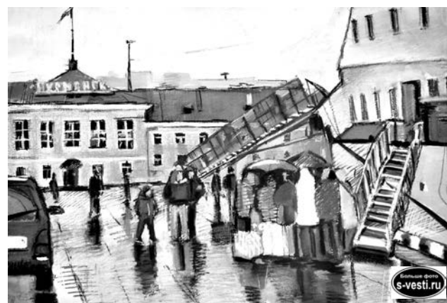
Из серии «На причале».