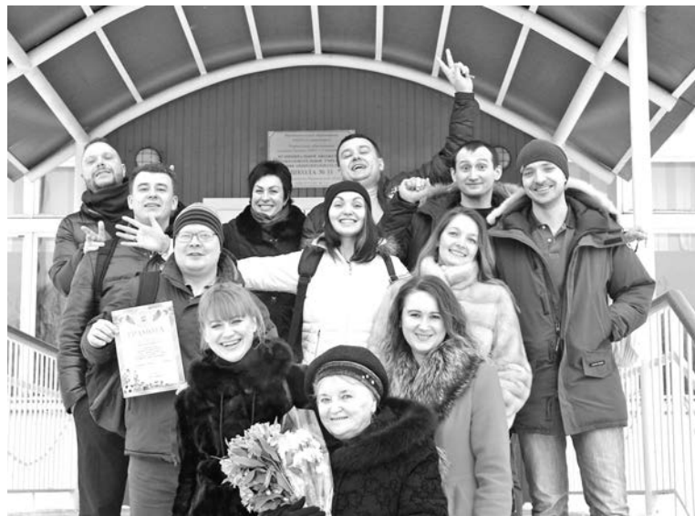
Выпуск 2002 СШ №11 и любимые педагоги на пороге родной альма-матер.

Во время долгих разговоров выпускники порадовались успе-