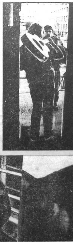
к материалам «Будет детский сад» (25.03.1988г.) и «Наши дети - наша боль» (28.10.1989г.).