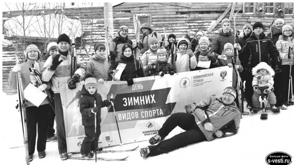
Победители и участники городского проекта, для которых прогулки на лыжах по загородному парку в удовольствие.