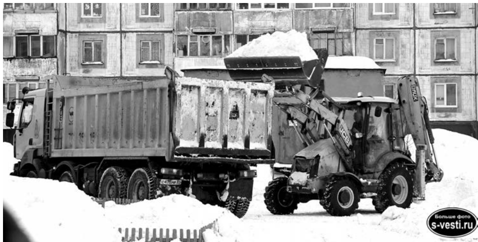
Жители п.Сафоново-1 дождалась вывоза снега.