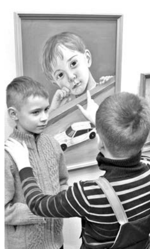
В поисках сходства.