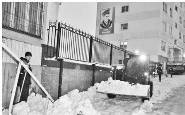
Жители ул.Саши Ковалева наконец дождались уборки дворов.