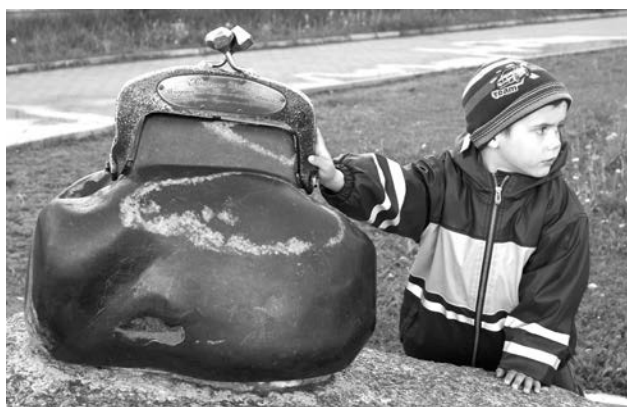
Потер на удачу.

Поезд прибыл строго по расписанию, и мы радостно потопали с чемоданом