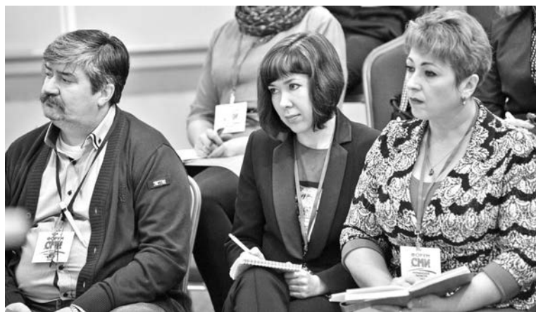
Приехать на форум региональным СМИ не помешал даже снежный коллапс.

Светлана КОТОВА, Ольга ВОРОБЬЕВА.