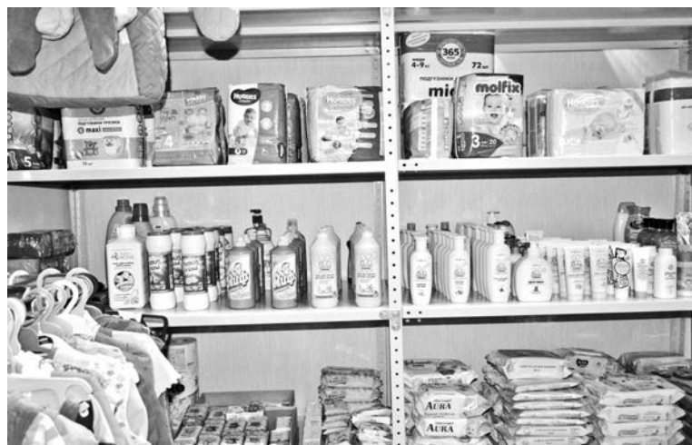
Этот стеллаж собран на средства северноморцев, откликнувшихся на акцию «Щедрый вторник».