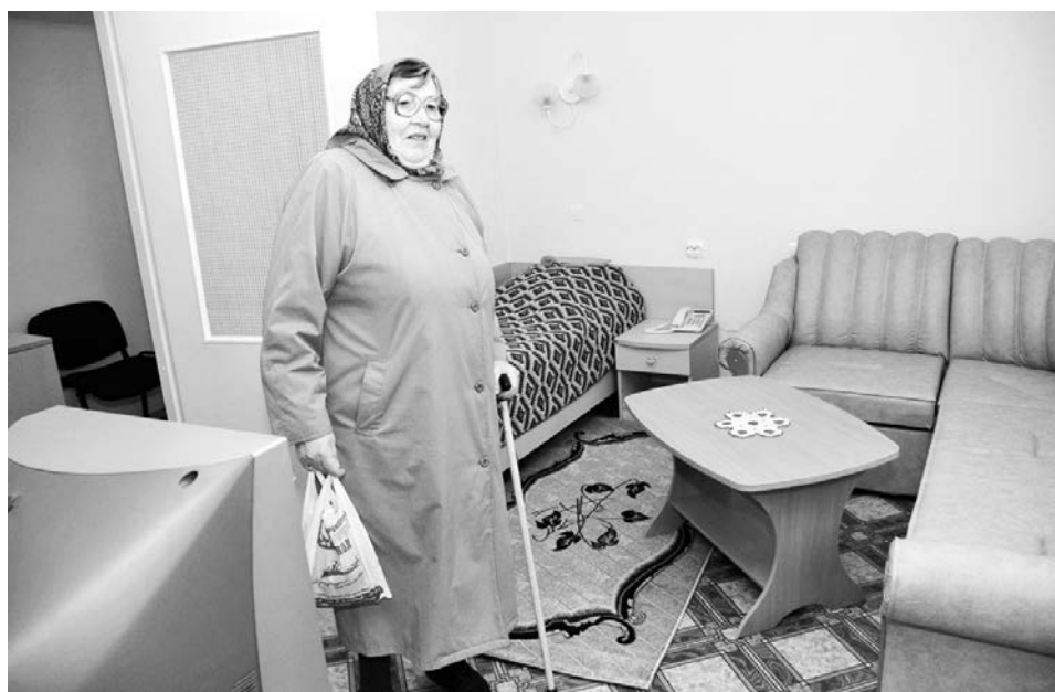
Когда в 2007 году открылся североморский дом престарелых, он привлек пенсионеров возможностью проживать в уютных квартирах, а не в палатах.