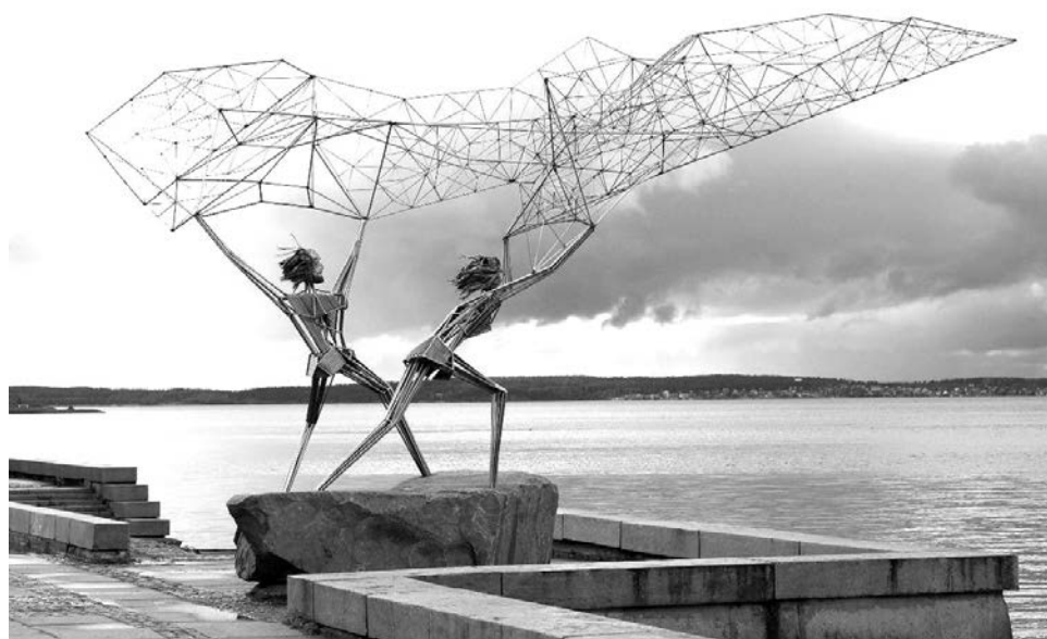
Набережная Онежского озера, город Петрозаводск.