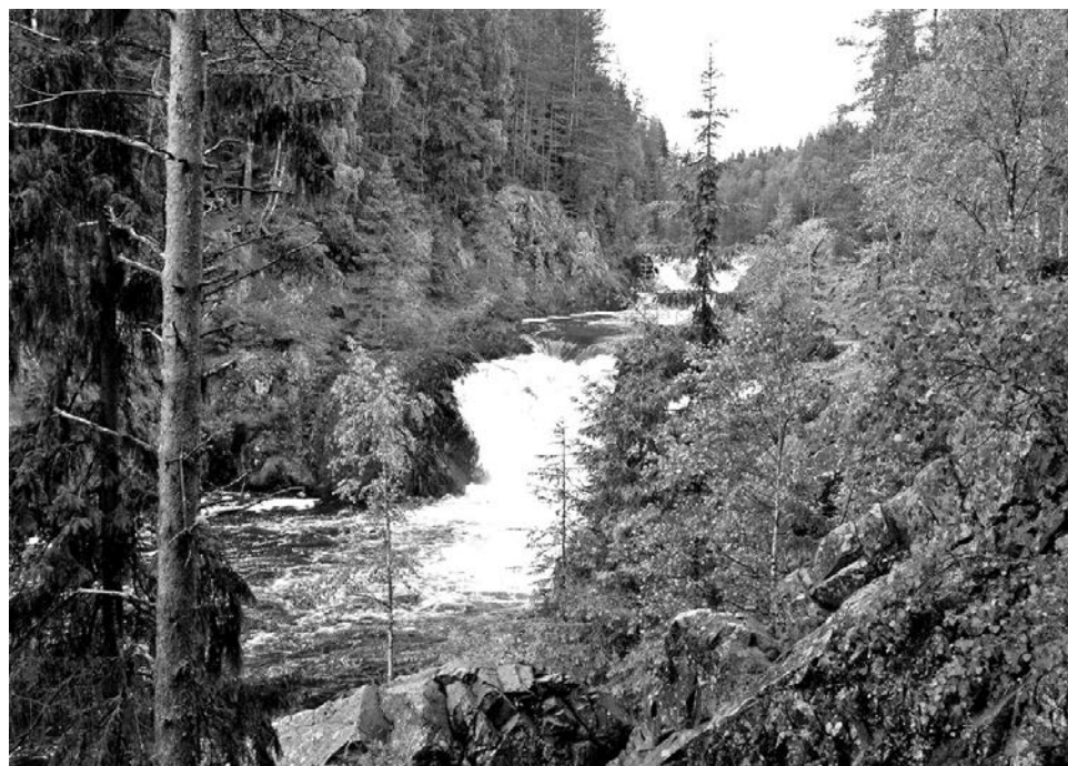
Водопад Кивач, воспетый Гавриилом Романовичем Державиным.