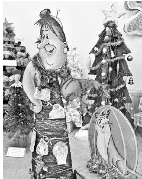
«Фрекен Бок в новогоднем хороводе», д/с №50, группа «Одуванчики».

Жюри выберет победителей в заявленных номинациях и определит обладателя Гран-при за самую лучшую ёлку. Посетители тоже могут поучаствовать, до 12 января 2017 года проголосовав за понравившуюся работу. Новогодний символ, набравший наибольшее количество голосов, получит приз