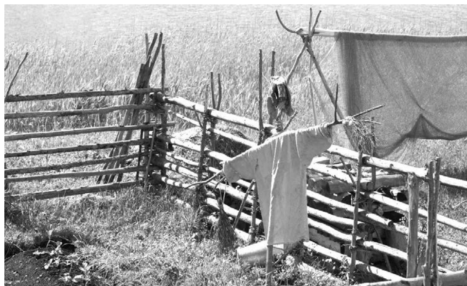
Даже огородное чучело сохраняет местный колорит.