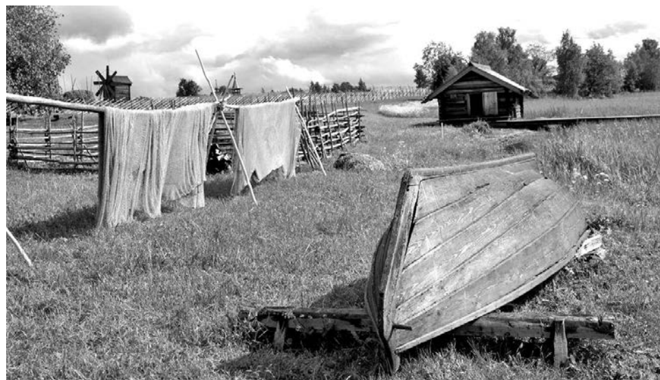
На острове Кижы обязательный атрибут каждого двора - лодка.