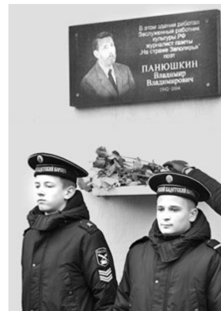
Вахта Памяти у дома №9 на ул. Сгибнева.