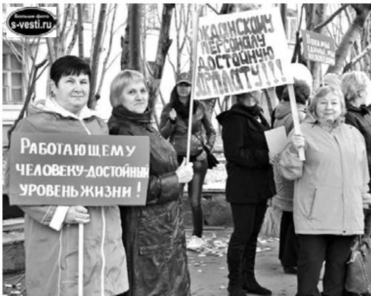
Активности и количеству членов Профсоюза гражданского персонала ВС России позавидует любая организация.

Есть и другие проблемы. Не секрет, что тех, кто активно борется за свои права, работодатель пытается уволить, лоя на мелочах: не там покурить, не вовремя отменился на проходной. В помощь работникам издаем сегодня юридическую литературу о том, как отстаивать свои права при ситуации, когда вас зас-