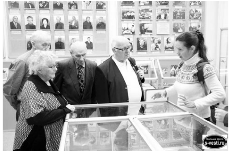
Наиболее впечатлила гостей из Норвегии самая большая копия Знамени Победы.