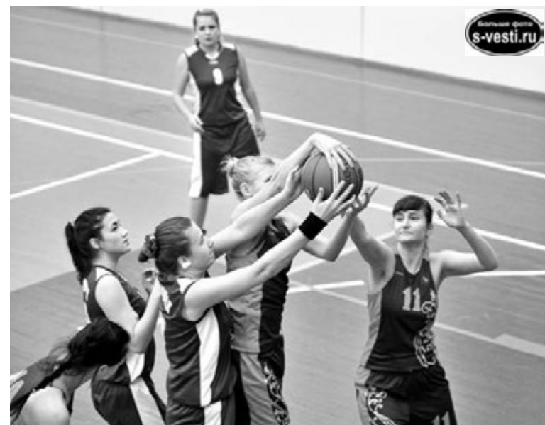
Первая игра не порадовала результатом, но в самоотдаче и воле к победе наши девушки соперницам не уступили.