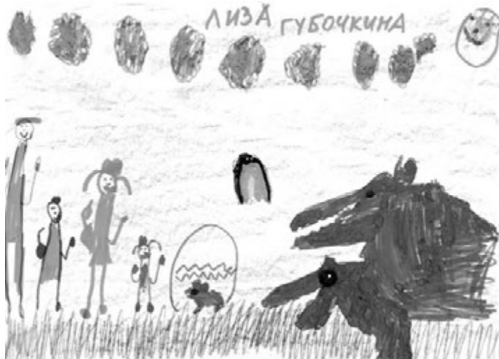
«В парке динозавров», Губочкина Лиза (5 лет).