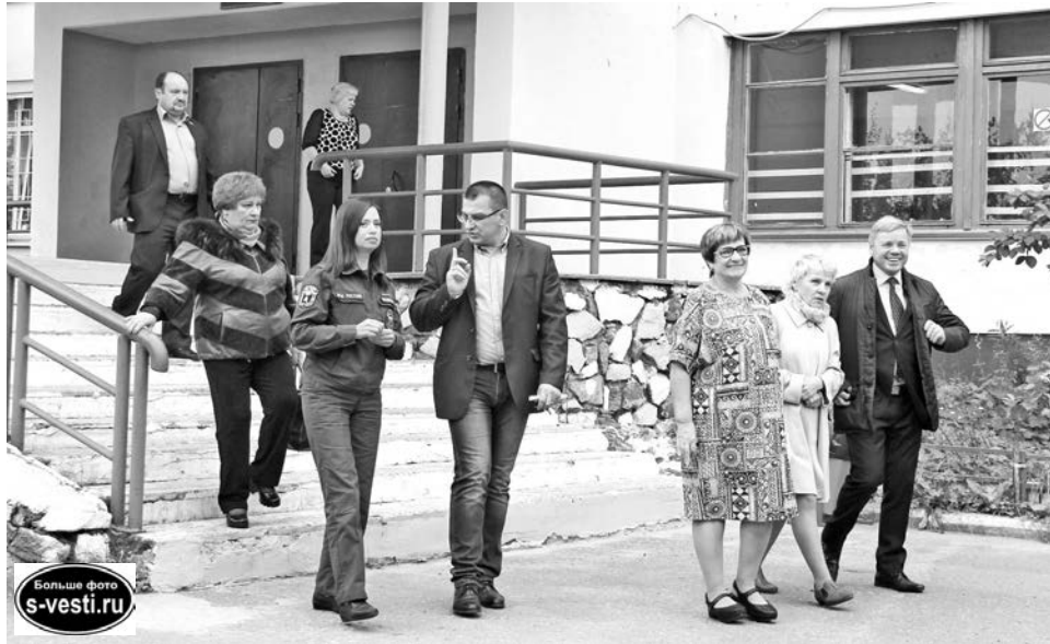
В целом результатом проверки готовности к новому учебному году СШ №7 комиссия осталась довольна.