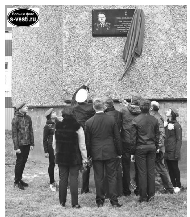
Честь открыть доску была предоставлена ребятам из отряда МЧС «Спасатели» СШ №11, но веревка так прочно обхватила доску, что пришлось потрудиться большой командой.