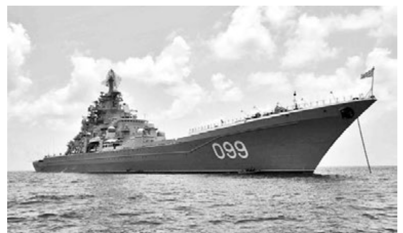
ТАРКР «Петр Великий».