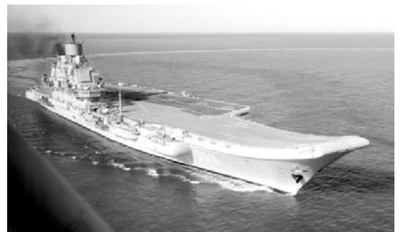
ТАВКР «Адмирал Флота Советского Союза Кузнецов».

Пресс-центр администрации.