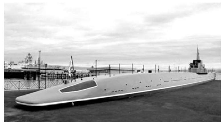
Музей «Подводная лодка «К-21».