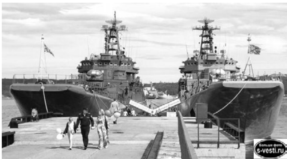
Через 588 суток похода БДК «Александр Отраковский» вернулся в Североморск. Долгожданная встреча на родном причале.