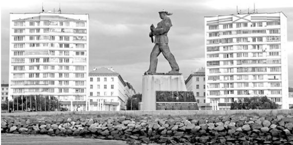
Памятник героям-североморцам защитникам Заполярья («Алеша»).