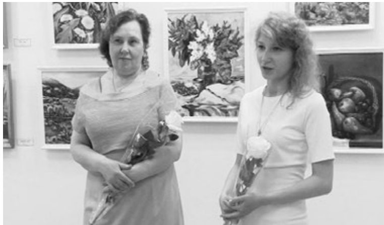
Художницам было интересно узнать мнение первых посетителей выставки о своих работах.