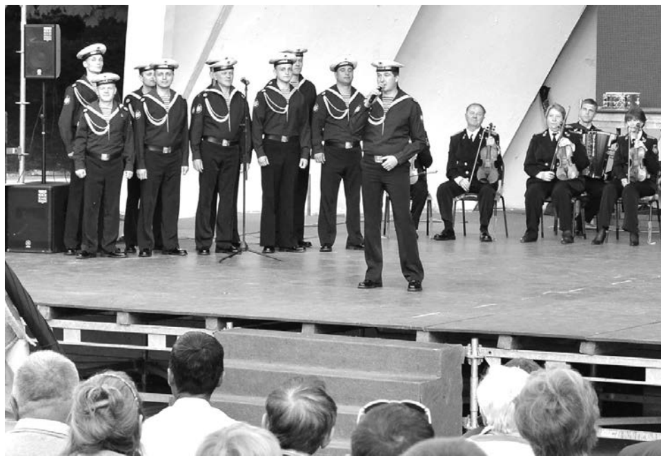
Помимо конкурсных выступлений Ансамбль песни и пляски Северного флота еще дал концерт в парке им.Горького для жителей и гостей Ростова-на-Дону.

На музыкальный парад съехались 18 ансамблей от разных видов и родов войск Вооруженных сил РФ, военных округов и флотов, выступили более 700 артистов из Москвы, Санкт-Петербурга, Калининграда, Екатеринбурга, Самары, Читы, Хабаровска, Североморска, Севастополя и Ростова-на-Дону.