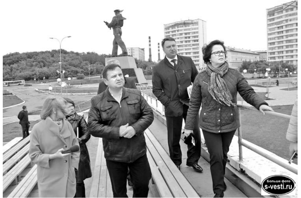
Участники рейда проверили готовность трибун на Приморской площади к празднованию Дня ВМФ.

вить об этом в известность и нас, администрацию, и органы Госавтоинспекции. Будем на это реагировать.