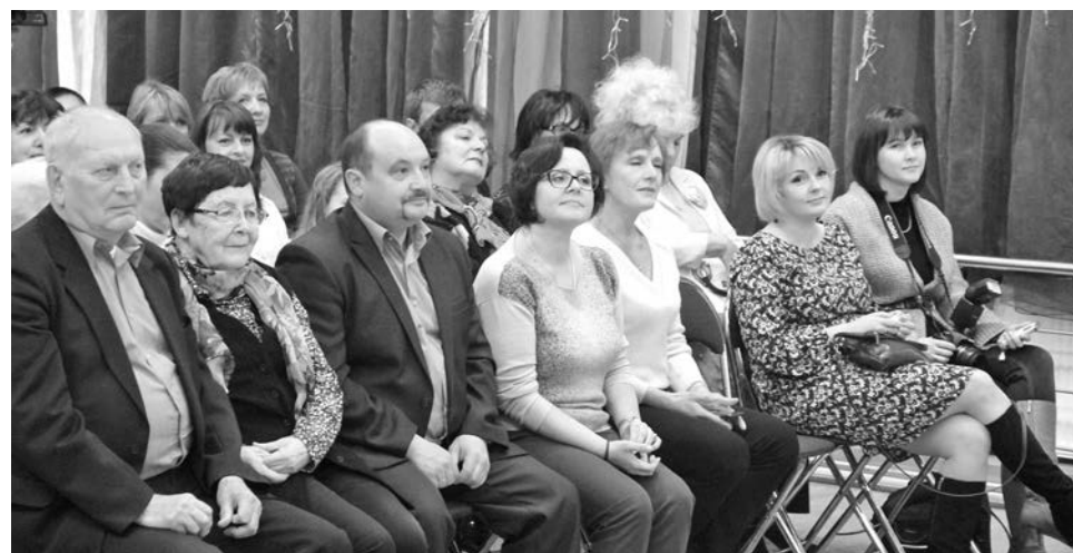
Интерес к новому проекту «КиноВаенга» оказался таким, что в зале на открытии буквально яблоку негде было упасть.