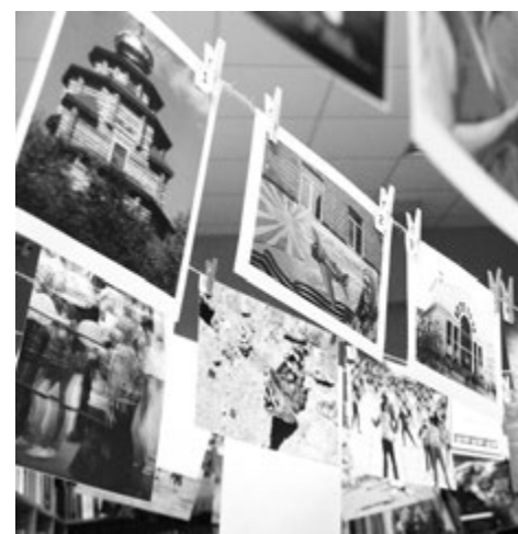
В течение ночи экспозиция пополнилась новыми фотографиями.

Завершилась «Библионочь» просмотром документальных и игровых фильмов