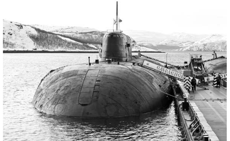
Сейчас «Смоленск» готовится выйти в Баренцево море для выполнения учебно-боевых задач.

- Загерметизирована переборочная дверь в пятый отсек! Создан рубеж обороны на носовой переборке! Обесточены распределительные щиты номер... Произведен замер газового состава воздуха в... отсеке!