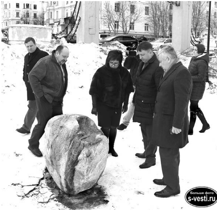
Этот камень послужит одним из главных элементов будущего памятного знака.