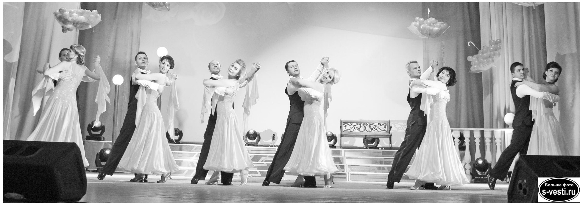
Финальный аккорд шоу «Несколько мгновений из жизни женщины...» - волшебный вальс в исполнении всех участниц.