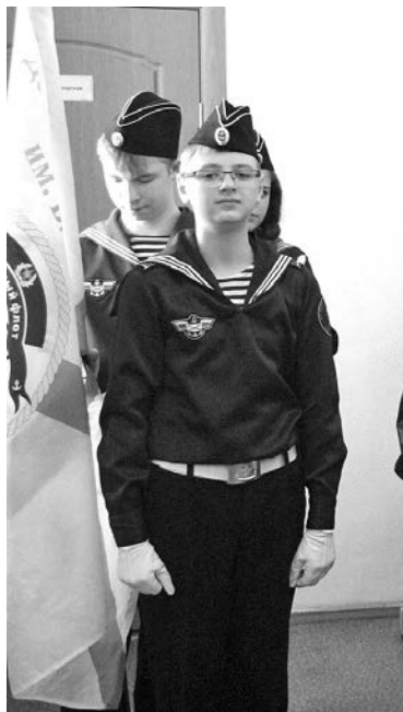
Поздравить юбиляров явился сам Петр I со свитой, роль которых исполнили воспитанники ДМЦ.

Четвертьвековой юбилей отметил в прошедшее воскресенье североморский Детский морской центр имени Валентина Пикуля.