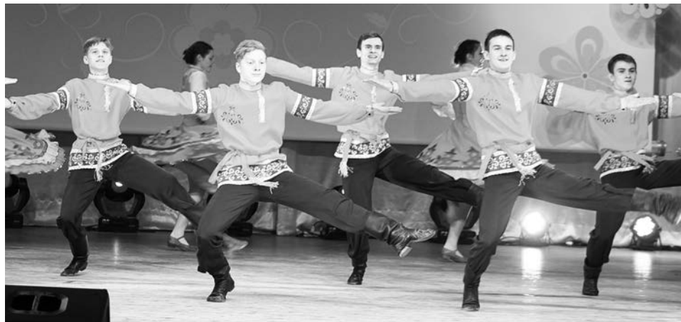
Юношей в ансамбле всегда было немного, зато каждым из них руководитель может гордиться.