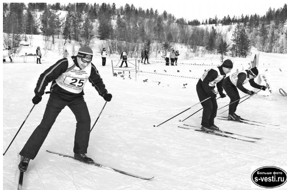
Явка на спартакиаду оставляла желать лучшего. Зато зачет по лыжам сдали все.

Наталья МОРОЗОВА.