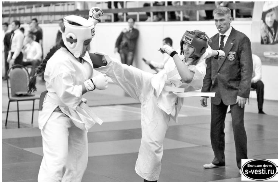
Даже накануне 8 Марта девушки по максимуму показывали, на что способны, не опасаясь «украшений» в виде синяков.

- Мне хочется получать пояса, грамоты. Интересно же! – поделилась одна из