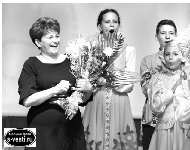
Виновице торжества ученики сделали много подарков. Но главный - удовольствие от прекрасного концерта.