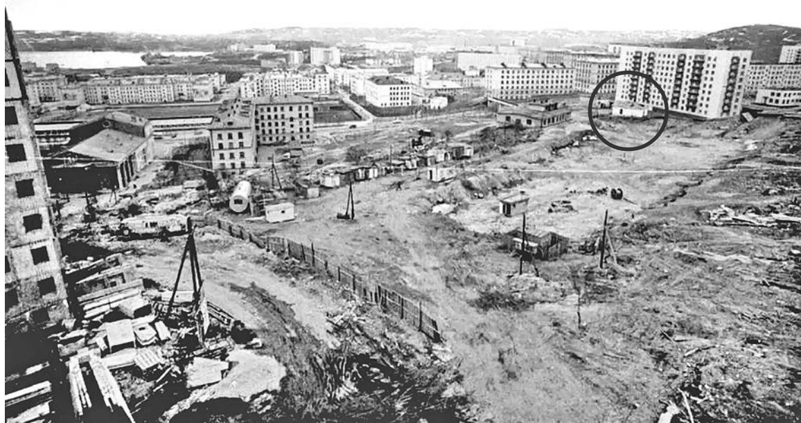
На фото отмечена та самая «Керосинка», стоящая среди строящихся детской поликлиники, общежития АКИН, д/с №11, отделения связи.

Подготовила Наталья СТОЛЯРОВА.