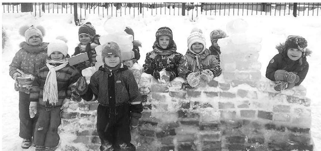
Ледяная крепость. Строили ее дети, родители и воспитатели группы «Росинка» на участке МБДОУ д/с №16. К сожалению, вмешалась непредвиденная оттепель - и крепость осталась недостроенной, так как заготовленные ледяные кирпичи растаяли.