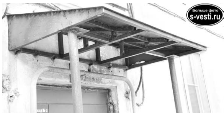
Вот такой крепкий козырек появился на Авиаторов, 5. А когда его покрасят, он станет еще и красивым.