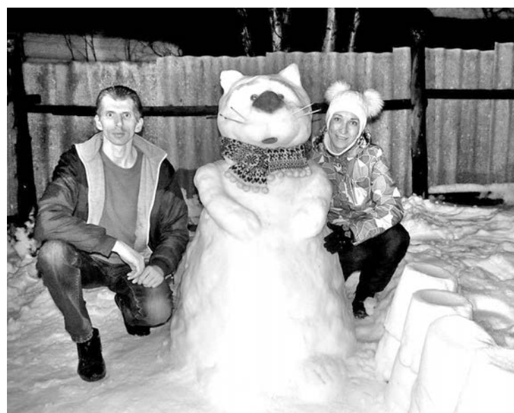
Наш дачный котик Мурзик.