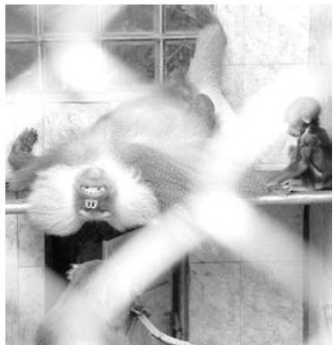
Завидев этого главу обезьяньего семейства, один из детей к ужасу родителей выдал «перл»: «Как папа по субботам».

Граница между Россией и Абхазией абсолютно прозрачна, для ее пересечения от вас требуется только паспорт гражданина РФ. И как раз по причине простоты нанимать автомобиль для трансфера (индивидуальный трансфер – 1,5 тыс. руб-