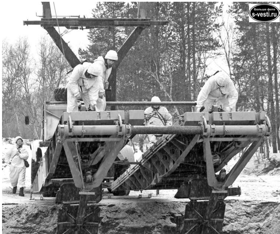
Такая переправа может выдержать вес до 60 тонн, главное – правильно установить конструкцию.

Последняя преграда – противотанковый ров – один из сложнейших этапов, и именно на его преодоление уходит больше всего времени. Тут слаженность действий должен показать расчет тяжелого механизированного моста. Как только колеяный мост готов, бойцам остается только переправиться по