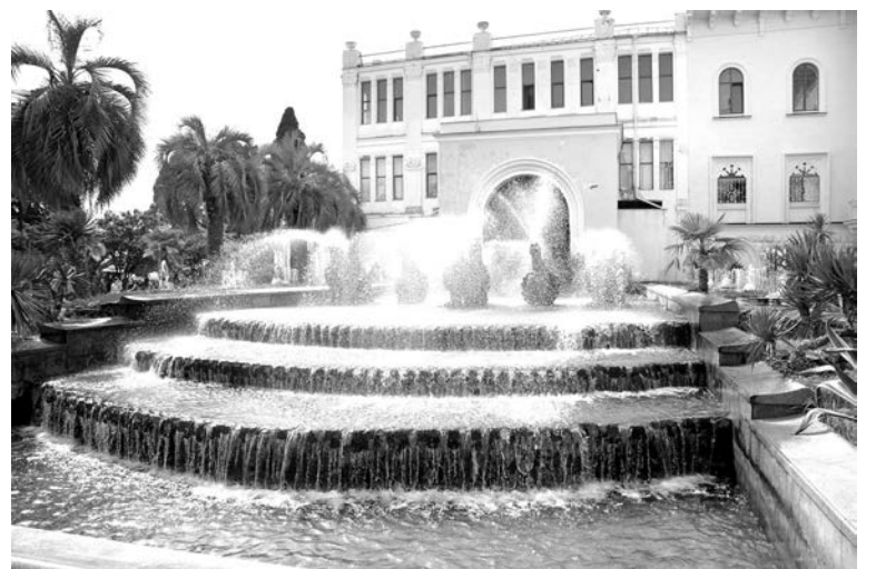
В жаркий день экскурсии по Сухуму спасет прохлада от фонтана перед Абхазским государственным драматическим театром.