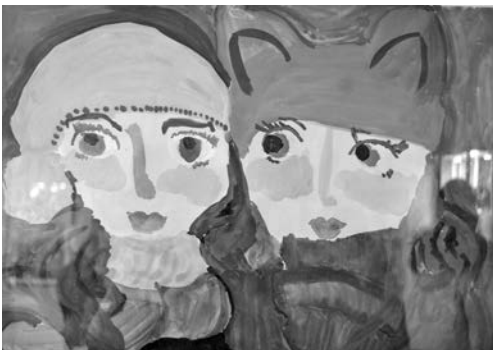
Так изобразила своих друзей Полина Небукина, 7 лет.