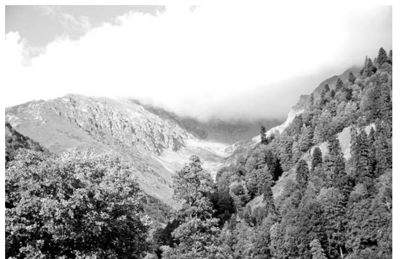
Туристам из загазованных городов в альпийских лугах будет по-настоящему вкусно дышать.