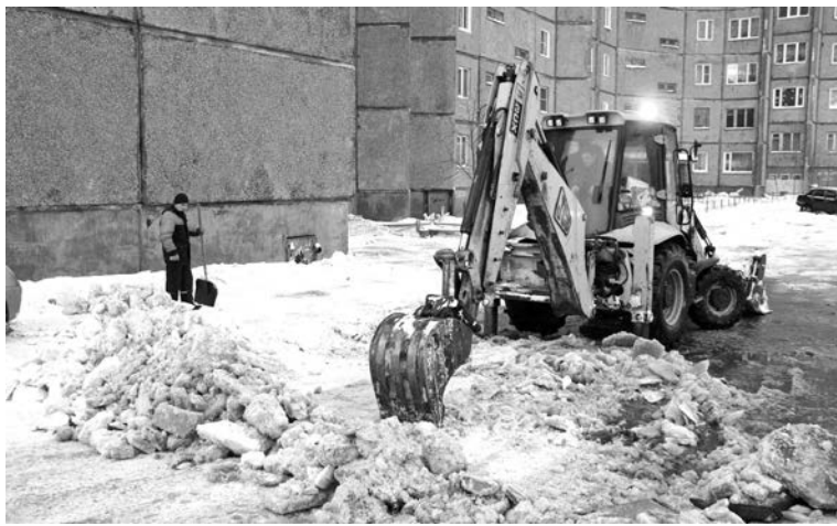
Недавняя битва со снегом и льдом на ул. Падорина.

Сергей БЕРДНИКОВ.