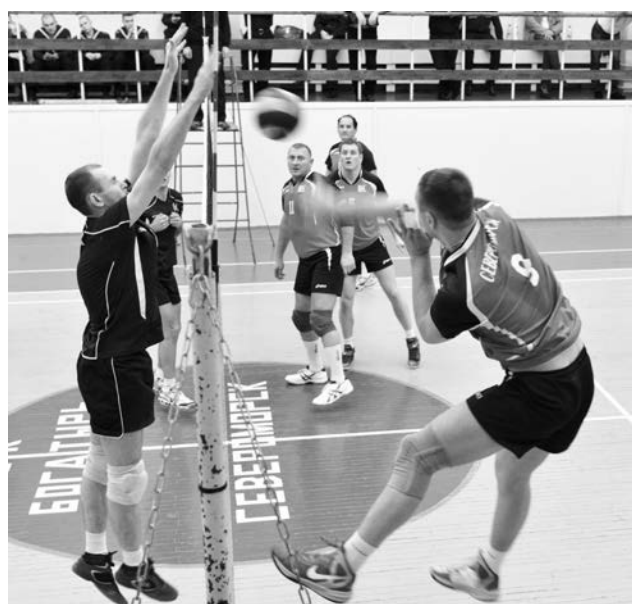
Игроки порадовали болельщиков не товарищеским матчем, а настоящей борьбой сильнейших соперников.

Первая партия осталась за «береговыми», которые включились в борьбу без раскочки, действовали напористо и точно и победили с отрывом в 10 очков. Но уже во второй