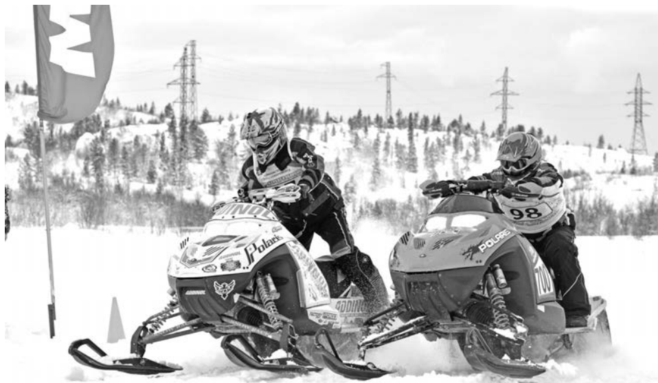
Для этих людей автомобиль - всего лишь средство передвижения, а снегоход - источник счастья.

Соревнованиями в Североморске участники остались довольны и обещали обязательно приехать на следующие. А в ближайшее время продолжением этих гонок должна