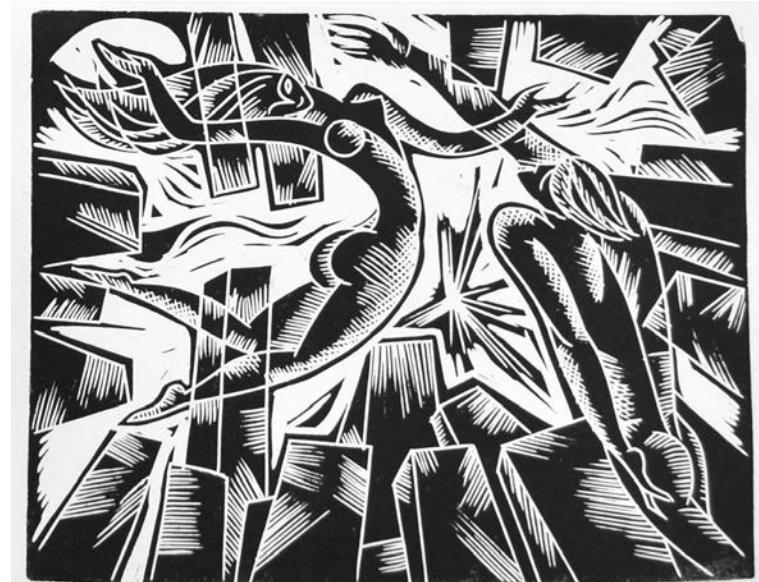
Одна из иллюстраций Анатолия Сергиенко к «Мастеру и Маргарите», 1972г.