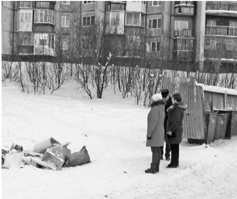
Необходимость увеличить контейнерную площадку под-казал складированный рядом крупногабаритный мусор.