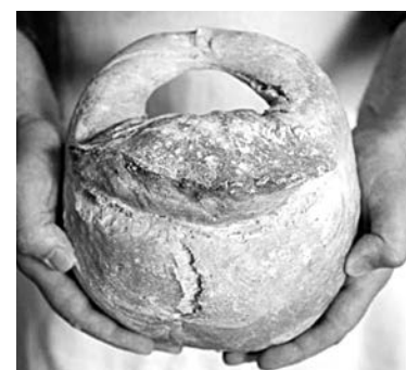
Вот такой калач с ручкой!

О чем это? Да снова о калачах! В старину на Руси их выпекали в форме замка с круглой дужкой-ручкой. И ели зачастую прямо на улице, держа за эту дужку, которую, из соображений гигиены, не употребляли. А по тех, кто не