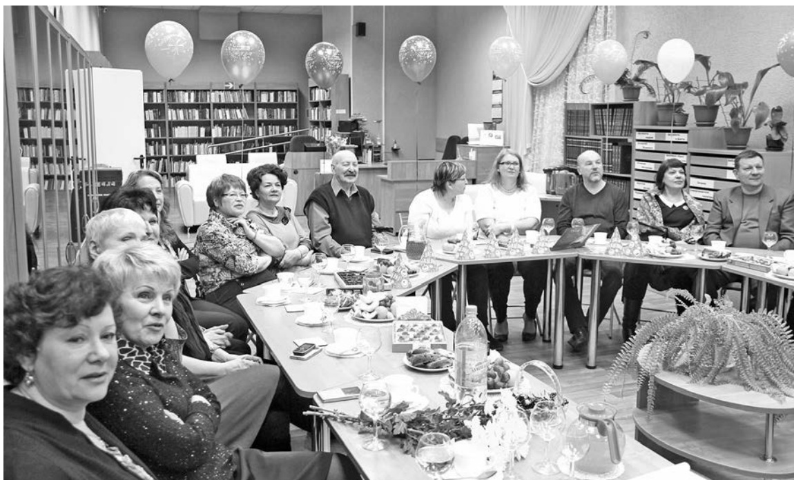
В клубе «У Татьяны» всегда царит теплая домашняя атмосфера.