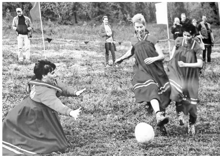
На выставке было много фотографий, дающих представление о быте, обрядах и развлечениях саамов.