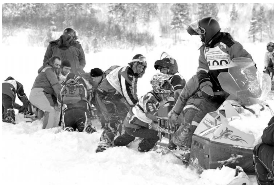
В перетягивании каната была важна не скорость, а мощность снегохода и смекалка участников.