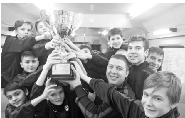
Кубок Северо-Запада едет на Кольский полуостров!

Решающий спор за «золото» турнира и возможность побороться на первенстве России развернулся между командами Мурманской области и Республики Коми. Год назад представители Кольского Заполярья в Гатчине проиграли юным футболистам из Сыктывкара со счетом 1:3 и, конечно, горели желанием взять реванш. И