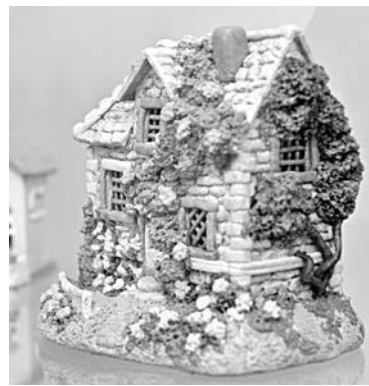
Домик из соленого теста - произведение искусства.

- Отдала этому делу уже больше шести лет, - рассказывает она о своем увлечении. - А началось с того, что однажды увидела у