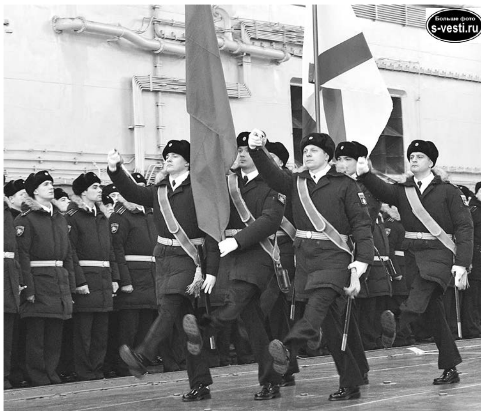
День корабля всегда начинается с построения и выноса знамени. Сегодня среди 2000 членов экипажа «Кузнецова» пятеро моряков помнят, как это было в первую годовщину корабля.

ТАВКР был заложен 1 сентября 1982 года на верфи Черноморского судостроительного завода в городе Николаеве, спущен на воду 4 декабря 1985 года. 20 января 1991 года на крейсере впервые был поднят военно-морской флаг. А за год до этого события корабль получил имя прославленного советского адмирала и наркома ВМФ Николая Герасимовича Кузнецова (после того, как его именовали и «Рига», и «Леонид Брежнев», и «Тбилиси»). На Северный флот он прибыл в декабре 1991 года – неспокойное и трудное для