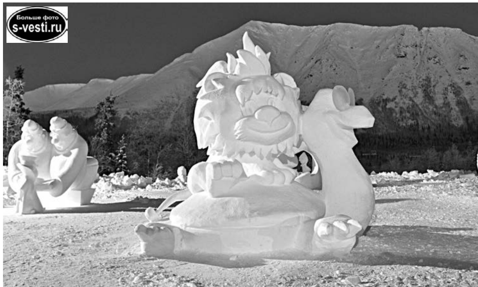
Невозможное возможно: герои такого летнего, солнечного мультлика сделаны из снега.