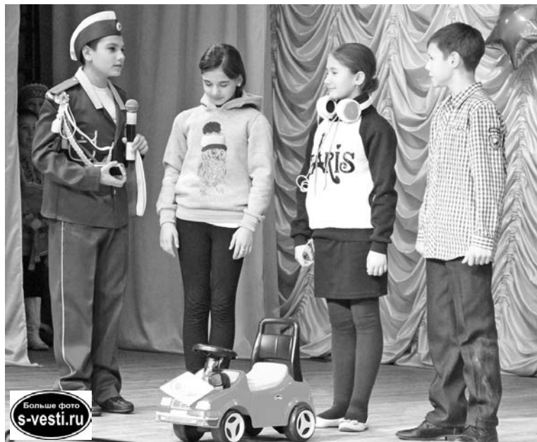
Команда гимназии №1 не вошла в тройку призеров, но правила ПДД ребята знают назубок.

Итоги муниципального этапа Всероссийских соревнований юных инспекторов движения «Безопасное колесо-2015» были подведены в Доме детского творчества 23 января. Победу праздновала команда школы №1.