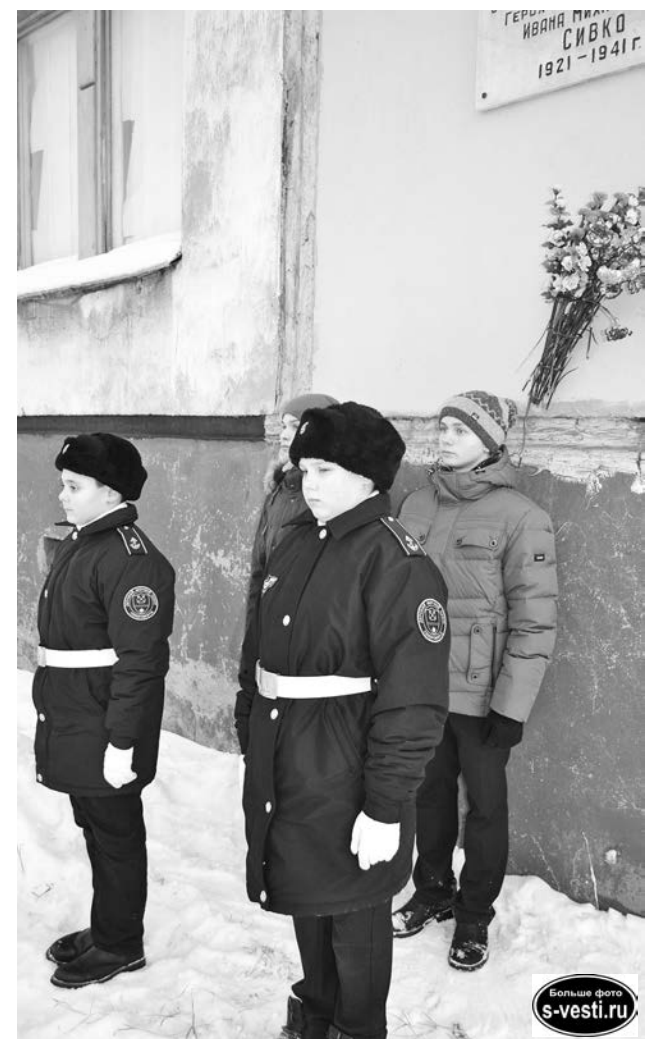
В почетном карауле ученики СШ №1 и курсанты ДМЦ им. В. Пикуля.