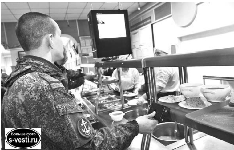
Пункт приема и распределения молодого пополнения одним из первых перешел на новую систему контроля питания военнослужащих.