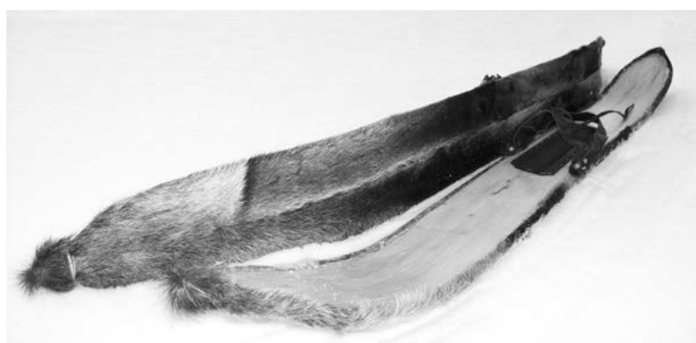
Камусные (подбитые мехом) охотничьи лыжи.

Постепенно лыжи полностью превратились в спортивный инвентарь и приняли знакомый вид. Увлечение ими распространилось по всей Центральной Европе. В Австрии и Швейцарии лыжами пользовались сперва для подъёма в горы, но вскоре обнаружили, что спуск доставляет куда больше удовольствия. Так начался горнолыжный спорт.