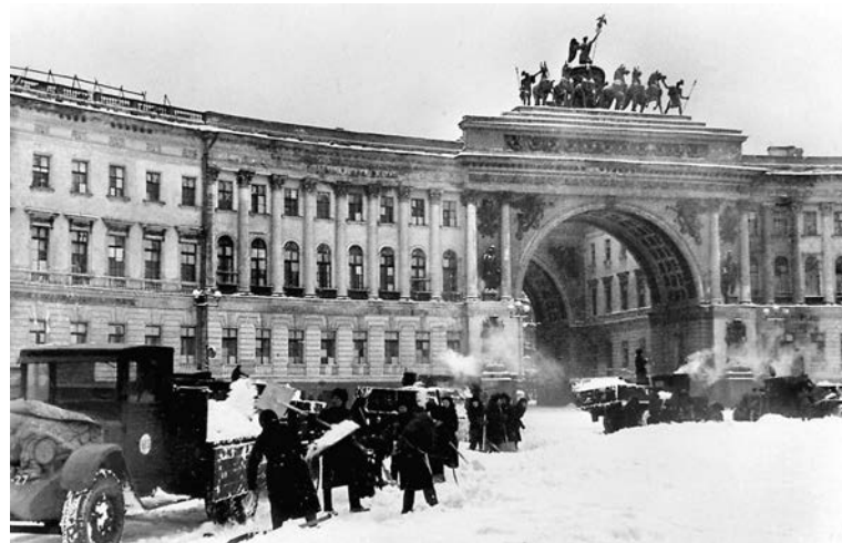
Ленинград, блокадная зима.