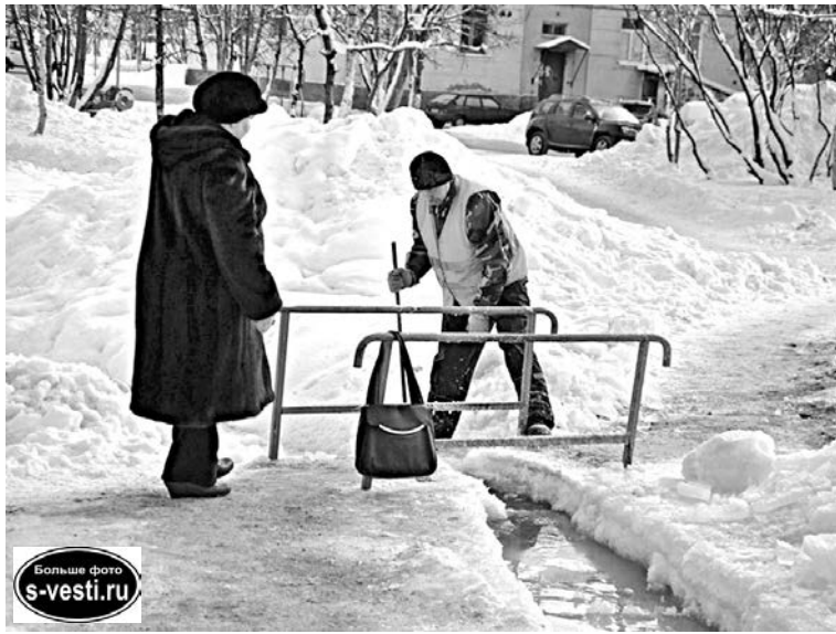
Ливневку чистят от льда уже в который раз.