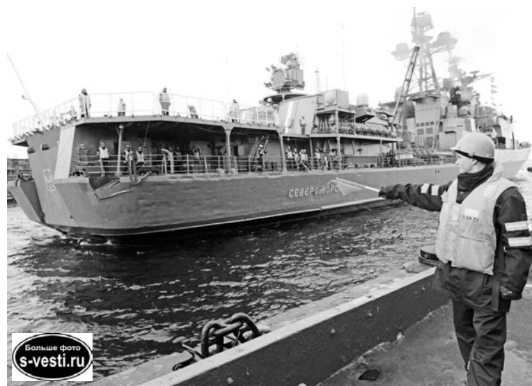
Очередной дальний поход завершается. На берегу экипаж с нетерпением ждут родные и, конечно, шефы.

Важнейшим направлением сотрудничества стала организа-