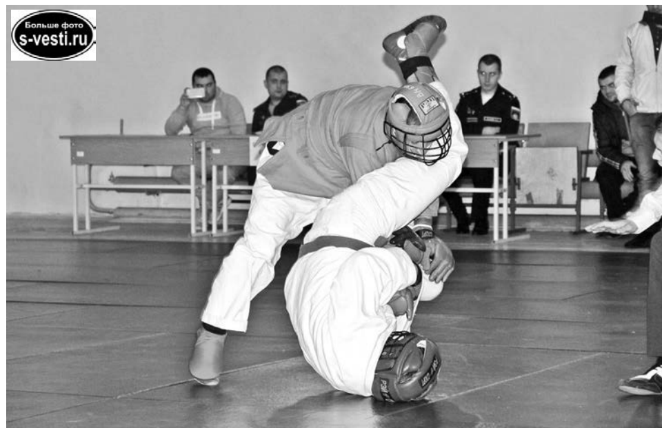
Мастерство и натиск - вот слагаемые победы единоборца.