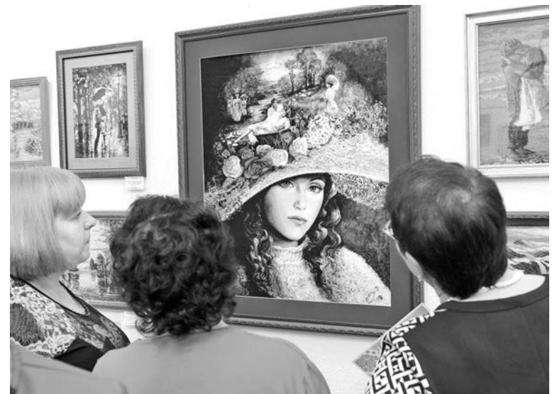
Таланты и увлечения наших земляков многочисленны и удивительно многогранны.

Отдел прикладного творчества тесно сотрудничает с библиотеками города, дошкольными и образовательными учреждениями. Народные мастера с удо-