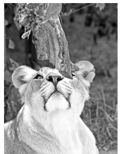
В парке можно поужинать в окружении львов, а можно и самому покормить их свежим мясом.

Только все это директор обещал летом, а теперь у него совсем другое настроение. Как же