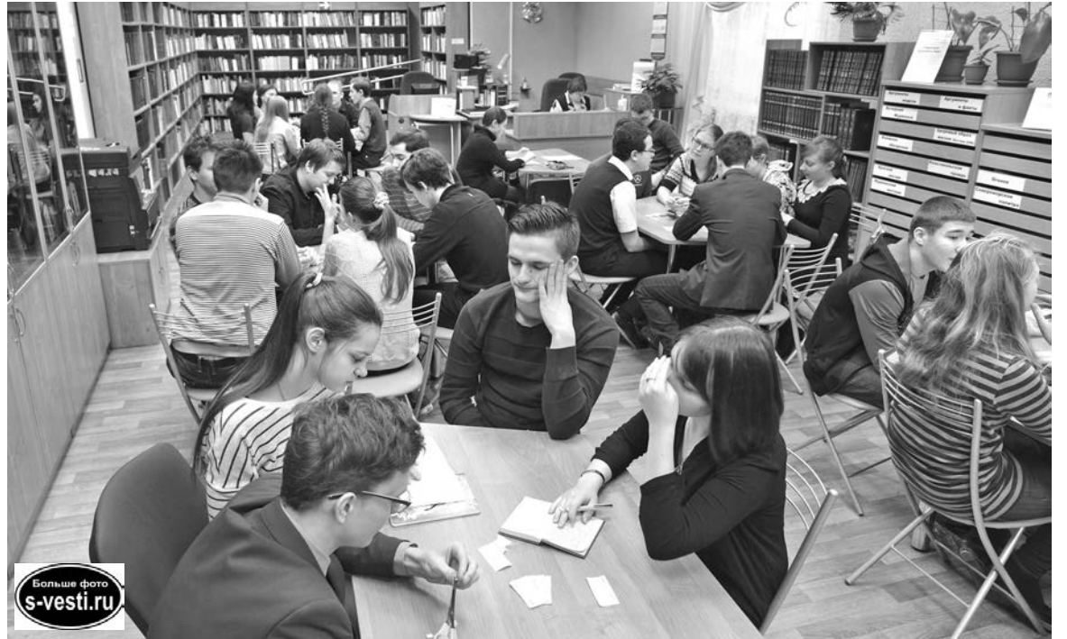
Знатоки не дают уму отдыхать: с понедельника по субботу у них уроки, в воскресенье - интеллектуальный турнир.

Не побоялись участвовать в турнире наравне со старшеклассниками ученики 7-8 классов – команда «МКТ». Важно, что