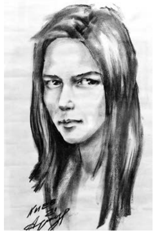
Артур Ли, «Портрет Инны» (бумага, уголь).

- Эта выставка – превосходный подарок для се-