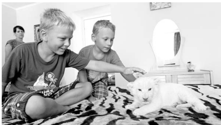
«Львенок в номер» - это полчаса безграничного счастья для ребенка и исполнение детской мечты многих родителей.

Кстати, если затронуть тему развития туристической индустрии полуострова, то сделать это помогут именно такие проекты - никаких бюджетных дотаций, но каждый сезон оказывается рентабельным. Все-таки выходы в компании львов, в отличие от пляжей-пейзажей, мы точно еще не избалованы.