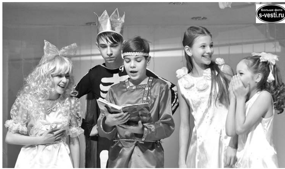
Этот спектакль не только развлекает, но и многому учит, поэтому артисты были рады показать его широкому зрителю в большом зале.

Впрочем, и у девочек была возможность попробовать себя в нескольких