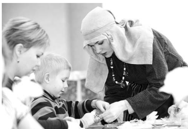
Благодаря опытным мастерам свой маленький ангел появился у каждого ребенка.

В Центре досуга молодежи 7 января царил рождественская атмосфера, хоть праздник и получился не совсем таким, как хотелось. Подвела погода.