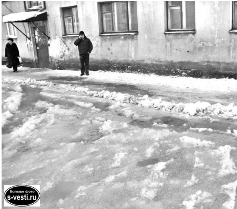
Вот в такое ледяное покрывало оделся двор дома №14 по ул. Душенова.

- У нас в городе есть объекты, на которые постоянно вытекают грунтовые воды. Это дома 14, 26 и 28 по Душенова, а также дома на нижней части улицы Сизова, - расска-