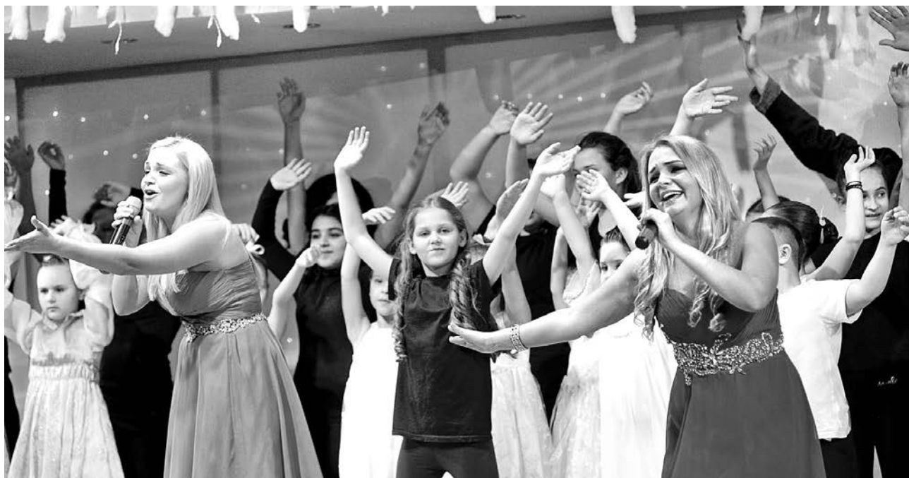
Песня сестер Галкиных в окружении восходящих звездочек ЦДМ - трогательный финал "Рождественской мистерии".