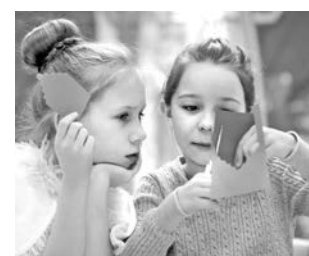
Бумажные макеты были похожими, но каждый пряничный домик получился уникальным.

Именно с «Рождественской мистерии» - представления о появлении на свет Иисуса - и начался праздник. А после всех поздравил настоятель храма святых мучениц Веры, Надежды, Любви и матери их