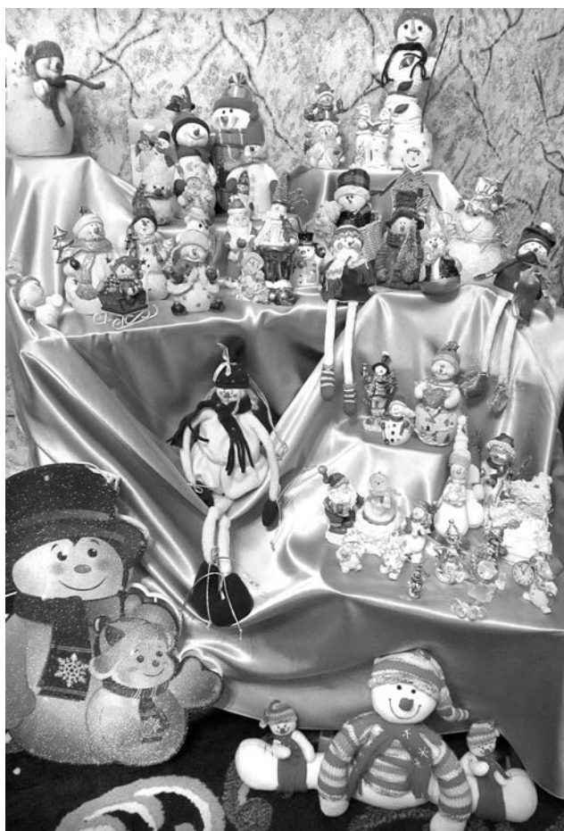
Прелесть этих снеговиков в том, что они не тают.

Ирина ФИЛИППОВА.