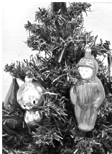
Ёлочные игрушки из коллекции СМВК.