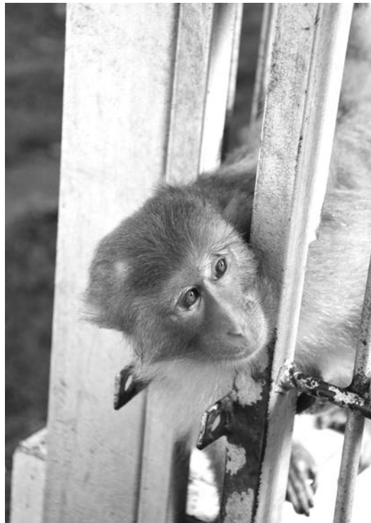
Хочу на свободу!

Сухумский обезьяний питомник. Октябрь-ноябрь 2015 года.