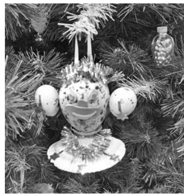
Обезьянка. Дмитрий Корнеевко.