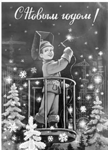
Новогодняя открытка из коллекции Н.Н.Разгоевой.