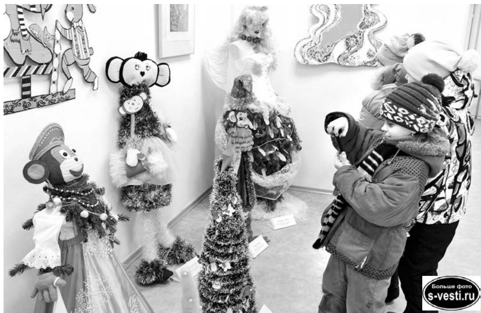
Ёлки-обезьянки стали объектом фотосессий у детворы, а внимание мужчин было приковано к ёлке-блондинке, что на заднем плане.

Но самой многочисленной стала номинация с представлением символа года. К примеру, как вам идея сделать ёлку в виде обезьяны-русской красавицы в сарафане и кокошнике? Также конкурсанты «сажали» на ветки маленьких обезьянок в виде игрушек и гирлянд, нежи-