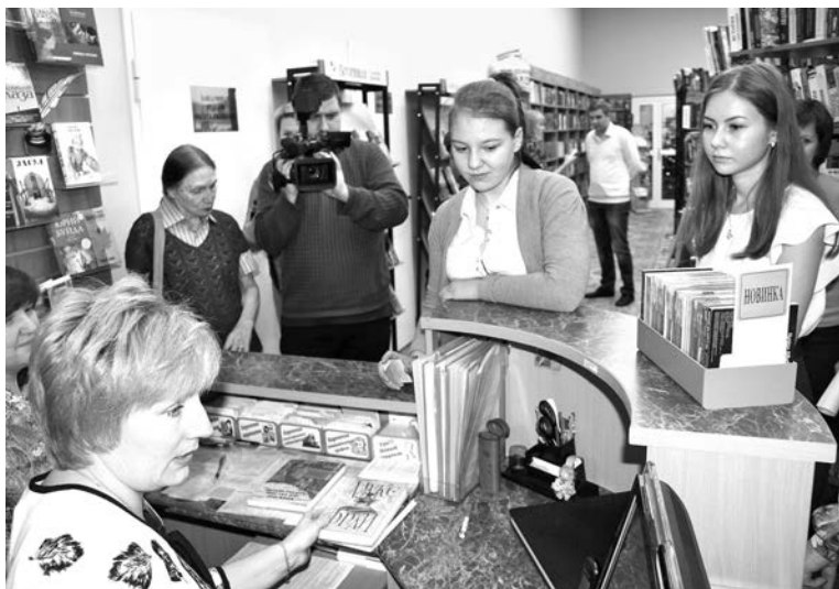
Читатели ЦГБ опробовали систему RFID в действии.

Наличие такой системы позволяет значительно облегчить работу библиотекарей: им больше не нужно тратить время на запись или списание книг – билет и специальный считыватель позволяют сократить процедуру до нескольких секунд. Удобно и читателю: информация с его электронного билета автоматически считывается при прохождении специальных ворот-портала.