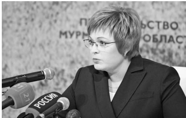
Губернатор Мурманской области Марина Ковтун отвечала на вопросы журналистов два с половиной часа кряду.

тор привела пример совхоза «Тулома». На предприятии происходит процедура внешнего наблюдения, оно получает государственную поддержку, своевременно выплачивает зарплату работникам, закупило корма, заключило все необходимые договоры, чтобы содержать 2500 голов молочного стада, 30 тысяч кур-несушек. Впереди реструктуризация банковского долга. Ожидается, что в 2016 году мы увидим на прилавках первые партии туломских яиц.