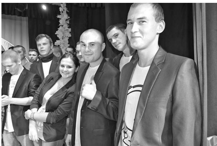
Лидеры юмора от МЧС команда «Самы-Е!».

Всего девять команд прошли через горнила трех классических конкурсов: приветствия, разминки и музыкального домашнего задания. Лейтмотивом игры стала фраза «Опять 25!», темы двух конкурсов посвятили расшифровке аббревиатуры МЧС: приветствие - «Моем, чистим, стираем»; домашнее задание - «Может, чё спасем?». - Прошлогодний дебют в КВН наших структурных подразделений удался, хотя организация поначалу шла почти в приказном порядке, - рассказал перед игрой