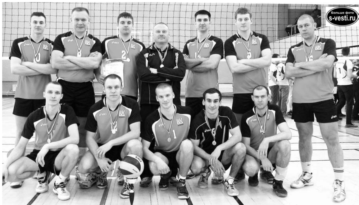
Фото из альбома сборной.