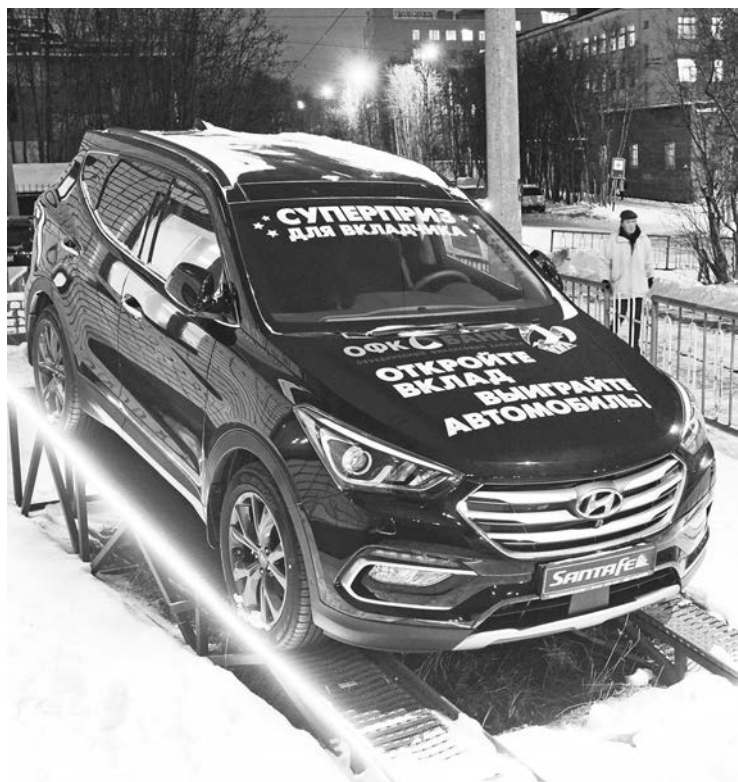
Генеральный партнер акции «100 призов» - ООО «АБМ», официальный дилер «Hyundai» в г.Мурманске (Кольский пр., 53).