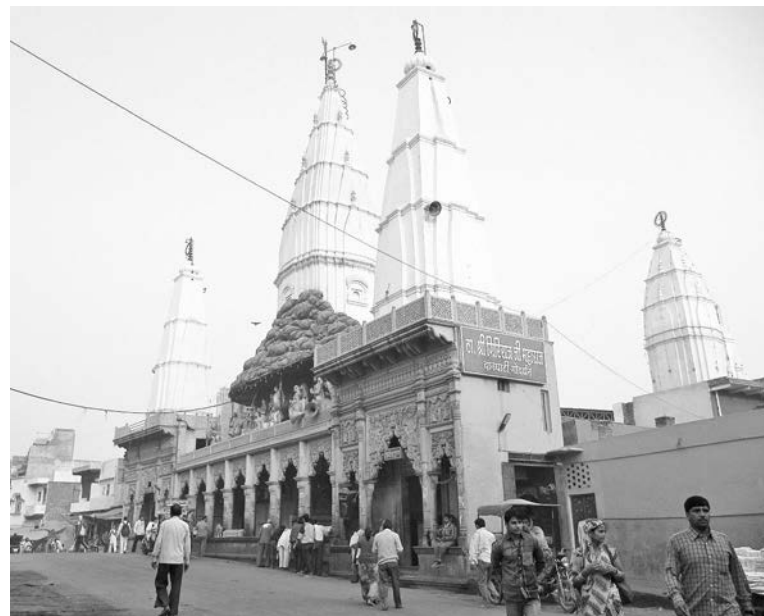
Высокие купола - отличительная особенность одного из стилей индийской храмовой архитектуры.

За окном мелькали уже ставшие привычными картины: рисовые поля, неказистые хижины, задумчивые коровы с горбом наподобие верблюжьего, женщины, несущие на головах огромные тюки... В аэропорт мы