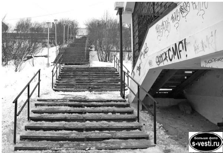
Трап восстановили, ходить стало безопасно. Теперь нужно не забывать его чистить.