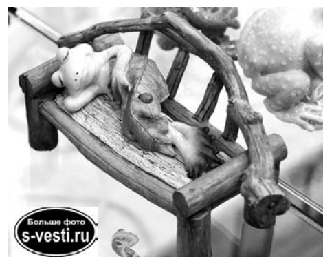
Больше фото s-vesti.ru