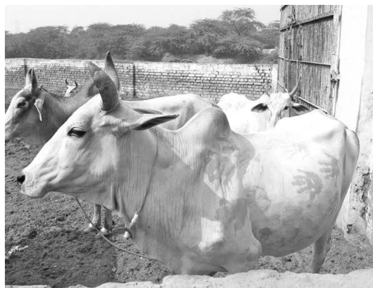
Коровы - священные животные индуизма, их окружают особой заботой.