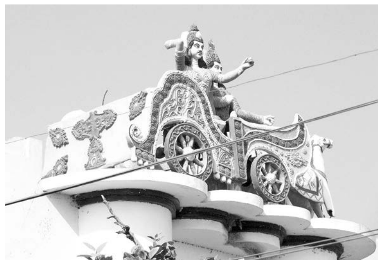
Скульптура Арджуны - героя знаменитой книги "Бхагавад-гита".