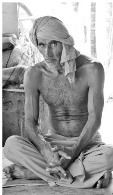
Служитель индийского храма.

Илья ВИНОГРАДОВ. Фото из альбома автора.