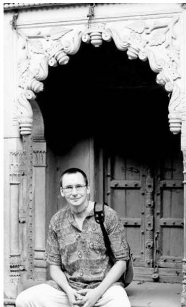
Автор на Варшане, недалеко от Дели.

Обезьяны – настоящее бедствие. Вслед за очками от них пострадало сушившееся белье, с ними «ушли» тапки. Как считается у индусов, представители этой породы в прошлых жизнях были склонными к воровству людьми. Переселение душ – одно из основных положений индуизма. После смерти душа попадает в новое тело, зависящее от наклонностей и кармы – «запаса» плохих или хороших дел, совершенных в прошлом. Кармой же определяется и то, насколько удачлив человек в этой жизни. Идея, не чуждая и другим культурам (вспомните хотя бы наше «не плюй в колодец...», «что посеешь...» и т.д.). Но в Ведах она получила глубокое философское обоснование, став частью цельного описания мира. Именно чтобы улучшить карму, многие индусы посещают храмы и святые места,