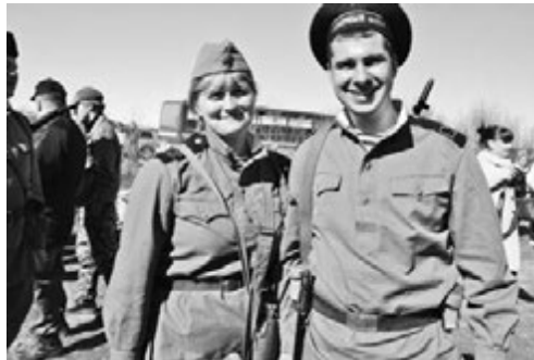
Ксения Бельчикова сделала этот снимок на реконструкции сражения в Долине Славы 9 Мая.