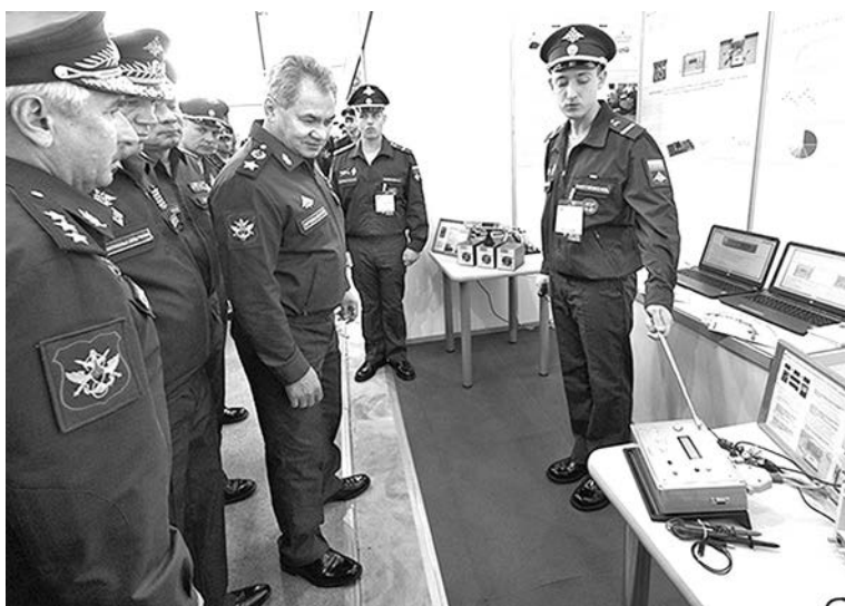
По мнению руководства военного ведомства, комплекс «Стрелец» позволит ощутимо повысить безопасность военной службы.