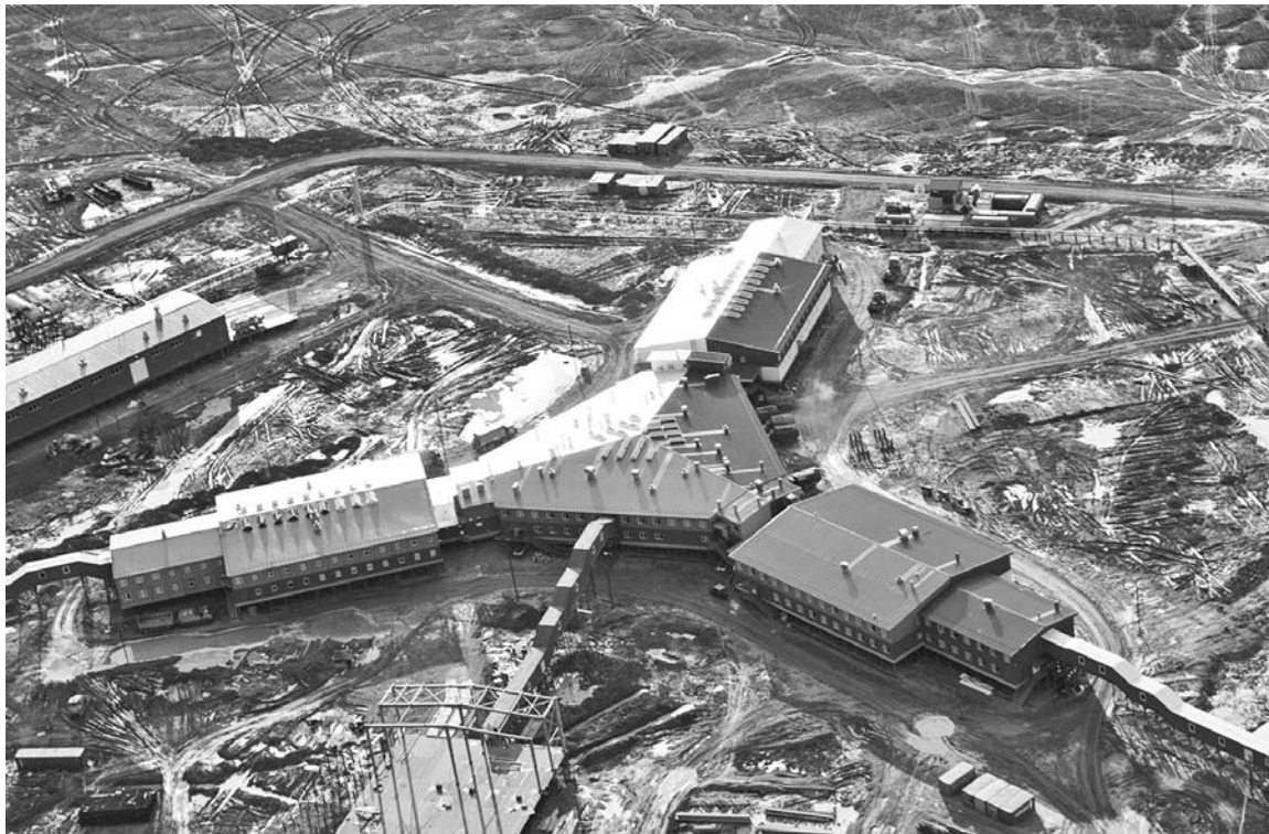
Строительство на Котельном напоминает кадры из фантастических фильмов об освоении далеких планет.