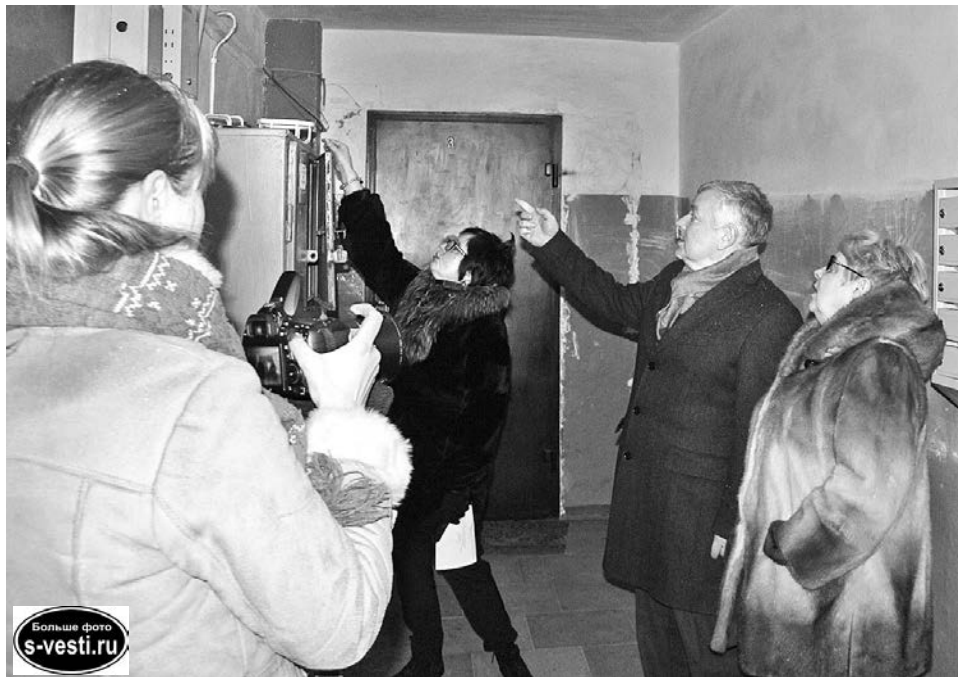
Участники рейда проверяют состояние подъезда на ул.Кирова, 15.