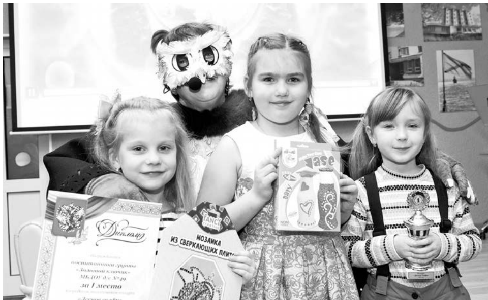
Победители конкурса из группы «Золотой ключик» д/с №49.

Почти полгода было у жителей Североморска и поселков, чтобы выбраться на природу, найти интересный ракурс, сфотографировать себя и предоставить это фото на конкурс «Лесное селфи», объявленный Центральной городской библиотекой еще в мае. А в минувшую субботу стали известны его итоги.