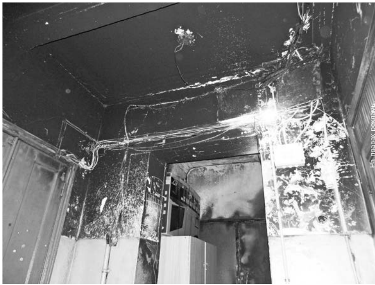
Так еще недавно выглядел подъезд №3 на ул.Кирова, 2.