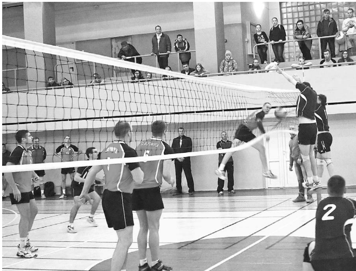
Один из острых моментов игры: атака североморцев.

Наталья МОРОЗОВА.