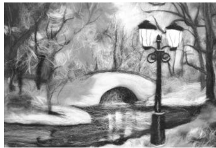
Шерстяной пейзаж не отличить от акварели.