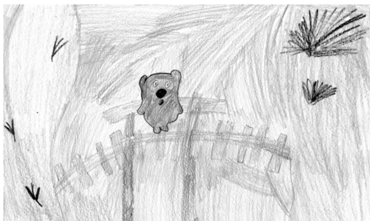
«Винни-Пух», София Лаврова (9 лет).

Коллективные работы от школ и детских садов не принимаются.