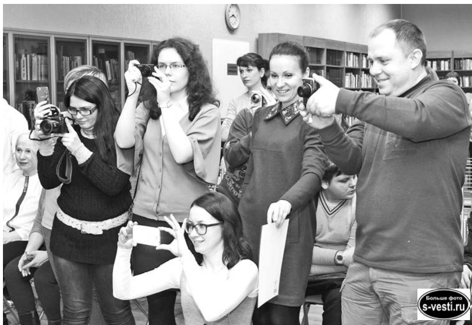
Таланты и поклонники: фото на память.