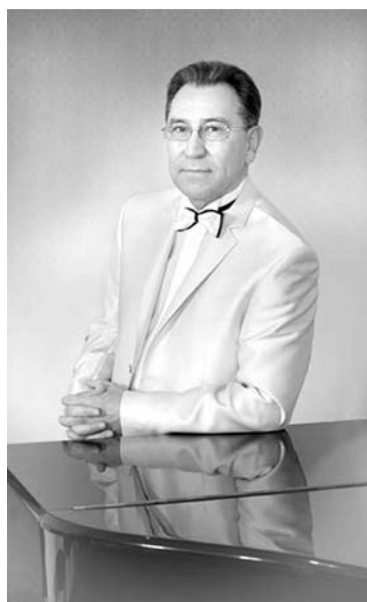
Композитор у любимого рояля.

— К юбилею я подготовил несколько творческих проектов, один из которых уже реализован. 6 июня в канун Дня города в Симферополе официально открылся семейный музей, в экспозиции которого представлены материалы о четырех поколениях нашей