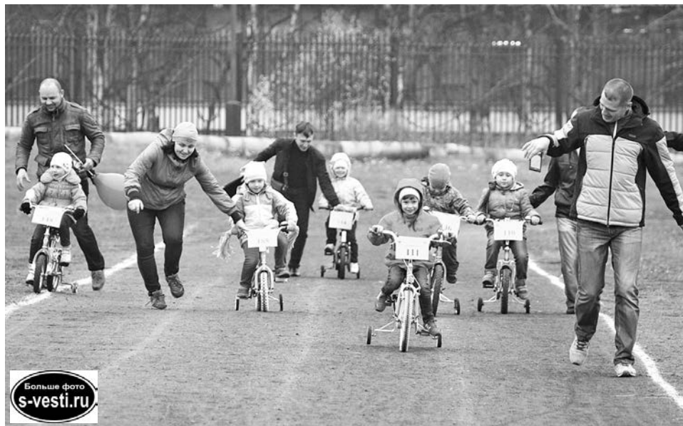
Больше фото s-vesti.ru