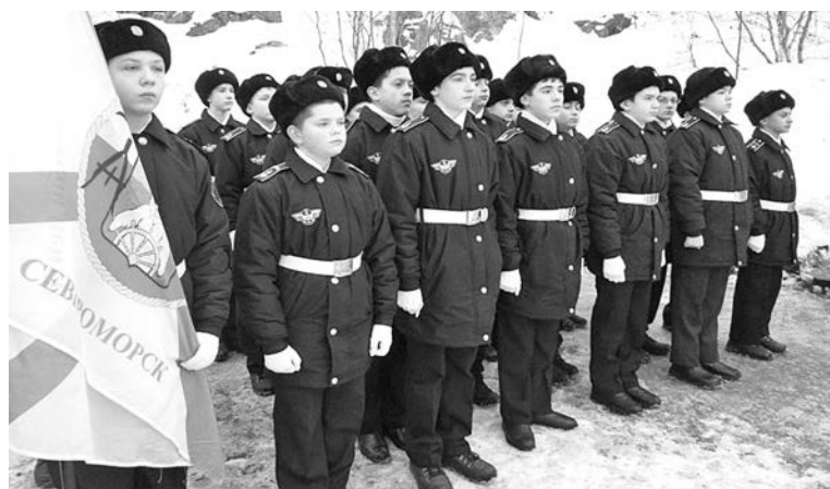
Курсанты морских классов стоят Вахты Памяти, участвуют в военно-патриотических мероприятиях, углубленно изучают историю России.

Второй год успешно функционирует Центр профессиональной