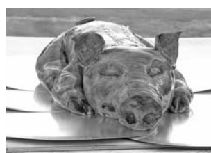
С виду - жареный поросенок, а в действительности - торт «Королевский».

В этой экспедиции благодаря таянию ледников специалисты смогли тщательно обследовать западную часть острова Северный архипелага Новая Земля в Баренцевом море. Гидрографы провели океанографические работы в заливах Борзова, Седова, Вилькицкого, Глазова и других. Специалисты зафиксировали образование 7 мысов и 4 проливов. Занимаясь ис-