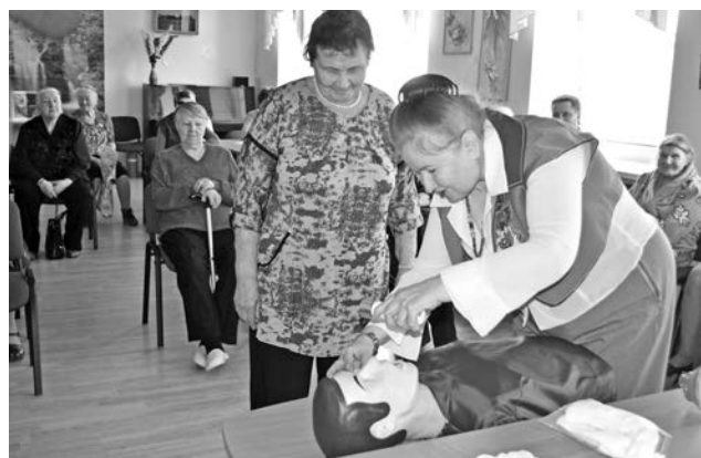
Пенсионеры демонстрировали приобретенные навыки реанимации на манекене.