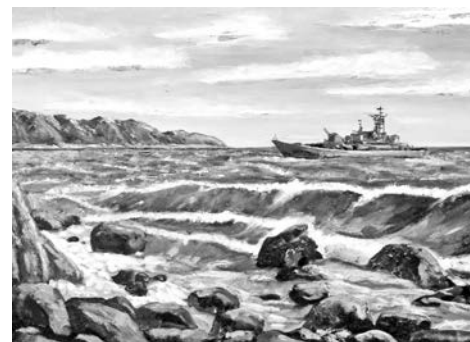
Марина Сайкова, «К родным берегам» (холст, масло).