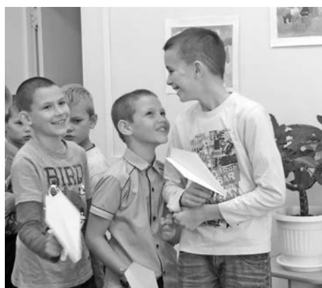
Будущие летчики к полету готовы!