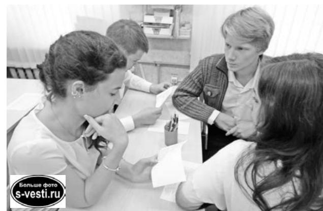
Сами медиаторы регулярно участвуют в обучающих семинарах и тренингах по решению конфликтов.

- Мне понравилось помогать людям. Да и самому служба примирения помогла научиться конт-