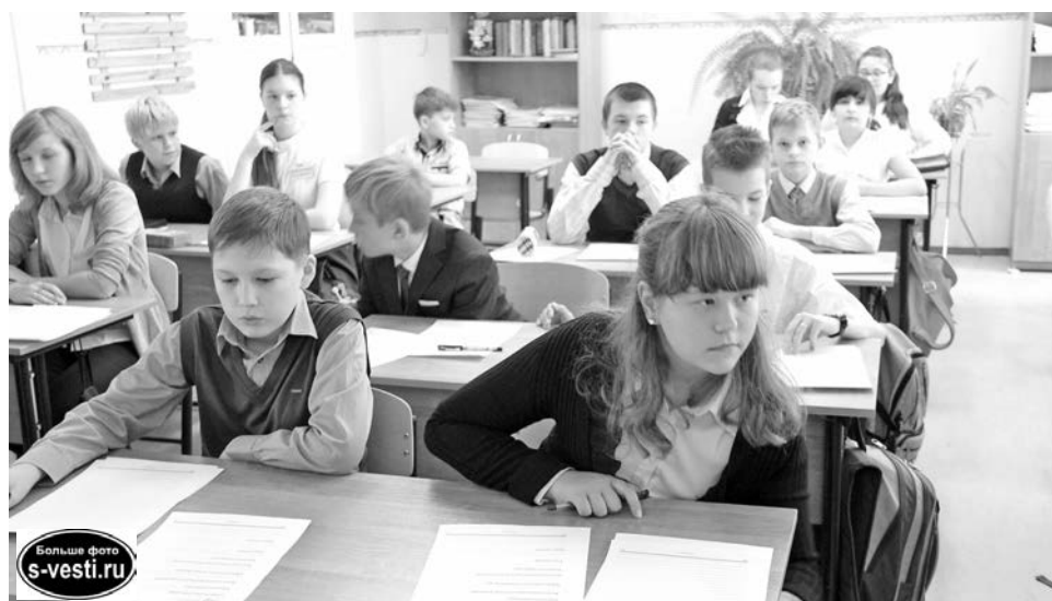
Настроило ребят на рабочий лад видеообращение первого замминистра Минобрнауки РФ Натальи Третьяк.