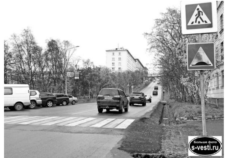
Споры вокруг новых искусственных неровностей не утихают. Но главное - безопасность.