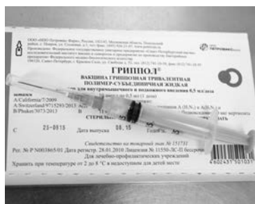
Отечественная вакцина не первый год доказывает свою эффективность.

Рекомендованный региональным Минздравом для ЗАТО Североморск процент вакцинированных должен составлять 28% - это около 11 тысяч человек, которые и создадут иммунную прослойку и не позволят гриппу перерасти в эпидемию. Обязательной вакцинации подлежат работники культуры, образования, торговли, транспорта, медработники, призывники, граждане старше 60 лет и лица, имеющие хронические заболевания (сердечно-сосудистой системы, онкозаболевания, бронхо-легочные заболевания), беременные женщины.