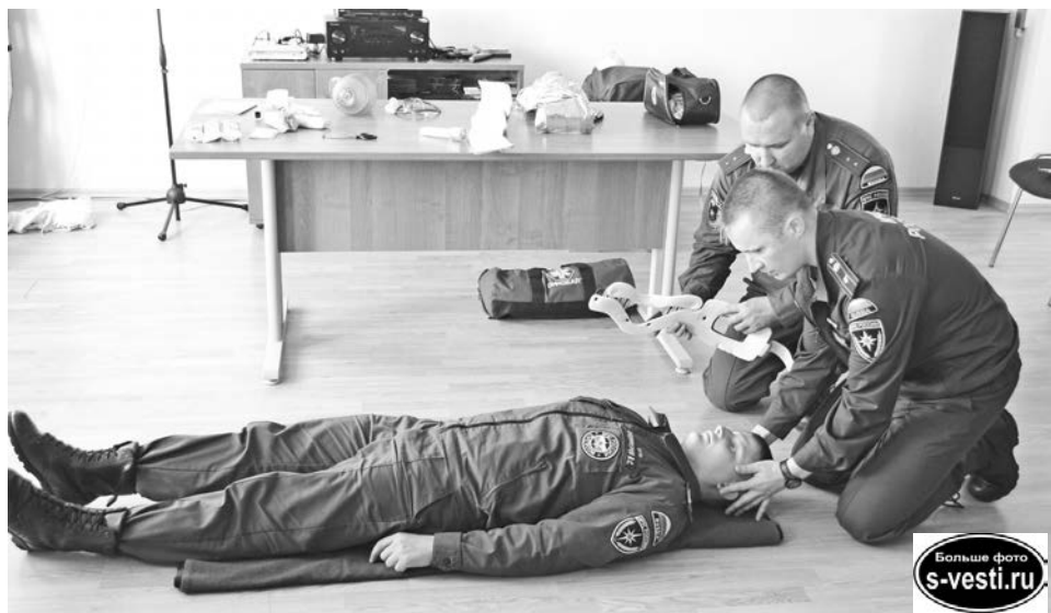
Фиксирующим воротником при травме шейного отдела позвоночника может стать одеяло или большое полотенце.