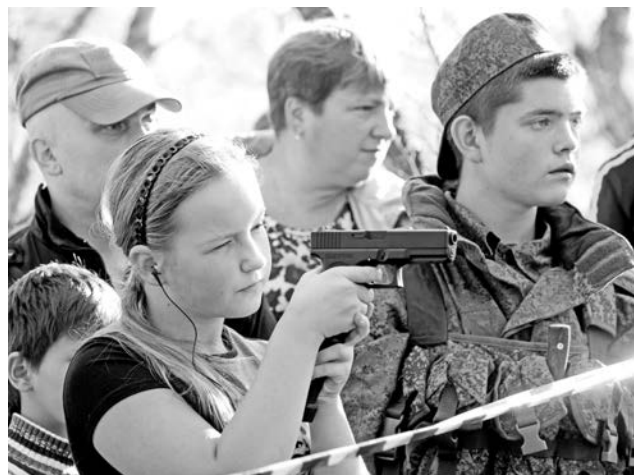
На мастер-классе по стрельбе к участникам военно-патриотического клуба «Рать» спешили даже девушки и убежденные пацифисты.

На этот раз навыки выживания в лесу продемонстрировали 80 человек из 8 команд. В минувшую пятницу школьники и студенты из военно-патриотических клубов, молодые скауты, спортсмены и волонтеры быстро и умело разбили лагерь, собрались готовиться к новым испытаниям, которые регулярно проходят во время слета. Но тут начался дождь, он лил всю ночь и прекратился только во второй половине дня в субботу.