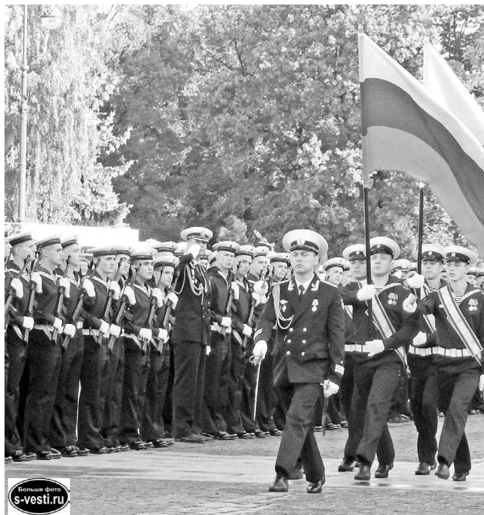
Большое фото s-vesti.ru