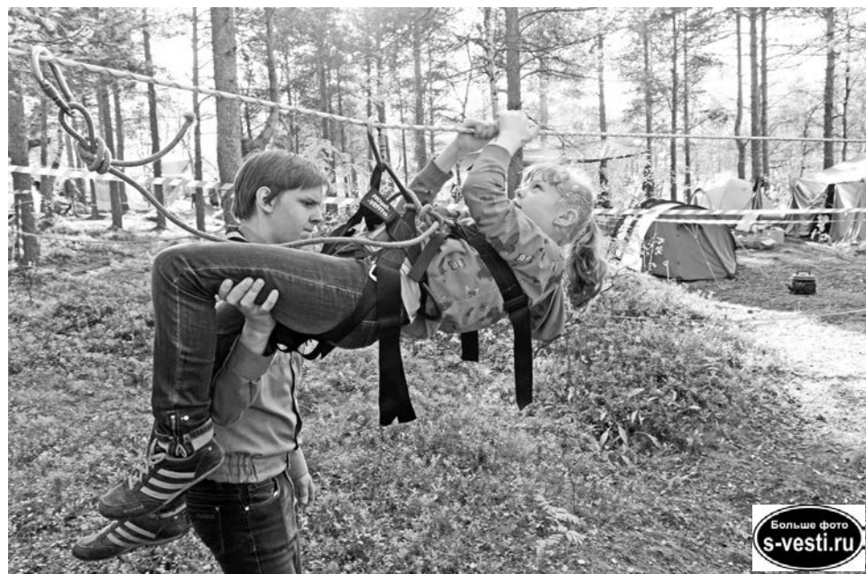
На веревочной переправе дополнительную страховку обеспечивали волонтеры.