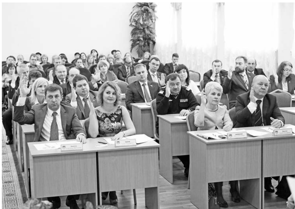
Первые решения депутаты городского совета пятого созыва приняли почти единогласно.