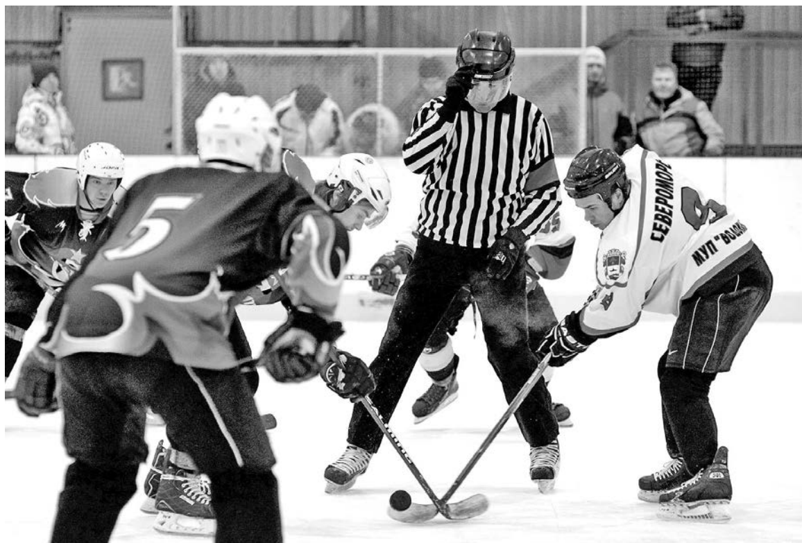
Ну, кто кого? Схватка между командами «Шторм» и «Апатит» была напряженной и бескомпромиссной.

Кроме того, в этом году в чемпионате есть важное новшество.