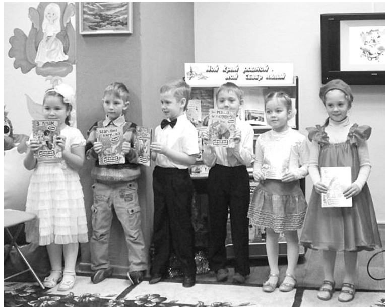
Для ребят из логопедических групп победа в конкурсе чтецов радостна вдвойне.

Наталья СТОЛЯРОВА. Фото из альбома детской библиотеки №1.