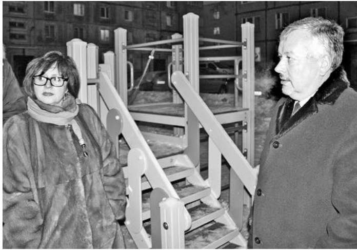
Качество установки детских модулей на Падорине удовлетворило руководство города. Со временем здесь появятся новые элементы.

Жаловались жильцы и на частные автомобили, водители которых проезжают к месту парковки прямо по тротуару. ГЦ ЖКХ совместно с ООО «Автомобильный сервис» установил ограждения, препятствующие въезду бетонных блоков (кстати, те самые, которые раньше служили ограждением на Приморской площади), однако автовладельцы нашли лазейки и продол-