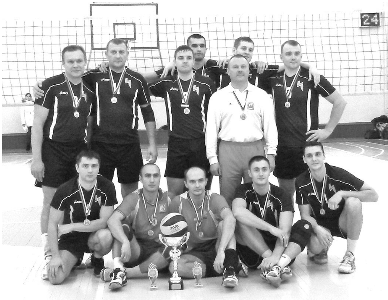
На протяжении всего чемпионата наша волейбольная дружина демонстрировала отличный сплав опыта и молодости, коллективного и индивидуального мастерства.

Последний день игр начался с матча за 3-е место, в котором встречались Кировск и Мурманск. «МГТУ»