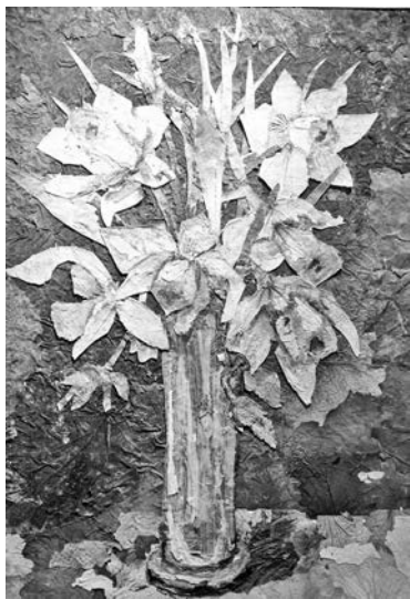
«Нарциссы» (мать-и-мачеха, роза, анютины глазки, чеснок).

ко. – Учеба, дом, семья не оставляли на это времени. А семь лет назад увидела у коллеги потрясающие картины из листьев – и сразу почувствовала непреодолимое желание повторить.