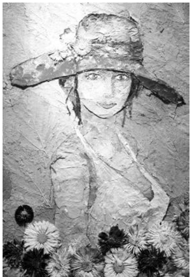
«Прекрасная незнакомка» (малина, роза, хризантема).