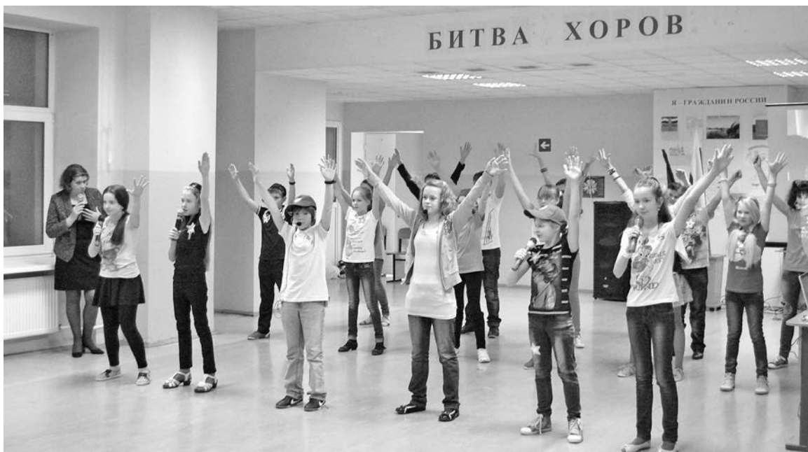
Гран-при конкурсное жюри присудило 6 «А» с песней «Родина моя».

первая «Битва хоров», где соревновались ребята с 5 по 7 классы. Обязательное условие конкурса – выступление всего класса вместе с руководителем. Следующий концерт, где выступят старшеклассники, пройдет в субботу, 21 декабря. Так что нерав-