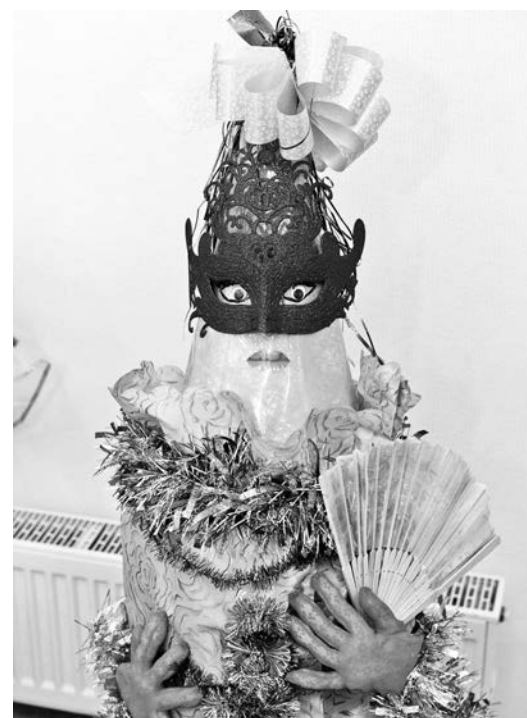
«Косто-ёлка», д/с №47; «Нарядилась на Олимпиаду», д/с №16 (группа «Лапушка»); «Гламурно-карнавальная ёлка», д/с №50 (группа «Облачко»).

орехов, кизила и винограда: ёлочка полностью собрана из разнокалиберных косточек и орехов.