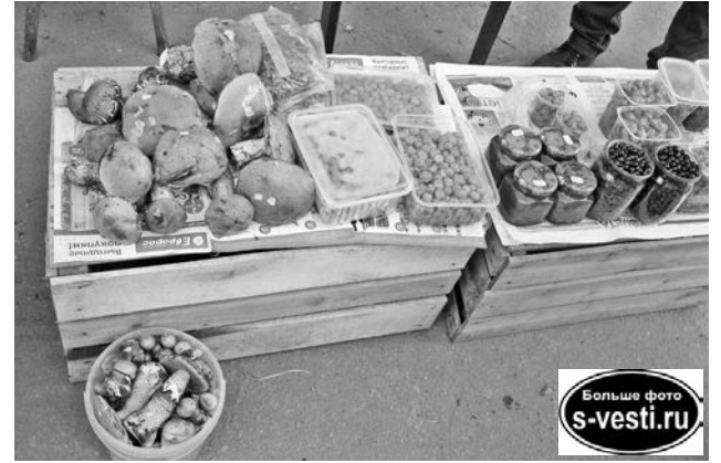
Для тех, у кого нет времени на «тихую охоту».

- Я 30 лет служил на Севере, жил в Североморске. Сейчас - в Петербурге. Приехал на месяц в отпуск. Кто-то к морю, на юг стремится. А я - на Север. Люблю грибы и ягоды в лесу собирать. Многие покупатели меня знают, доверяют. Я через день на этом рынке торгую. Кто