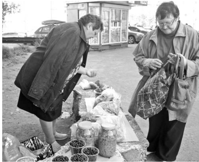
Прибыльная торговля съедобным товаром прямо у входа в продуктовый магазин имеет три слагаемых успеха: людской поток, эксклюзивный ассортимент, более низкая цена.