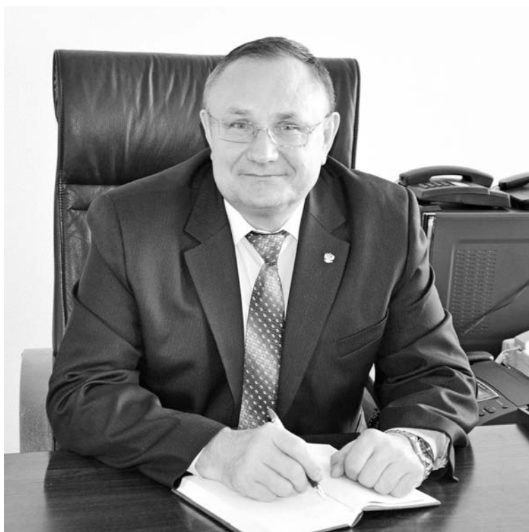
Заслуженный юрист Российской Федерации Александр Хомяков.