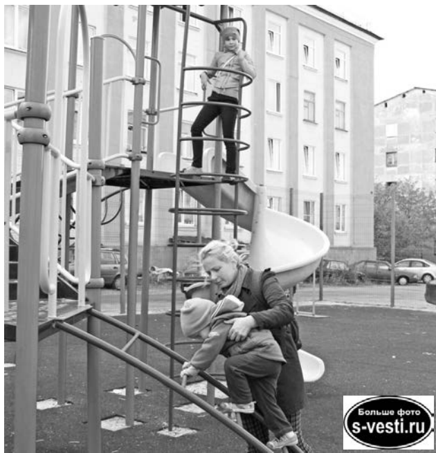
Игровой комплекс на ул.Комсомольской, 9 никогда не пустует.

тра Управления образования в здание бывшей вечерней школы на ул.Фулика. Помимо отдела молодежи, физкультуры и спорта здесь предполагается разместить молодежные организации.