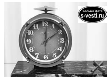
Будильник родом из СССР.

«Часы и время» — выездная выставка Мурманского областного краеведческого музея. Зрителям представлены десятки моделей карманных, наручных, настенных и даже корабельных часов, выпущенных в XX веке в