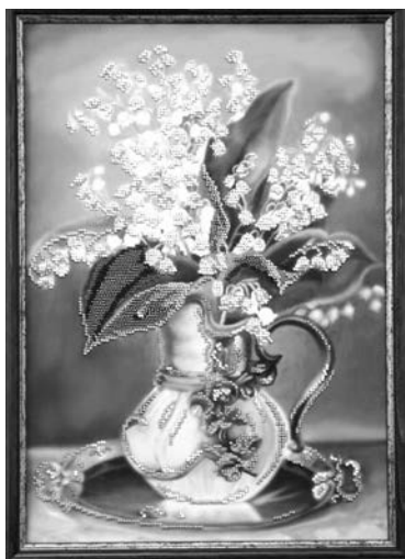
Зана Крыжановская, «Ландыши».

— Я называю бисер солнечным искусством, потому что в за-