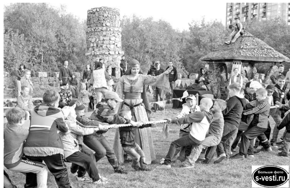
В присутствии настоящей принцессы юные кавалеры не сдавались до последнего.

В тот же день на стадионе пройдут соревнования для юных спортсменов от 2 до 10 лет. Детская дистанция - 400 м. Регистрация в 12.00, старт в 13.00.