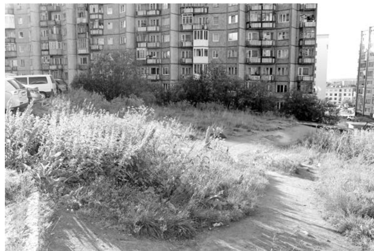
Склон перед Корабельной, 22 зарос бурьяном. А ведь его можно приспособить под парковку.

— Не секрет, что собрать жильцов целого дома для решения коммунальных вопросов крайне сложно. Что все-