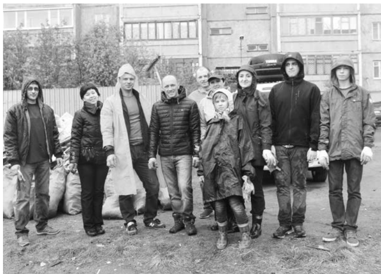
Даже дождливая погода не помешала проведению субботника в микрорайоне.