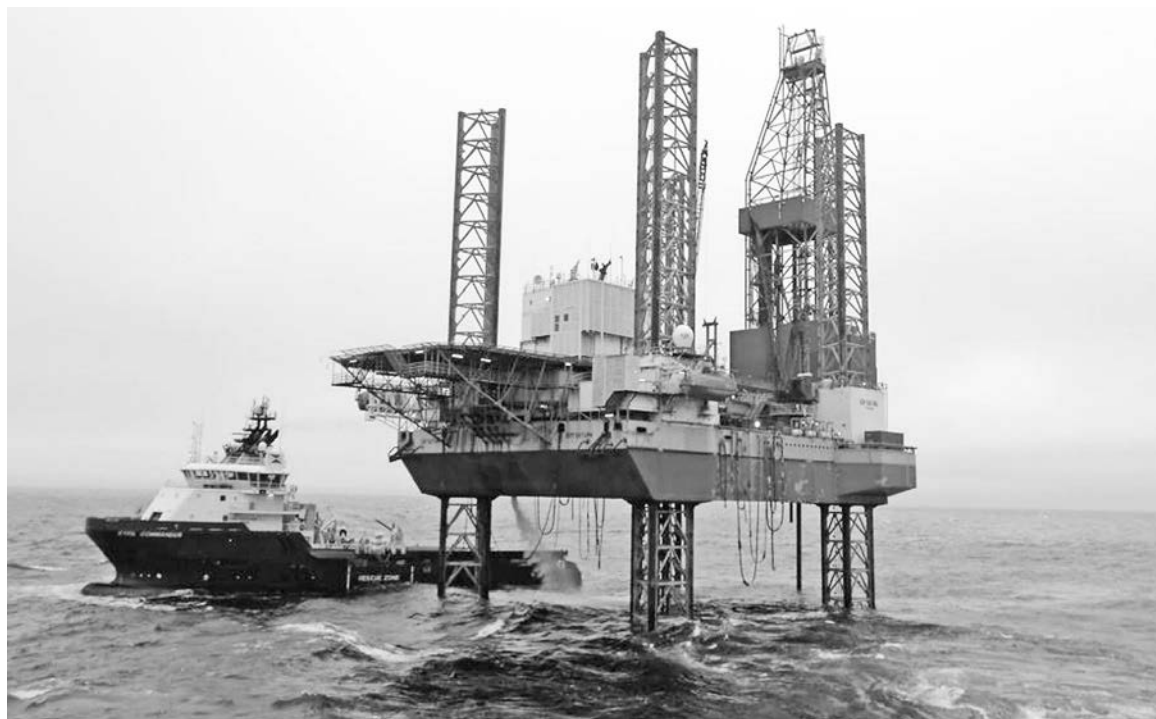
СПБУ «GSP Saturn» в Печорском море бурит скважину Северо-Долгинская №3.