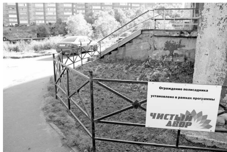
С появлением ограждения можно не опасаться, что на клумбе припаркуют автомобиль.