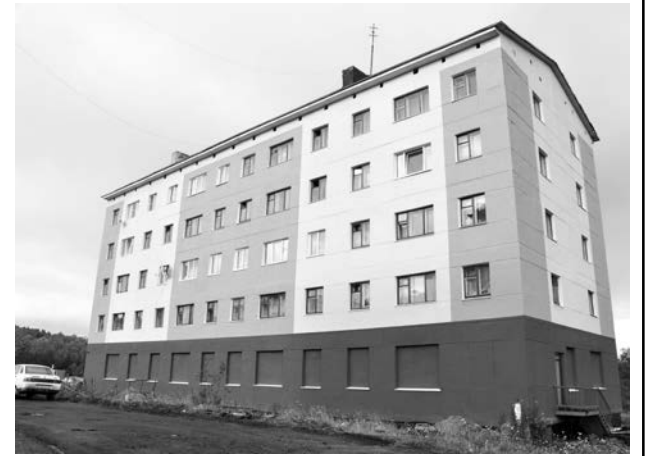
Первый отремонтированный дом по программе капремонта на ул. Восточной.

Почему? Потому что в закрытых городах много служебного и муниципального жилья, следовательно, здесь участие государ-