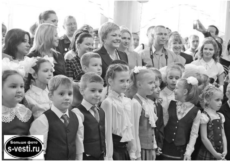
Губернатор Марина Ковтун в окружении первоклассников и их родителей в СШ №1.