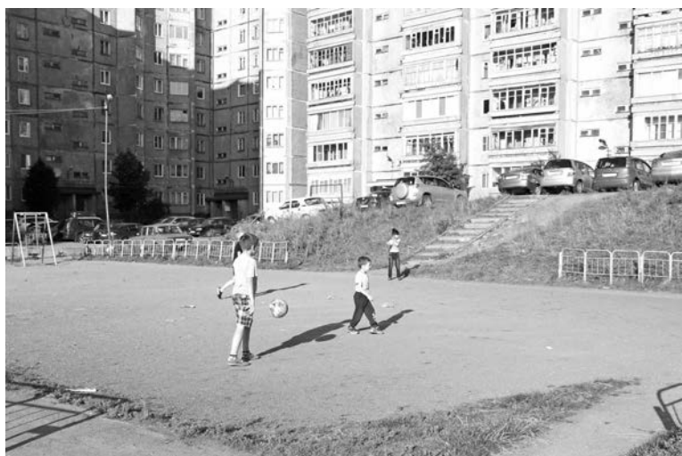
Это футбольное поле на Корабельной требует нового ограждения: мяч не должен попадать в песочницу.

та «Чистый двор» урны на ул. Морской и повесили информационные доски перед входом в подъезды на ул. Корабельной.