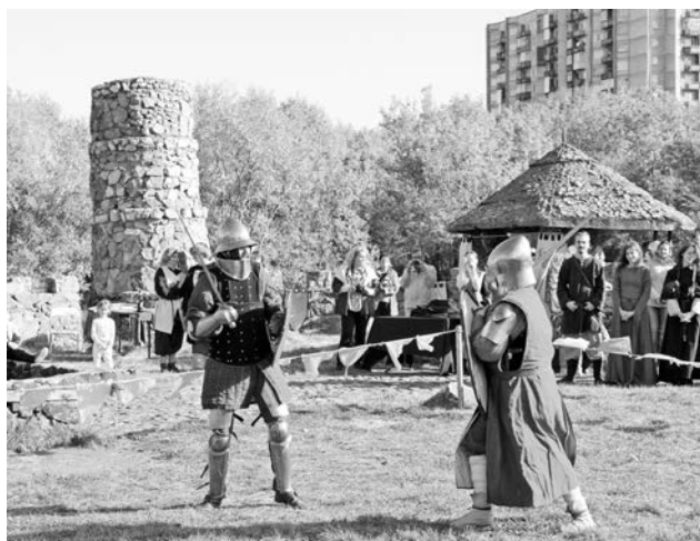
Показательный бой в исполнении благородных рыцарей из клуба «Фьорд».

— Дочери, можно сказать, выросли здесь. Это было одно из самых популярных мест для прогулок с детьми. На башнях стояли красивые деревянные скульптуры. Хочется, конечно, чтобы городок все-таки восстановили. — Я пропала здесь