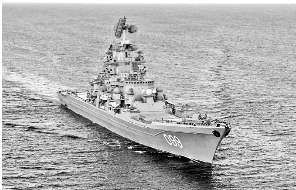
Более тысячи североморцев сейчас несут службу вдали от родных берегов, в том числе экипаж крейсера «Петр Великий».

Прошедший год знаменателен для флота арктическими походами к Новосибирским островам и архипелагу Земля Франца-Иосифа, дальними походами больших противолодочных кораблей «Североморск» и «Вице-адмирал Кулаков», проведением международных военно-