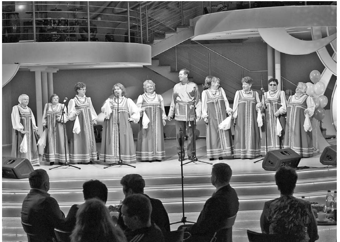
Когда «Надежда» начинает петь, назвать ее клубом людей с ограниченными возможностями язык не поворачивается.

– Не думаю, что в городе стало меньше инвалидов. Не все,